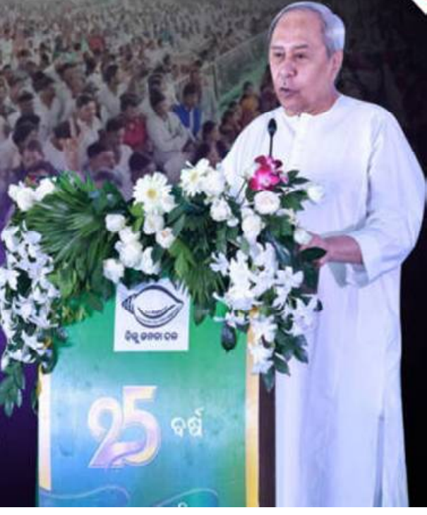
କରିବାକୁ ଥିବ ବୋଲି ନବୀନ ପଟ୍ଟନାୟକ କହିଛନ୍ତି।

ପୁରୀ/ ଭୁବନେଶ୍ୱର ଭୁବନେଶ୍ୱର, ୨୬/୧୨ (ନି.ପ୍ର): - ବିଜୁ ଜନତା ଦଳ ୨୫ ବର୍ଷ ପୂରଣ କରି ୨୬ ବର୍ଷରେ ପହଞ୍ଚିଛି। ଏହି ଅବସରରେ ପୁରୀର ଚାଳକଣିଆ ଠାରେ ଦଳର ଏକ ବିଶାଳ ରାଜ୍ୟସ୍ତରୀୟ ସମାରୋହରେ ଦଳର ସଭାପତି ତଥା ମୁଖ୍ୟମନ୍ତ୍ରୀ ଶ୍ରୀ ନବୀନ ପଟ୍ଟନାୟକ ଉଦ୍‌ଘାଟନା ଦେଇ କହିଛନ୍ତି ଯେ ଆପଣମାନଙ୍କ ଆଶୀର୍ବାଦ ରହିଲେ ଆଗାମୀ ୧୦୦ ବର୍ଷ ପର୍ଯ୍ୟନ୍ତ ବିଜୁ ଜନତା ଦଳ ଓଡ଼ିଶାବାସୀଙ୍କ ସେବା କରି ଚାଲିବ। ମୁଖ୍ୟମନ୍ତ୍ରୀ ଆହୁରି କହିଛନ୍ତି, ଆଜି ବିଜେଡି ଓଡ଼ିଶାବାସୀଙ୍କ ସେବାରେ ୨୫ବର୍ଷ ପୂରଣ କରିଛି। ଓଡ଼ିଶାର ସାତେ ଟଙ୍କାଟି କନଟା ସେମାନଙ୍କ ସେବା କରିବା ପାଇଁ ୨୫ବର୍ଷ ପୂରଣ ଦେଉଥିବାକୁ ମୁଁ ଋଣୀ। ବିଜେଡି ଲୋକଙ୍କ ବିଶ୍ୱାସକୁ ଭିତ କରି ବହୁବର୍ଷ ହେଲା। ଶାସନ କରି