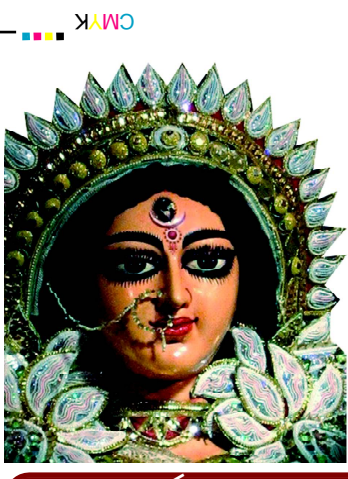
ଯା ଦେବୀ ସର୍ବଭୂତେଷୁ.....

ବାଲେଶ୍ୱର ■ ଶନିବାର ୧୭ ଡିସେମ୍ବର ୨୦୨୨ ■ ମୂଲ୍ୟ ଟ. ୨.୦୦ ପଇସା ■ ପୃଷ୍ଠା ୩-୪-୫-୬-୭-୮-୯-୧୦ ■ Baleshwar ■ SATURDAY 17 DECEMBER 2022 Vol.No. 33 ■ No. 328 ■ Price :Rs.2.00 ( 8 pages) ■ R.N.I. Registered No. 52528/91 ■ Postal Registered No. Balasore(Odisha)/005/2019