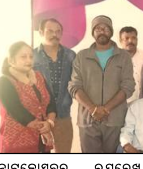
କେନ୍ଦ୍ରାପଡ଼ା, ୧୭/୧୨ (ନି.ପ୍ର): କେନ୍ଦ୍ରାପଡ଼ା ସ୍ୱୟମ୍ ସେବା ସମାଜ ପକ୍ଷରୁ ନିର୍ବାଚନ ପରେ ବିଧାୟକ ଶ୍ରୀ ବିନୟ କୁମାର ଦେବେଶଙ୍କୁ ପ୍ରଶ୍ନ କରାଯାଇଛି ।

କେନ୍ଦ୍ରାପଡ଼ା, ୧୭/୧୨ (ନି.ପ୍ର): ରାଜ୍ୟ ଓଡ଼ିଆ ଭାଷା, ସାହିତ୍ୟ ଓ ସଂସ୍କୃତି ବିଭାଗ ସହଯୋଗରେ କେନ୍ଦ୍ରାପଡ଼ା ସ୍ୱୟମ୍ ସେବା ସମାଜ ପକ୍ଷରୁ ନିର୍ବାଚନ ପରେ ବିଧାୟକ ଶ୍ରୀ ବିନୟ କୁମାର ଦେବେଶଙ୍କୁ ପ୍ରଶ୍ନ କରାଯାଇଛି ।