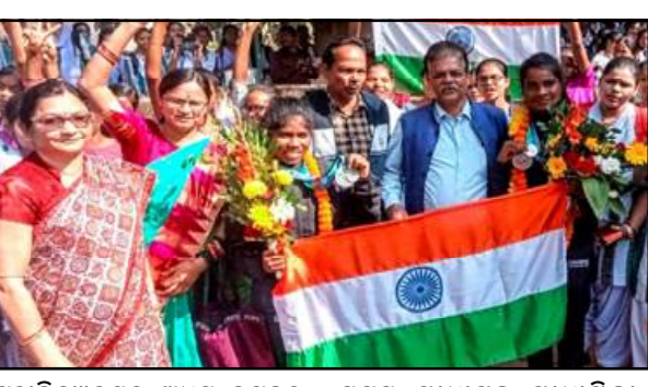
କେନ୍ଦ୍ରାପଡ଼ା, ୧୭/୧୨ (ନି.ପ୍ର): କେନ୍ଦ୍ରାପଡ଼ା ସ୍ୱୟମ୍ ସେବା ସମାଜ ପକ୍ଷରୁ ନିର୍ବାଚନ ପରେ ବିଧାୟକ ଶ୍ରୀ ବିନୟ କୁମାର ଦେବେଶଙ୍କୁ ପ୍ରଶ୍ନ କରାଯାଇଛି ।