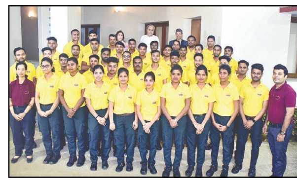
ବ୍ୟବସ୍ଥା(ୟୁଏସଏ)ରୁ ବୁଦାନ୍ତରଣ ଶିଖିବେ । ସେହିପରି ଅନ୍ୟ ୨୦ଜଣ ସ୍ୱୟଂଚାଳିତ ଭ୍ରାମ୍ୟମାଣ ରୋବଟ ଓ ଶିଖିକେନ୍ଦ୍ରୀକ ରୋବଟ ସଂପର୍କରେ ଦକ୍ଷତା ହାସଲ କରିବେ । ଏହି ବିଭିନ୍ନ କାର୍ଯ୍ୟକ୍ରମ ରାଜ୍ୟ ସରକାରଙ୍କ ଦକ୍ଷତା ବିକାଶ ପ୍ରୋଗ୍ରାମର ଅଂଶ ।

ଏହି ୪୦ଜଣ ଛାତ୍ରଛାତ୍ରୀଙ୍କ ମଧ୍ୟରେ ୩୨ଜଣ ବାଳକ, ୮ଜଣ ବାଳିକା ଅଛନ୍ତି । ସେମାନଙ୍କ ମଧ୍ୟରୁ ୨୦ଜଣ କୃଷକ ପରିବାରରୁ ଆସିଛନ୍ତି । ସିଙ୍ଗାପୁର ଆଇଟିଇଏଫ୍ ଯିବା ପୂର୍ବରୁ କାର୍ଯ୍ୟକ୍ରମରେ ସେମାନେ ୨ ସପ୍ତାହ କାର୍ଯ୍ୟକ୍ରମ କରିବେ । ସ୍ଥାନୀୟ ସୁବଳମାନଙ୍କ ସାମାଜିକ ଓ ସାଂସ୍କୃତିକ ବିଶ୍ୱାସକୁ ସହିତ ପରିଚିତ ହେବେ । ବିଶ୍ୱ ଦକ୍ଷତା କେନ୍ଦ୍ର ଛାତ୍ରଛାତ୍ରୀମାନଙ୍କୁ ବିଶ୍ୱସ୍ତରୀୟ ସୁଯୋଗ ଦେବା ସହିତ ଶିକ୍ଷଣୀୟ ଅଭିଭାବଣା ସମ୍ପୂର୍ଣ୍ଣ କରିବା ହେଉଛି ଏହି କାର୍ଯ୍ୟକ୍ରମର ମୁଖ୍ୟ ଉଦ୍ଦେଶ୍ୟ । ସିଙ୍ଗାପୁରରେ ୨୦ଜଣ ଛାତ୍ରଛାତ୍ରୀ ମାନବ ବିହୀନ ବିମାନ(ୟୁଏଭି)ର ପ୍ରୋଗ୍ରାମ୍ ଓ ମାନବ ବିହୀନ ବିମାନ