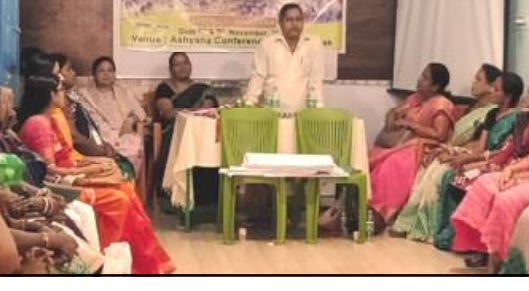
ଅଲୋକପାତ କରିଥିଲେ । ଜିଲ୍ଲା ସମାଜ ମଙ୍ଗଳ ଅଧିକାରୀଙ୍କୁ ମଧ୍ୟ ଅଲୋକପାତ କରିଥିଲେ ।

ଭୁବନେଶ୍ୱର, ୦୫/୧୧ (ନି.ପ୍ର): ସ୍ଥାନୀୟ ବାଉଁଶ ଶିଳ୍ପ ଆସିଆନା ସଭାଗୃହରେ ମହିଳା ଓ ଶିଶୁ ବିକାଶ ବିଭାଗ ଦ୍ୱାରା ପରିଚାଳିତ ଅଦିକା ୨ ଦିନିଆ କର୍ମଶାଳା ଅତିରିକ୍ତ ସମାଜ ମଙ୍ଗଳ ଅଧିକାରୀଙ୍କୁ ସୁଯୋଗ ମହାତ୍ତ୍ୱ ଦ୍ୱାରା ଉଦ୍‌ଘାଟିତ ହୋଇଯାଇଛି ।