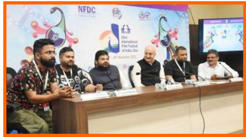
ଦେଖିବାକୁ ଗଲେ ଫିଲ୍ମଟି ପିତା-ପୁତ୍ରଙ୍କ ଜଡ଼ିତ ଗୋଆରେ ଚାଲିଥିବା ଚଳଚ୍ଚିତ୍ର ମହୋତ୍ସବରେ ସମ୍ପର୍କ ବିଷୟରେ ବୋଲି କହିପାରିବେ । ଏହି ଫିଲ୍ମ ଖୁବ ପ୍ରଶଂସା ସାଞ୍ଜିବିକା ।