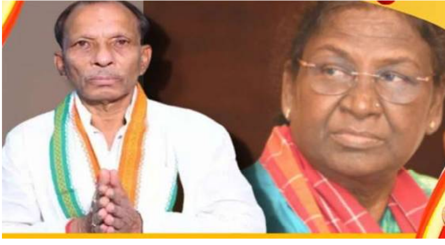
ସର୍ବସମ୍ମୁଖରେ କ୍ଷମାମାଗତ୍ୱ ଓ ରାଷ୍ଟ୍ରପତିଙ୍କ ସମ୍ପର୍କରେ ଆପଞ୍ଚିତମାନଙ୍କ ତିପଣା ଦେଇଥିବା ମନ୍ତ୍ରୀଙ୍କୁ ରିମୁଫ୍ଟ କରିବାକୁ ଦାବି କରିଛନ୍ତି ବିକେପି କର୍ମୀ ଓ କର୍ମୀ ।

ଭୁବନେଶ୍ୱର, ୧୨/୧୧ (ନି.ପ୍ର): ରାଷ୍ଟ୍ରପତି ଦ୍ରୌପଦୀ ମୁର୍ତ୍ତିଙ୍କ ସମ୍ପର୍କରେ ପଶ୍ଚିମବଙ୍ଗ କ୍ୟାବିନେଟ୍ ମନ୍ତ୍ରୀ ବିବାଦୀୟ ସମ୍ବନ୍ଧୀୟ ପଦଧାରଣା ପଦ୍ଧତିରେ ଭାଇଭାଇ ହେବା ପରେ ସାରା ଦେଶରେ ଝଟ ପୁଷ୍ଟି ହୋଇଛି । ମହାମହିମାଙ୍କ ସମ୍ପର୍କରେ ମମତାଙ୍କ ମନ୍ତ୍ରୀଙ୍କ ଏଭଳି ବ୍ୟବସ୍ଥାକୁ କେହି ସହଜରେ ଗ୍ରହଣ କରି ପାରିନାହାନ୍ତି । କୋଲକାତାରେ ଭୁବନେଶ୍ୱର ସମ୍ବନ୍ଧୀୟ ମୂଳିକ ପ୍ରତିବାଦୀ ପଶ୍ଚିମବଙ୍ଗର ବିଭିନ୍ନ ସ୍ଥାନରେ ଦେଖିବାକୁ ମିଳିଛି ପ୍ରତିବାଦ । ମମତା ବାନାର୍ଜୀ ଓ ମନ୍ତ୍ରୀଙ୍କ ବିରୋଧରେ ନାରାବାଜି କରିବା ସହ ବିଶେଷ କରି ଭଣ୍ଡାଟି ବିକେପି କର୍ମୀ । କୁଶପୁତଳିକା ମଧ୍ୟ ଦାବ କରିଛନ୍ତି । ମମତା ବାନାର୍ଜୀ