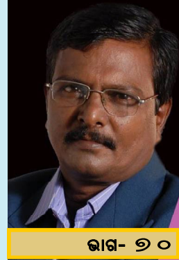
ରାଗ- ୭ ୦