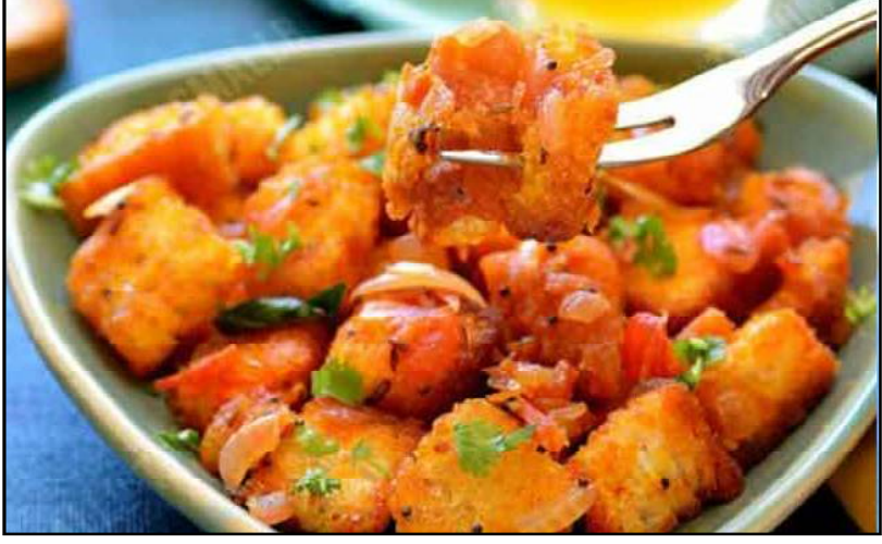
ରଖିଥିବା ବ୍ରେଡ୍‌ଖଣ୍ଡ ଗୁଡ଼ିକୁ ମସଲାର ପକାଇ ଭଲଭାବେ ଗୋଳାଇ ଦିଅନ୍ତୁ। କିଛି ସମୟ ପରେ ଗ୍ୟାସ୍‌କୁ ବନ୍ଦ କରିଦିଅନ୍ତୁ। ପ୍ରସ୍ତୁତ ହୋଇଗଲା 'ବ୍ରେଡ୍ ମସଲା'। ଏହାକୁ ଏକ ପ୍ଲେଟ୍‌ରେ କାଟି ଚା' ଉପରେ କଟା ଧନିଆ ପତ୍ର ଓ କଟା ପିଆଜ ପକାଇ ଗରମ ଗରମ ପରଷନ୍ତୁ।

ଆବଶ୍ୟକ ସାମଗ୍ରୀ: ବ୍ରେଡ୍, ପିଆଜ, ଅଦା, ଧନିଆ ପତ୍ର, କଞ୍ଚାଲଙ୍କା, ଚମାଚୋ, ଜିରା, ଆମରୁର ପାଉଁଶ, ହଳଦୀ ଗୁଣ୍ଡ, ଧନିଆ ଗୁଣ୍ଡ, ତେଲ ଓ ଲୁଣ। ପ୍ରସ୍ତୁତି ପ୍ରଣାଳୀ: ପ୍ରଥମେ ବ୍ରେଡ୍ ଗୁଡ଼ିକୁ ଛୋଟ ଛୋଟ ଖଣ୍ଡ କରି ଏକ ପାତ୍ରରେ ରଖନ୍ତୁ। ପରେ ତାକୁ କରେଇରେ ପକାଇ ଫ୍ରାଏ କରି ଦିଅନ୍ତୁ। ଏହାପରେ ପିଆଜ, ଧନିଆ, କଞ୍ଚାଲଙ୍କା, ଅଦା, ରସୁଣ ଓ ଚମାଚୋକୁ ଏକାଠି ବାଟିଦିଅନ୍ତୁ। କରେଇରେ ତେଲ ପକାଇ ଗରମ କରନ୍ତୁ। ତେଲ ଗରମ ହେବା ପରେ ସେଥିରେ ଜିରା ପକାନ୍ତୁ। ପରେ ମସଲାବଟାକୁ ପକାଇ ଭଲଭାବେ କଷି ଦିଅନ୍ତୁ। ମସଲା ଭଲଭାବେ କଷି ହୋଇଗଲେ ଅଳ୍ପ ପାଣି ଦେଇ ହଳଦୀ ଗୁଣ୍ଡ, ଧନିଆ ଗୁଣ୍ଡ ଓ ଆମରୁର ପାଉଁଶ ମିଶାଇ ପୁଣି ଆଉଥରେ ଭଲଭାବେ କଷିଦିଅନ୍ତୁ। ସେଥିରେ ସ୍ୱାଦ ଅନୁସାରେ ଲୁଣ ପକାଇ ଦିଅନ୍ତୁ। ଏହାପରେ କାଟି