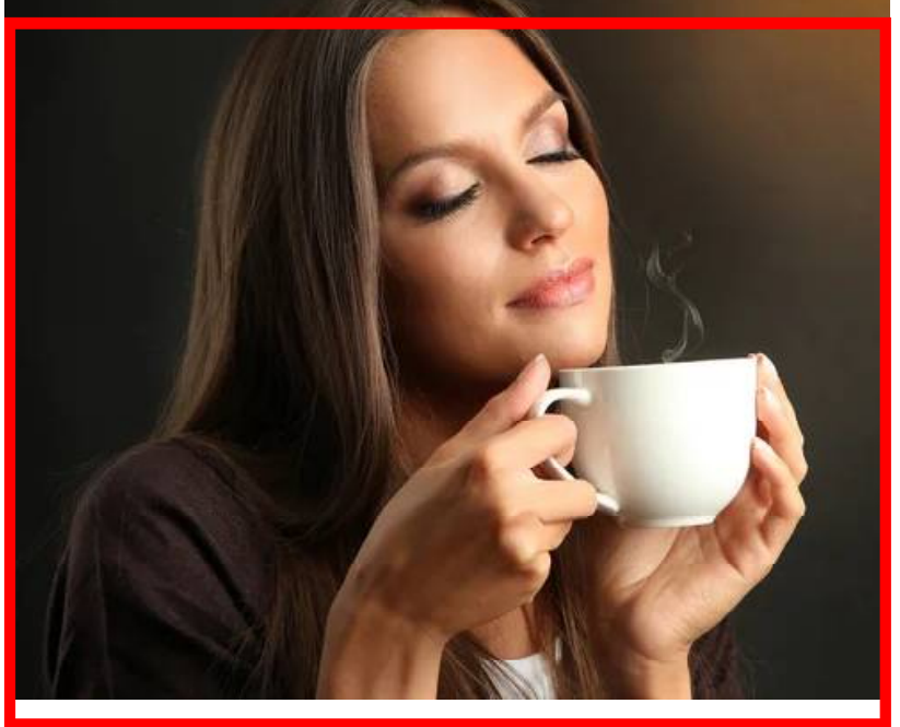
କଫି ପରିବର୍ତ୍ତେ ଆପଣ ଚା ପିଇବାକୁ ପସନ୍ଦ କରନ୍ତି କି? ଏହି ଗରମ ପାନୀୟ ସଂପର୍କରେ ଏକ ନୂଆ ସର୍ବୋଚ୍ଚ ଗବେଷଣା ହୋଇଛି। ସର୍ବୋଚ୍ଚ ଗବେଷଣା କାଣିବାକୁ ମିଳିଛି ଯେ କଫି ତୁଳନାରେ ଚା ପିଇବା ଭଲ। ଚା ପିଇବା ଦ୍ୱାରା ମୃତ୍ୟୁ ଆଶଙ୍କା ହ୍ରାସ ପାଇଥାଏ।

ଏ ନେଇ ନିକଟରେ ଇଂଲଣ୍ଡର ଗବେଷକମାନେ ଏକ ଗବେଷଣା କରିଥିଲେ। ଗବେଷଣାରୁ ଜଣାପଡ଼ିଲା ଯେ ଚା ପିଇନଥିବା ଲୋକଙ୍କ ମଧ୍ୟରେ ୧୩ ପ୍ରତିଶତ ମୃତ୍ୟୁ ଆଶଙ୍କା ରହିଥିବା ବେଳେ ଦିନକୁ ୨-୩ କପ୍ ଚା ପିଇନଥିବା ଲୋକଙ୍କ କ୍ଷେତ୍ରରେ ୯ ପ୍ରତିଶତ ମୃତ୍ୟୁ ସମ୍ଭାବନା ଥାଏ।