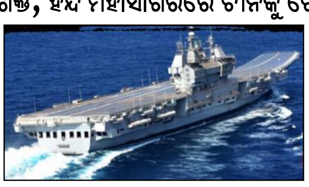
ଆଇଏନଏସ ବିକ୍ରାନ୍ତ । କେରଳ କୋଟିନଠାରେ ପ୍ରଧାନମନ୍ତ୍ରୀ ଏହାକୁ ଦେଖି ଉଦ୍ଦେଶ୍ୟରେ ସମର୍ପଣ କରିଛନ୍ତି । ବିକ୍ରାନ୍ତ ସାମିଲ ହେବା ପରେ ନୌସେନାର ଶକ୍ତି ବୃଦ୍ଧି ପାଇବ । ଏହାସହ ଭାରତ ମହାସାଗରରେ ଚୀନ ନିକଟ ଦୂରତା କାହିଁକି କରୁଥିବାବେଳେ

ନୂଆଦିଲ୍ଲୀ, ୦୨/୦୯ : ସୁଦେଶୀ କୋଶଳରେ ନିର୍ମିତ ଏୟାରକ୍ରାଫ୍ଟ କ୍ୟାରିୟର ଆଇଏନଏସ ବିକ୍ରାନ୍ତ ଶୁକ୍ରବାର ଭାରତୀୟ ସେନାରେ ସାମିଲ ହୋଇଛି । ନୌସେନାକୁ ଏହି ବଡ଼ ଉପହାର ଦେଇଛନ୍ତି ପ୍ରଧାନମନ୍ତ୍ରୀ ମୋଦୀ ଓ ପ୍ରତିରକ୍ଷାମନ୍ତ୍ରୀ ରାଜନାଥ ସିଂ । ପୁରୁଣା ଆଇଏନଏସ ବିକ୍ରାନ୍ତର ଅବସର ନେବା ୧୮ବର୍ଷ ପରେ ଏବେ ସେନାରେ ସାମିଲ ହୋଇଛି । ସୁଦେଶୀ ଜ୍ଞାନକୌଶଳରେ ନିର୍ମିତ