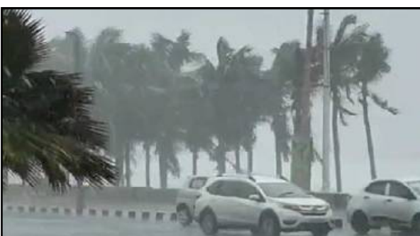
ରାଜ୍ୟରେ ଆସନ୍ତା ୫ ତାରିଖରୁ ବର୍ଷା ପରିମାଣ ବୃଦ୍ଧିର ସମ୍ଭାବନା ରହିଛି । ସେପ୍ଟେମ୍ବର ୪ ତାରିଖ ପର୍ଯ୍ୟନ୍ତ ରାଜ୍ୟରେ ବିଭିନ୍ନ ଅଞ୍ଚଳରେ ହାଲୁକା ମଧ୍ୟମ ବର୍ଷା ସମ୍ଭାବନା ରହିଥିବା ଭୁବନେଶ୍ୱର ଆଞ୍ଚଳିକ ପାଣିପାଗ କେନ୍ଦ୍ର ପକ୍ଷରୁ ଜଣାଯାଇଛି । ସେଥିପାଇଁ ୪ ତାରିଖ ପର୍ଯ୍ୟନ୍ତ ବିଭିନ୍ନ ଜିଲ୍ଲାକୁ ଯେଲେ ଖୁସି କାରି କରାଯାଇଛି । ଆଜି ସକାଳ ସାଢ଼େ ୮ଟାରୁ ୩ ତାରିଖ ସକାଳ ସାଢ଼େ ୮ଟା ପର୍ଯ୍ୟନ୍ତ ୧୦ଟି ଜିଲ୍ଲାରେ ଉତ୍ତମ ସହ ବର୍ଷା ହେବ । ସେହି ଜିଲ୍ଲା । ପୃଷ୍ଠା ୭

ଭୁବନେଶ୍ୱର, ୦୨/୦୯ (ନି.ପ୍ର) : ଆସନ୍ତା ୨ ସପ୍ତାହ ମଧ୍ୟରେ ୨ଟି ଲଘୁଚାପ ସେପ୍ଟେମ୍ବର ପୃଷ୍ଠି ହେବାର ସମ୍ଭାବନା ରହିଛି । ଏନେଇ ଭୁବନେଶ୍ୱର ଆଞ୍ଚଳିକ ପାଣିପାଗ ବିଜ୍ଞାନ କେନ୍ଦ୍ରର ପାଣିପାଗ ବିଜ୍ଞାନୀ ଉପାଖ୍ୟାତ ଦାସ ସୂଚନା ଦେଇଛନ୍ତି । ଶ୍ରୀ ଦାସଙ୍କ ସୂଚନା ଅନୁସାରେ, ପଶ୍ଚିମ କେନ୍ଦ୍ରୀୟ ବଙ୍ଗୋପସାଗରରେ ଦୁଇଟି ଲଘୁଚାପ ସେପ୍ଟେମ୍ବର ପୃଷ୍ଠି ହେବାର ସମ୍ଭାବନା ରହିଛି । ପ୍ରଥମ ଲଘୁଚାପଟି ଆସନ୍ତା ୮ ତାରିଖ ମଧ୍ୟରେ ପୃଷ୍ଠି ହୋଇପାରେ । ଦ୍ୱିତୀୟ ଲଘୁଚାପଟି ସେପ୍ଟେମ୍ବର ୯ରୁ ୧୫ ତାରିଖ ମଧ୍ୟରେ ପୃଷ୍ଠି ହେବାର ସମ୍ଭାବନା ରହିଛି । ଏହା ପ୍ରଭାବରେ