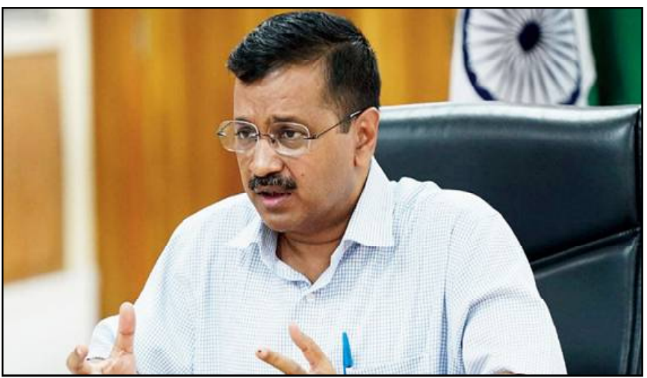
ଲାଞ୍ଚ ଦେଇ ୨୭୭ କଣ ବିଧାୟକଙ୍କୁ କଣିସାରିଲାଣି । ରାଜ୍ୟର ଅଣବିଜେପି ଶାସିତ ରାଜ୍ୟରେ ସରକାରଙ୍କୁ ଭାଙ୍ଗିବାକୁ ବିଜେପି ଉଦ୍ୟମ କରୁଥିବା ଅଭିଯୋଗ ହୋଇଛି ।

ନୂଆଦିଲ୍ଲୀ, ୦୨/୦୯ : ବିଜେପି ବିରୋଧରେ ମୋର୍ଚ୍ଚା ଖୋଲିଛି ଆପ ଆଦମା ପାର୍ଟି । ଆପର ଅଭିଯୋଗ, ଦେଶସାରା ଅପରାଧର ଲୋଟସ କରି ବିଭିନ୍ନ ରାଜ୍ୟର ସରକାର ଭାଙ୍ଗି ବିଜେପି ତେଣୁ ଏହାର ବିବିଧାଳ ଚଳାଯାଉ । ଏହି ଦାବି ନେଇ ବିବିଧାଳ ମୁଖ୍ୟମନ୍ତ୍ରୀ ସମ୍ମୁଖରେ ପହଞ୍ଚି ଆପ ନେତାମାନେ କୋରଦାର ବିକ୍ଷୋଭ ମଧ୍ୟ କରୁଛନ୍ତି । ବିଭିନ୍ନ ରାଜ୍ୟର ସରକାର ପ୍ରତି ବିଜେପି ଶତ୍ରୁତା କରୁଛି । ସରକାର ପ୍ରତିଅପମାନ ଦୃଷ୍ଟି କରୁଛି । ଏଭଳି କିଛି ଅଭିଯୋଗ ଆଣି ରାଷ୍ଟ୍ରପତିଙ୍କ ସହ ଆଲୋଚନା ପାଇଁ ସମୟ ମାଗିଛି ଆପ ଆଦମା ପାର୍ଟି । ଆପ କହିଛି ବିଜେପି ପ୍ରାୟ ୬୩୫୫ଟି କୋଟି