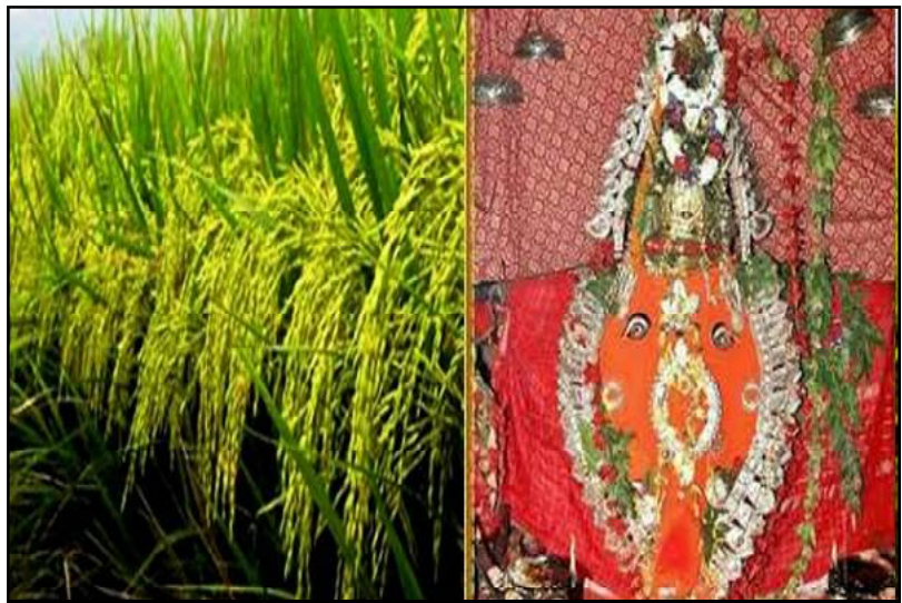
ରାଜ୍ୟ ପ୍ରତିଷ୍ଠା କରି ନବାନୁ ଭକ୍ଷଣ ଉତ୍ସବ ଆରମ୍ଭ କରିଥିଲେ । ଆମ ପୁରାଣ ଶାସ୍ତ୍ରରେ ଅନୁର ମହିମା ଅନୁରୁହ ରୂପେ ପ୍ରତିପାଦିତ ହୋଇଛି କୁହାଯାଇଛି , କର୍ମ ରୁ ଯଜ୍ଞ , ଯଜ୍ଞ ରୁ ବୃଷ୍ଟି , ବୃଷ୍ଟି ରୁ ଶସ୍ୟ ଶତାବ୍ଦୀର ଆରମ୍ଭରେ ରାଜା ବଳରାମ ସମ୍ବଲପୁର

ପର୍ବମାତୃକ ଅର୍ଥାତ ସମ୍ପର୍କପୁର, ସୋନପୁର, ସୁନ୍ଦରଗଡ଼, ବଲାଙ୍ଗିରୀ, ନୂଆପଡ଼ା, କଳାହାଣ୍ଡି, ଦେବଗଡ଼ ଓ ଝାରସୁନ୍ଦରୀ ପ୍ରଭୃତି ଜିଲ୍ଲାରେ ଏକ ପ୍ରଧାନ ଗଣପର୍ବ ରୂପେ ନୂଆଁଖାଇ ଭେଟପାଟ (ବା) ନବାନୁ ଭକ୍ଷଣ ଉତ୍ସବ ବହୁବର୍ଷ ଧରି ପାଳିତ ହୋଇ ଆସୁଅଛି । ଓଡ଼ିଶା ବାହାରେ ମଧ୍ୟପ୍ରଦେଶ, ଛତିଶଗଡ଼ରେ ବାସ କରୁଥିବା ଓଡ଼ିଆମାନେ ଏହି ପର୍ବ ଆନନ୍ଦ ଭଲ୍ଲୁସରେ ପାଳନ କରନ୍ତି । କନ୍ଧ, କୋହ୍ଲ, ଓରାମ ଜିଶାନ, ଭୂୟା ପ୍ରଭୃତି ଆଦିବାସୀମାନେ ସେମାନଙ୍କର ଉତ୍ସବଦେବାକୁ ନବାନୁ ଭୋଗ ସହିତ କୁହୁଡ଼ା, ଛେଳି ବଳି ଦେଇ ନୂଆଁଖାଇ ପର୍ବପାଳନ କରନ୍ତି । ଏହି ପର୍ବ ପରଠାରୁ ଆଦିବାସୀ ମାନଙ୍କର କରମା ପୂଜା ଆରମ୍ଭ ହୁଏ । ଦ୍ୱାଦଶ ଶତାବ୍ଦୀରେ ବଲାଙ୍ଗିର ପାଟଣାଗଡ଼ ଠାରେ ଚୌହାନ ରାଜବଂଶର ରମାଜଦେବ ନୂଆଁଖାଇ ପର୍ବର ଆରମ୍ଭ କରିବାର ଅନୁମାନ କରାଏ । ସେହିପରି ଷୋଡ଼ଶ ଶତାବ୍ଦୀର ଆରମ୍ଭରେ ରାଜା ବଳରାମ ସମ୍ବଲପୁର