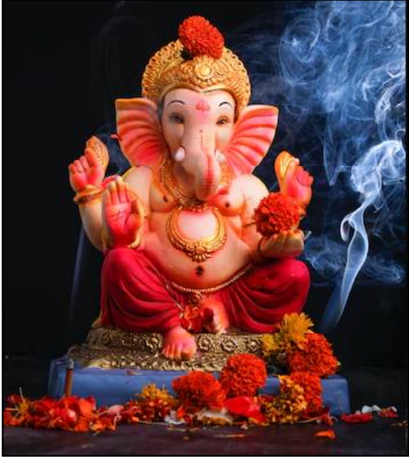
ଆୟୋଜନ କରିଥାନ୍ତି ସିଦ୍ଧିବାଦୀଙ୍କ ପୂଜାର୍ଚ୍ଚନା ।

ରାଜ୍ୟର ଅନ୍ୟତମ ଶିଳ୍ପ ନଗରୀ ଅନୁଗୋଳ ଓ ତାଳଚେରର ଗଣେଶ ଉତ୍ସବ ଗଣେଶ ଯାତ୍ରା ଭାବରେ ଖ୍ୟାତ । ଏହି ସମୟରେ ଦୁଇ ସହର ଜାକଜମକରେ