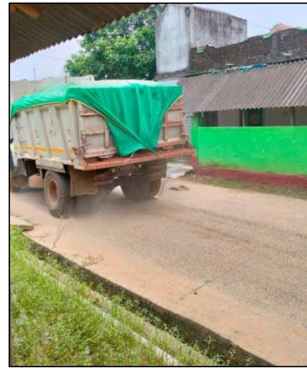
ଅଂଚଳରୁ ମୋରମ ଅଧିକ ମୋରମ ନୟାଗ୍ରାମ ଥାନାକୁ ଚୋରାଚୋରା ଯାଉଥିବା ସ୍ଥାନୀୟ ଲୋକେ କହିଛନ୍ତି ।

ରାଇବଣିଆର ଉତ୍ତର ଓ ପୂର୍ବ ଦିଗରେ ସୁବର୍ଣ୍ଣରେଖା ପ୍ରବାହିତ ହେଉଥିବାରୁ ଏହି ଅଂଚଳ ପାହାଡ଼ିଆ ଅଟେ । ସେ ଅଂଚଳର ମୋରମ ସରକାରୀ ନିଲାମ ଦିଆଯାଇନଥିବା ବେଳେ ସେଠାରୁ ଚୋରାଚୋରା ହୋଇ ଆସୁଛି । ବରଡ଼ିଆ ଅଂଚଳରେ ରାଇଖୋଳ ଗ୍ରାମନିକଟରୁ ଚୋରାଚୋରା ମୋରମ ପଶୁମଂଗଳ ଚାଲାଣ ହେଉଛି । ବିବା ରାତ୍ର କେତେକ ଚମ୍ପର ରାଇଖୋଳକୁ ଭାଙ୍ଗି ଅଗ୍ରଭାଗ ଛକ ବେଳ ୬୦୦ କାତାୟ ରାଜପଥରେ ପଶୁମଂଗଳ ଚାଲାଣ କରୁଥିବା କୁହାଯାଇଛି । ଏଥିନିମନ୍ତେ ଚହସିଲ କାର୍ଯ୍ୟକ୍ରମ କେତେକ କର୍ମଚାରୀ ସଂପୃକ୍ତ ଥିବା କୁହାଯାଇଛି । କୋଣସିସ୍ଥାନରୁ ଖବର ପାଇ ରାଜସ୍ୱ ବିଭାଗର କର୍ମଚାରୀ ଘଟଣାସ୍ଥଳରେ ପହଞ୍ଚିବା ପୂର୍ବରୁ ଅଭିଯୁକ୍ତମାନେ ଜାଣିପାରୁଥିବା ଯୋଗୁଁ କର୍ମଚାରୀଙ୍କ ସଂପୃକ୍ତକୁ ଅସ୍ପୃକ୍ତ ନିର୍ଦ୍ଦେଶ କରୁଛି । ଚମ୍ପର ଗୁଡ଼ିକ ଜଣା ନଥିବା ଲାଗି ନୟର ସ୍ପୋଟ ଖୋଳି ଏପରି ଚୋରା ଚାଲାଣ ହେଉଥିବା କୁହାଯାଇଛି । କେବଳ ବରଡ଼ିଆ ନୁହେଁ, ଶ୍ୟାମନଗର, ସର୍ଦ୍ଦାରବନ୍ଧ ଓ ରାଇବଣିଆ ଅଂଚଳରେ କେତେକ ଜଂଗଲ ଅଂଚଳରୁ ମଧ୍ୟ ଏପରି ଚୋରା ଚାଲାଣ ହୋଇ ଆସୁଥିବା କୁହାଯାଇଛି । ଉପରୋକ୍ତ