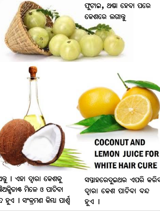
COCONUT AND LEMON JUICE FOR WHITE HAIR CURE

କେଶର ରଙ୍ଗ କଳା ବା ସ୍ୱାଭାବିକ ରଖିଥିବା ମେଲାନିନ ନାମକ ଏକ ଉପାଦାନ କମିଗଲେ, କେଶ ପାଚେ । ସାଧାରଣତଃ କୋଡ଼ିଏ ବର୍ଷ ପରେ ମେଲାନିନ କମିବା ଆରମ୍ଭ ହୁଏ । ଏଥିପ୍ରତି ସାବଧାନତା ଜରୁରୀ । ଏହି ବୟସରେ କେଶ ପାଚିଲେ ରାସାୟନିକ କେଶ ରଙ୍ଗ ବ୍ୟବହାର କରନ୍ତୁ ନାହିଁ । ଏହା ଦ୍ୱାରା କଳା କେଶ ଖୁବ୍ ଶୀଘ୍ର ପ୍ରଭାବିତ ହୁଏ । କମ ଦିନ ମଧ୍ୟରେ ସବୁ କେଶ ପାଚିଯାଏ । ପାର୍ଶ୍ୱ ପ୍ରତିକ୍ରିୟା ଘଟି କେଶ ମୂଳରେ ଘାଁ ହୋଇପାରେ । ତିନି ଚାମଚ ଲେୟୁ ରସରେ ନଡ଼ିଆ ତେଲ ଫେଣ୍ଟି କେଶରେ ଲଗାନ୍ତୁ ଓ ମଥାରେ ଘଷନ୍ତୁ । ଘଷାଏ ପରେ ଅର୍ଥଳା, ରିଠା ରସସୂତ ସାମ୍ପରେ