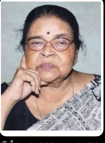
ଆବିର୍ଭାବ : ନଭେମ୍ବର ୧୧, ୧୯୩୬ ତିରୋଧାନ : ଅପ୍ରେଲ ୨୪, ୨୦୨୨