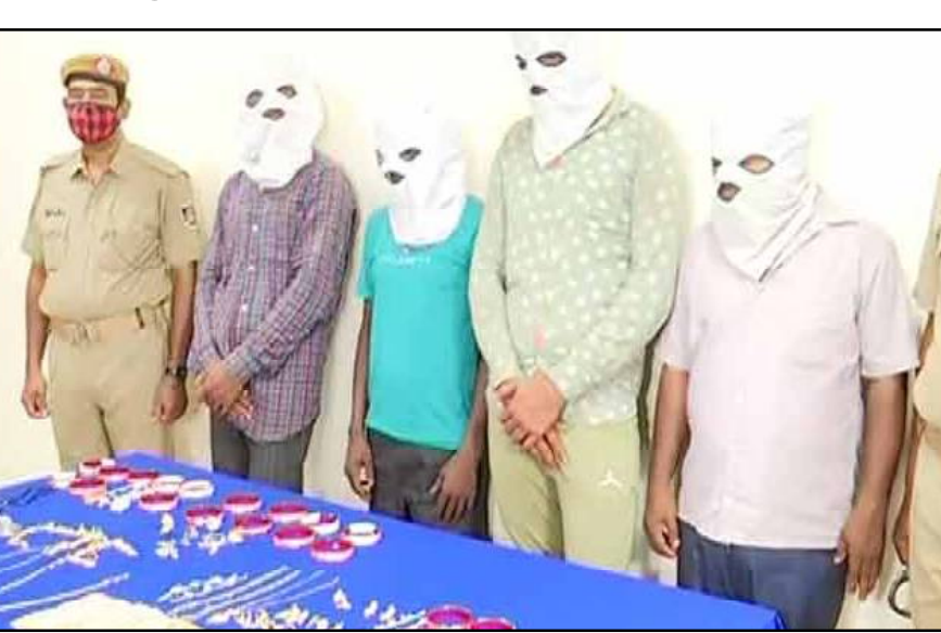
କରିଥିବା ବେଳେ ପ୍ରଥମେ ସାଇଡ଼ିଫିଙ୍ଗ୍ ଟିମ୍, ବେକନିକାଲ ଟିମ୍, ତମ ଷ୍ଟାର୍ଟ୍ ସହ ଦ୍ୱାରା ଯାଞ୍ଚ କରାଯାଇଥିଲା । ଲୁଚେରାମାନେ ପ୍ରଥମେ ସୁନାମୟ ଅଞ୍ଚଳ ବୁଲି ଦେଖୁଥିଲେ । ଏହାପରେ ରାତିରେ ବୋଲେରୋରେ ଆସି ଯେଉଁ