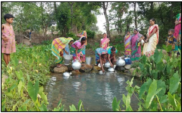
ଲୋକେ ନାହିଁନଥିବା ଅସୁବିଧାରେ ପଡୁଥିଲେ ମଧ୍ୟ କେହି ତାଙ୍କର ଗୁହାରି ବର୍ଷପାତ କରୁନାହାଁନ୍ତି ।

ଭଦକା, ୨/୦୫ (ବି.ପ୍ର): କସ୍ତିପଦା ପଞ୍ଚାୟତ ସମିତି ଅନ୍ତର୍ଗତ କୋଳିଆନାମ ଗ୍ରାମପଞ୍ଚାୟତ ଅଧିନରେ ଥିବା ଚିଆଖାଇ ଗ୍ରାମର ଲୋକେ ନୀଳ ପାଣି ଉପରେ ନିର୍ଭର କରୁଛନ୍ତି । ଉକ୍ତ ଗ୍ରାମରେ ୨୦ଟି ଆଦିବାସୀ ପରିବାର ବିର୍ଭବର୍ଷ ଧରି ବସବାସ କରିଆସୁଛନ୍ତି । ପିଇବା ପାଣି ପାଇଁ ସରକାର ଗ୍ରାମରେ ୨ଟି ନଳକୂପ ବସାଇଥିଲେ । କିନ୍ତୁ ବିର୍ଭବିନ ହେବ ୨ଟି ଯାକ ନଳକୂପ ଅଚଳ ଅବସ୍ଥାରେ ପଡ଼ି ରହିଛି । ପାଣି ପାଇଁ ଚିଆଖାଇ ଗ୍ରାମର