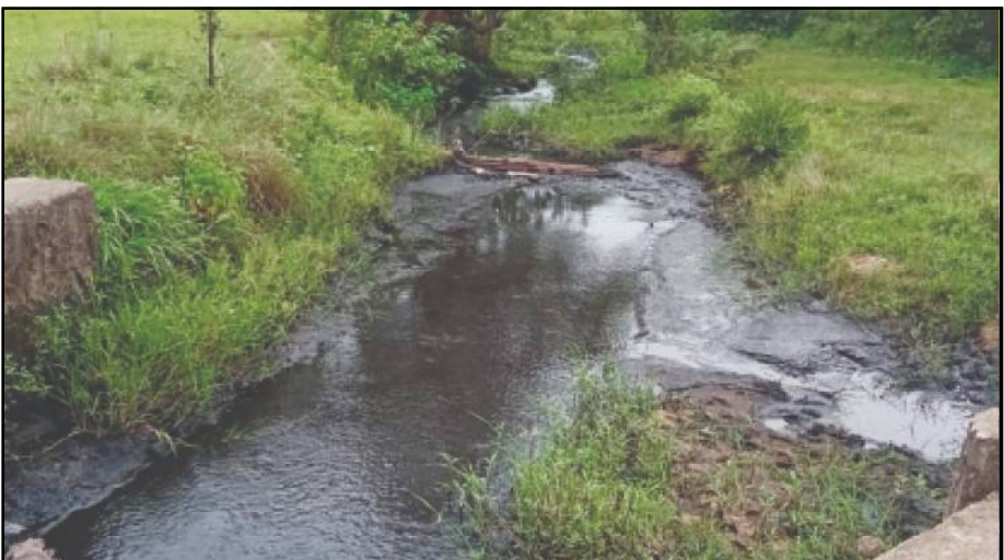
ଭରିଥିବା କୋଇଲା ଗୁଣ୍ଡ ଠିକ୍ ଭାବେ ଉଠାଯାଇଛି କି ନାହିଁ, ମଇଳା ପାଣି ସଫା ହେଉଛି କି ନାହିଁ, ତା'ର ତଦାରଖ ପାଇଁ କେହି ନାହିଁ । ଏମ୍‌ସିଏଲ୍ ଅର୍ଥ ଯୋଗାଇଦେଇ ହାତ ଝାଡ଼ିଦେଇଛି । ୧୩ ଲକ୍ଷ ଟଙ୍କାରେ ଏମ୍‌ସିଏଲ୍ ସାଇଟ୍‌ନିକଟ ରେଲୱେସ୍‌ଟୋଲାରୁ ଶିବମୟର ପର୍ଯ୍ୟନ୍ତ ୨ କିଲୋମିଟର ଅଂଶରୁ ୨ ହଜାର କ୍ୟୁବିକ୍ ମିଟର କୋଇଲାଗୁଣ୍ଡ ଉଠାଇବାକୁ ଦୈନିକ

ସୁନ୍ଦରଗଡ଼, ୨/୦୫ (ବି.ପ୍ର): ହେମଗିରି ରୁକ୍ କନିକା ଗ୍ରାମର ଖଳିଆବାହାଲ ଓ ଝୁପୁଡ଼ିପଡ଼ା ପାଇଁ ଏକଦା ବରବାନ ପାଲଟିଥିବା ବିରସ୍ତୋତା କନିକା ନାଳ(ଯୋର) ମହାନଦୀ ଖୋଲାମୁହଁ କୋଇଲା ଖଣି (ଏମ୍‌ସିଏଲ୍) ଯୋଗୁ ଅଭିଶାପ ପାଲଟିଛି । ଏମ୍‌ସିଏଲ୍ କୋଇଲା ସାଇଟ୍‌ର ସବୁକୋଇଲା ଗୁଣ୍ଡ ଓ ମଇଳା ପାଣି ସିଧା ନାଳରେ ଛାଡ଼ିବା ଦ୍ୱାରା କନିକା ନାଳରେ ଭରିଯାଇଛି କଳା ଜହର । ଲୋକେ ଏଥିରେ ସ୍ନାନ କରିବା ତ ଦୂରର କଥା, ଶ୍ୱେତ ପାଇଁ ବି ନାକ ବେକିବାକୁ ବାଧ୍ୟ ହେଉଛନ୍ତି । କୋଇଲା କଳାପାଣିର ପ୍ରକ୍ରିୟାକରଣ କରି ନାଳରେ ଛାଡ଼ିବାକୁ ଲୋକେ ବର୍ଷ ବର୍ଷ ଧରି ଦାବି କରିବା ପରେ ତଳିତ ବର୍ଷ ଏମ୍‌ସିଏଲ୍ ନାଳ ସଫେଇ ପାଇଁ ପଦକ୍ଷେପ ନେଇଛି । କିନ୍ତୁ ଏମ୍‌ସିଏଲ୍ ଆଖି ଠାରୁ ନାଳ ସଫେଇ ପାଇଁ ଏମ୍‌ସିଏଲ୍ ୧୩ ଲକ୍ଷ ଟଙ୍କା ଯୋଗାଇଦେଇଛି । କିନ୍ତୁ ସଫେଇ କାମ ନାମକୁ ମାତ୍ର । ନାଳରେ