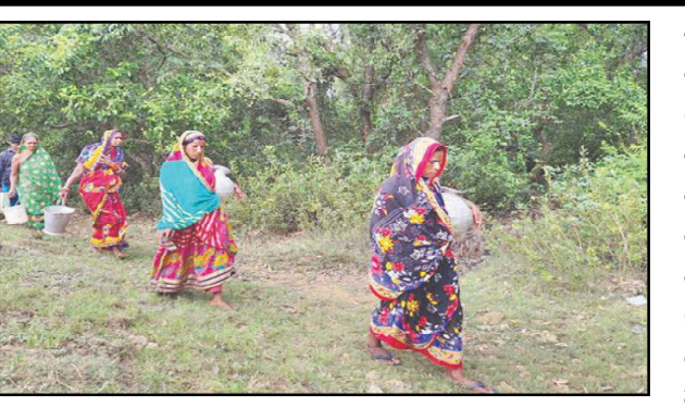
ଶହରୁ ଅଧିକ । ଭୋଗରଳ ଦୃଷ୍ଟିରୁ ଏହି ଗାଁର ପରିସୀମା ୮ କିଲୋମିଟରରୁ ଅଧିକ ହେବ । ଏଠାରେ ବସବାସ କରୁଥିବା ବଙ୍ଗୋ ଫାଟାଗଡ଼ର ଲୋକେ ଛାଡ଼ି ଛାଡ଼ି ଘର କରି ପରିବାର ସହ ରହୁଛନ୍ତି । ଗାଁର ୧ ନଂ ଓଡ଼ିରେ ୬ଟି ଓ ୨ ନମ୍ବର ଓଡ଼ିରେ ୫ଟି ନଳକୂପ ଲୋକଙ୍କ ପାଣି ଆବଶ୍ୟକତା ପୂରଣ କରୁଥିଲା । କିନ୍ତୁ ୧ ନମ୍ବର ଓଡ଼ିରେ ୪ଟି ନଳକୂପ ଭଲ ଥିବା ବେଳେ ୨ଟି ନଳକୂପ ଗା ବର୍ଷ

ରାଜନଗର, ୨/୦୫ (ବି.ପ୍ର): ବୃହତ୍ ଖରାରେ ଅତେଜ କିଲୋମିଟର ଚାଲି ଚାଲି ଗଲେ ମିଳୁଛି ପିଇବା ପାଣି । ଖରାବ ପ୍ରକୋପ ଦୃଷ୍ଟିରୁ ଗାଁର ମହିଳା ଓ ପିଲାମାନେ ବାଟ କମ୍ କରିବା ପାଇଁ ବାଧ୍ୟ ହୋଇ ଭିତରକନିକା ଜଙ୍ଗଲ ଭିତରେ ପଶି ପାଣି ପାଇଁ ଯାଉଛନ୍ତି । ଜଙ୍ଗଲରେ ହିଂସ୍ର ବାରହା ଓ ବିଷଧର ସାପ ରହିଥିଲେ ବି ପାଣି ଟୋପାଏ ପାଇଁ ଜୀବନକୁ ବାଜି ଲଗାଇବାକୁ ବାଧ୍ୟ ହେଉଛନ୍ତି ପାଖାପାଖି ଶହେ ପରିବାର । କେନ୍ଦ୍ରାପଡ଼ା ଜିଲ୍ଲା ରାଜନଗର ବ୍ଲକ୍ ଅନ୍ତର୍ଗତ ବଙ୍ଗୋ ଫାଟାଗଡ଼ର ଭେଙ୍କା ଗାଁରେ ଏଭଳି ଜଳ ଯନ୍ତ୍ରଣା ଉଦ୍‌ବେଗର କାରଣ ହୋଇଛି । ଏହି ଗାଁରେ ୪୫୦ ପରିବାରର ପ୍ରାୟ ୨୬୫୫ ଲୋକ ବସବାସ କରୁଛନ୍ତି । ଦୁଇଟି ଓଡ଼ିରେ ଭୋଗରଳ ସଂଖ୍ୟା ୧୧