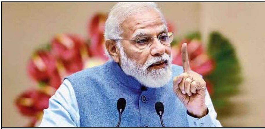
ରୁଷ-ୟୁକ୍ତେନ ଯୁଦ୍ଧକୁ ନେଇ ପ୍ରଧାନମନ୍ତ୍ରୀଙ୍କ ବଡ଼ ବୟାନ

ନୂଆଦିଲ୍ଲୀ, ୦୬/୦୪ : ମାସେରୁ ଅଧିକ ସମୟ ହେଲା ରୁଷ ଓ ଯୁକ୍ତେନ ମଧ୍ୟରେ ଯୋଗାଯୋଗ ଯୁକ୍ତ ଚାଲିଥିବା ବେଳେ ଭାରତର ପ୍ରଧାନମନ୍ତ୍ରୀ ନରେନ୍ଦ୍ର ମୋଦି ଆଜି ବଡ଼ ବୟାନ ଦେଇଛନ୍ତି । ସେ କହିଛନ୍ତି, ଏବେ ପୂରା ବିଶ୍ୱ ଦୂରତ ଗୁପ୍ତରେ ବିଭକ୍ତ ହୋଇଯାଇଛି । ହେଲେ ଭାରତ ତା' ନିରପେକ୍ଷ ନୀତିରେ କାମ କରି ଚାଲିଛି । ନିରପେକ୍ଷ ନୀତି ଯୋଗୁ ଭାରତ ତା' କାତୀୟ ସ୍ୱାର୍ଥକୁ ଗୁରୁତ୍ୱ ଦେଇଛି ଓ ବିଶ୍ୱର କୌଶର୍ଯ୍ୟ ଚାପ ଆଗରେ ମୁଣ୍ଡ ନୁଆଁଇ ନାହିଁ ବୋଲି ମୋଦି କହିଛନ୍ତି । ରୁଷ ଓ ଯୁକ୍ତେନ ଯୁଦ୍ଧ ଆଡ଼କୁ ଉଦ୍ଧାରା କରି ମୋଦି କହିଛନ୍ତି, “ଯେତେବେଳେ ଗୋଟିଏ ସମୟରେ ପୂରା ବିଶ୍ୱ ଦୂର ଭାଗରେ ବିଭକ୍ତ ହୋଇ ଯାଏ ତେବେ ସେତେବେଳେ ମାନବିକତା ପାଇଁ ନିରପେକ୍ଷ ନୀତି ଅବଲମ୍ବନ କରି