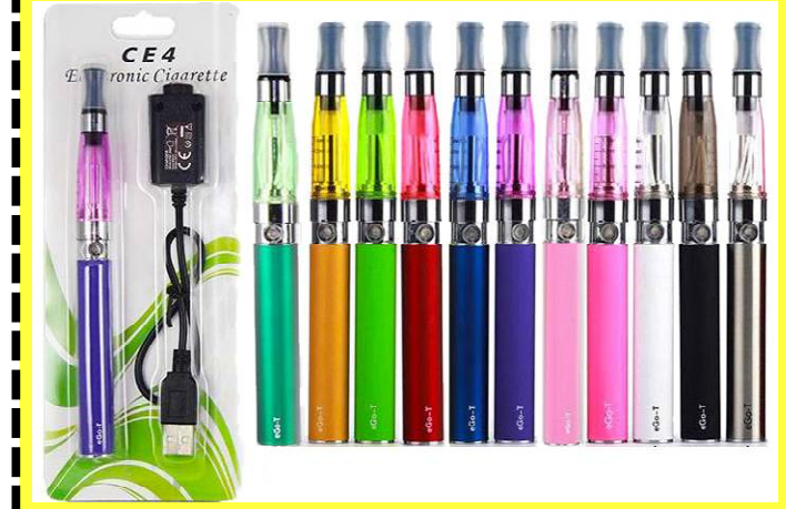
ବ୍ୟକ୍ତିର ଓଠ କଳା ପଡ଼ିଯାଇଥାଏ । ଅପରପକ୍ଷରେ ଇ-ସିଗାରେଟ୍ରେ ତମାଖୁଟିହାନ ହୋଇଥିବାବେଳେ ଏଥିରେ ଥିବା ଭାସୋରାଇଜର୍ ଗୋଟିଏ ବ୍ୟାଦେରି

ନିକାରାମ୍ବୁକ ପ୍ରଭାବ ପକାଏ, ମସ୍ତିଷ୍କକୁ କ୍ଷତି ପହଞ୍ଚାଏ: ନିୟମିତ ଇଲେକ୍ଟ୍ରୋନିକ୍ ସିଗାରେଟ୍ ବ୍ୟବହାର କରିବା ଦ୍ୱାରା ବିଭିନ୍ନ ପ୍ରକାରର ହୃଦ୍‌ରୋଗ ହେବା ସହିତ ନିଶ୍ୱାସ ପ୍ରଣାଳୀ ନେବାରେ ବିଭିନ୍ନ ବାଧା ଦେଖାଯାଏ । ସେହିପରି ଯୁବପିଢିଙ୍କର ମସ୍ତିଷ୍କକୁ ଏହା କ୍ଷତି ପହଞ୍ଚାଇବା ସହିତ ନିକାରାମ୍ବୁକ ରୋଗ ସୃଷ୍ଟି ହେଉଥିବା ଜଣାପଡ଼ିଛି । ଇ-ସିଗାରେଟ୍ ଭୟାନକ ହେବା ଓ ନିକୋଟିନ୍ ବ୍ୟବହାର ଦ୍ୱାରା ବିଭିନ୍ନ ମାତ୍ରାରେ ରୋଗରେ ଯୁବପିଢି ଆକ୍ରାନ୍ତ ହେଉଥିବାକୁ ଦି ପ୍ରୋହିବିସନ୍ ଅଫ୍ ଇଲେକ୍ଟ୍ରୋନିକ୍ ସିଗାରେଟ୍ ଅକ୍ଟୋବର, ୨୦୧୯ ଅନୁଯାୟୀ