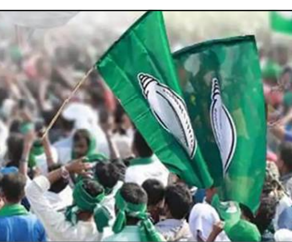
ଗୋଟିଏ ଆସନରେ ଆଗୁଆ ରହିଛି । ବିଜେଡି ଲିଲ୍ଲାର ଗାଡ଼ି ଆସନ ସମ୍ପର୍କରେ ତଥ୍ୟ ମିଳିଛି । ଏହି ମଧ୍ୟରୁ ୨ଟି ଆସନରେ ବିଜେଡି ଆଗୁଆ ଥିବା ବେଳେ ଗୋଟିଏ ଆସନରେ ବିଜେପି ଆଗୁଆ ରହିଛି । ବଳାଙ୍ଗୀର ଜିଲ୍ଲାର ମୋଟ ୧୪ ଟି ଆସନ ସମ୍ପର୍କରେ ତଥ୍ୟ ମିଳିଛି । ଏଥି ମଧ୍ୟରୁ ୯ଟି ଆସନରେ ବିଜେଡି ଆଗୁଆ ଥିବା ବେଳେ ୪ ଆସନରେ ବିଜେପି ଆଗୁଆ ରହିଛି । କଂଗ୍ରେସ ଗୋଟିଏ ସିଟରେ ଆଗୁଆ ରହିଛି । ବରଗଡ଼ ଜିଲ୍ଲାର ୧୧ ଟି ଆସନ ସମ୍ପର୍କରେ

ଭୁବନେଶ୍ୱର, ୨୭/୦୨ (ନି.ପ୍ର): ରାଜ୍ୟରେ ସମ୍ପନ୍ନ ହୋଇଥିବା ତ୍ରିଭଙ୍ଗରାୟ ଫଂଡ଼ାୟତ ନିର୍ବାଚନର ମତଗଣନା ରବିବାର ଦିନ ଦ୍ୱିତୀୟ ଦିନ ମଧ୍ୟ ଜାରି ରହିଛି । ଦ୍ୱିତୀୟ ଦିନ ଖବର ଲେଖା ଯିବା ବେଳକୁ ୨୦୫ ଟି ଆସନରେ ଟ୍ରେଡ଼ ଜଣା ପଡ଼ିଥିଲା ବେଳେ ବିଜେଡି ପ୍ରାର୍ଥୀମାନେ ମୋଟ ୨୬୭ ଟି ଆସନରେ ଆଗୁଆ ରହିଛନ୍ତି । ସେହିପରି ବିଜେପି ୧୯୯ ଟି ତଥା କଂଗ୍ରେସ ୧୬୮ ଟି ଆସନରେ ଆଗୁଆ ରହିଛି । ଅନ୍ୟାନ୍ୟ ଗାଡ଼ି ଆସନରେ ଆଗୁଆ ଥିବା ଜଣା ପଡ଼ିଛି । ରାଜ୍ୟ ନିର୍ବାଚନ କମିଶନର ଠାରୁ ମିଳିଥିବା ସୂଚନା ଅନୁସାରେ ଅନୁଗୁଳ ଜିଲ୍ଲାରେ ଆଜି ମଧ୍ୟରୁ ୮ଟି ଆସନ ସମ୍ପର୍କରେ ତଥ୍ୟ ମିଳିଛି । ୭ଟି ଆସନରେ ବିଜେଡି ଆଗୁଆ ରହିଥିବା ବେଳେ ବିଜେପି