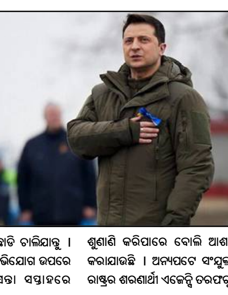
ସେନା ଯୁକ୍ରେନ ଛାଡ଼ି ଚାଲିଯାଇଛି । ଯୁକ୍ରେନର ଏହି ଅଭିଯୋଗ ଉପରେ ଆଇସିଜେସ ଆଦେଶ ପ୍ରଦାନ କରିବାକୁ ଯୁକ୍ରେନ ଦାବି କରିଛି ।

ରୂଆଦିଲ୍ଲା, ୨୭/୦୨ : ଯୁକ୍ରେନ ଓ ରକ୍ଷ ମଧ୍ୟରେ ଚାଲିଥିବା ଯୁଦ୍ଧ ଜଗତରେ ଶହ ଶହ ନିରୀହ ଜନତାଙ୍କୁ ହତ୍ୟା କରାଯାଉଛି । ଏବେ ଅର୍ଦ୍ଧଶତାବ୍ଦୀ କୋର୍ଟରେ ଅଭିଯୋଗ ଦାଖଲ କରିଛି ଯୁକ୍ରେନ । ଯୁକ୍ରେନ ଅଭିଯୋଗ କରିଛି କି ରକ୍ଷ ନାମରେ ଯୁକ୍ରେନର ସାଧାରଣ ନାଗରିକମାନଙ୍କୁ ହତ୍ୟା କରିବାରେ ଲାଗିଛି । ଏବେ କୋର୍ଟ ତୁରନ୍ତ ଅଭିଯୋଗର ଶୁଣାଣୀ କରି ନ୍ୟାୟ ପ୍ରଦାନ କରିବାକୁ ଯୁକ୍ରେନ ଦାବି କରିଛି । ଏହାସହ ଯୁକ୍ରେନ ଆଇସିଜେସରେ ଦାବି କରିଛି କି କୋର୍ଟ ତରଫରୁ ଆଦେଶ ଦିଆଯାଇ କି ରକ୍ଷ