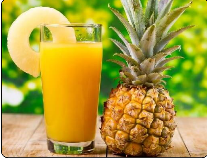
୧. ଏହାର ଆଖି-ଇନ୍ଫ୍ଲେମେଟରୀ ଗୁଣ ଟ୍ରୋକାଣ୍ଡରଟିଏ ରୋଗୀଙ୍କ ପାଇଁ ଲାଭଦାୟକ । ୨. ଦାନ୍ତ ଓ ମାଠି ସୁସ୍ଥ ରଖେ । ୩. ଚୂଡ଼ା ଉପରେ ବସସର ପ୍ରଭାବ ହ୍ରାସକରେ । ୪. ସପୁରି ରସ କୋଲେଷ୍ଟରଲ ସ୍ତର ନିୟନ୍ତ୍ରଣ କରିବାରେ ସହାୟକ ହୁଏ ।