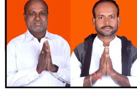
ଆଶୀର୍ବାଦ ତଥା ଭୋଟର କ ଭଲ ପାଇବା ଓ ଭାରତ ସରକାରଙ୍କୁ ଜନ କଲ୍ୟାଣ ଯୋଜନା ଆମକୁ ନିଶ୍ଚିତ ବିଜୟ ପଥ ରେ ସାହାଯ୍ୟ କରିବ ବୋଲି ପ୍ରାର୍ଥନା କରୁଥିବା ପ୍ରଶାସନୀୟ ଅଧିକାରୀଙ୍କ ସହିତ ଉପସ୍ଥାପିତ ହୋଇଛନ୍ତି ।

ପୁରୀ, ୧୧/୨ (ନି.ପ୍ର): ପୁରୀ ଜିଲ୍ଲାରେ ବାଲିପଡ଼ା ପଟାଘାଟରେ ନିର୍ବାଚନ ମାହୋଲ୍ ଜମୁଛି ।