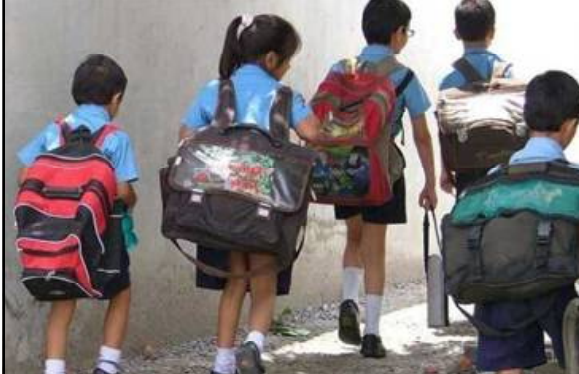
ଶ୍ରେଣୀ ପର୍ଯ୍ୟନ୍ତ ସ୍କୁଲ ଖୋଲିବ ବୋଲି କେଜିରୁ ପଠାଯାଉଛି । ଏବେ ଅନେକ ଅଭିଭାବକ ଦୂରରେ ଅଛନ୍ତି । ତେବେ ସ୍ୱାସ୍ଥ୍ୟ ବିଶେଷଜ୍ଞଙ୍କ ମତ ହେଉଛି, ସଂକ୍ରମଣ ।

ଭୁବନେଶ୍ୱର, ୦୮/୦୨ (ନି.ପ୍ର): ୧୪ରୁ କେଜିରୁ ସସ୍ତ୍ରମ ଶ୍ରେଣୀ ପର୍ଯ୍ୟନ୍ତ ସ୍କୁଲ ଖୋଲିବାକୁ ସରକାର ନିଷ୍ପତ୍ତି ନେଇଛନ୍ତି । ହେଲେ ପିଲାଙ୍କୁ ବିଦ୍ୟାଳୟକୁ ଛାଡ଼ିଦେବାକୁ ନାହିଁ, ଏହାକୁ ନେଇ ଦୂରରେ ଅଛନ୍ତି ଅଭିଭାବକ । ଏମିତି ସମୟରେ ପିଲାଙ୍କୁ ସରକାରୀ ସହ ସ୍କୁଲ ଛାଡ଼ିବାକୁ ପରାମର୍ଶ ଦେଇଛନ୍ତି ତାଙ୍କର । ଗତକାଳି ମୁଖ୍ୟମନ୍ତ୍ରୀ ମଧ୍ୟ ପିଲାଙ୍କୁ ସ୍କୁଲ ଛାଡ଼ିବାକୁ ଅଭିଭାବକଙ୍କୁ ପରାମର୍ଶ ଦେଇଥିଲେ । ସଂକ୍ରମଣ କରିବା ପରେ ଅସମ୍ଭବ ଦଶମ ଶ୍ରେଣୀ ଅଫଲାଇନ ପାଠପଢ଼ା ଆରମ୍ଭ ହୋଇଛି । ୧୪ରୁ କେଜିରୁ ସସ୍ତ୍ରମ