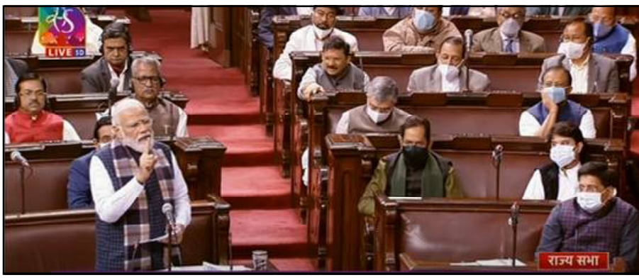
ପରିବାରବାଦୀଙ୍କୁ ମୁକ୍ତ ହୋଇଥାନ୍ତା, କଂଗ୍ରେସ ନଥିଲେ ଭାରତ ବିଦେଶୀଙ୍କ ଦ୍ୱାରା ଦେଖାଯାଇଥିବା ବାଟରେ ନୁହେଁ ବରଂ ସୁଦେଶୀ ସଂକଳ ନେଇ ଆଗକୁ ବଢ଼ିଥାନ୍ତା । ଯଦି କଂଗ୍ରେସ ନଥାନ୍ତା ତେବେ ଦେଶ ବିଦେଶୀଙ୍କ ଦ୍ୱାରା ଦେଖାଯାଇଥିବା ବାଟରେ ନୁହେଁ ବରଂ ସୁଦେଶୀ ସଂକଳ ନେଇ ଆଗକୁ ବଢ଼ିଥାନ୍ତା ।

ନୂଆଦିଲ୍ଲୀ, ୦୮/୦୨ : ପ୍ରଧାନମନ୍ତ୍ରୀ ନରେନ୍ଦ୍ର ମୋଦୀ ଆଜି ରାଜ୍ୟସଭାରେ ରାଷ୍ଟ୍ରପତିଙ୍କ ଅଭିଭାଷଣକୁ ନେଇ ଆସିଥିବା ଧନ୍ୟବାଦ ପ୍ରସ୍ତାବ ଉପରେ ଉତ୍ତର ରଖିଛନ୍ତି । ଏହି ସମୟରେ କରୋନା ଭଳି ସଙ୍କଟକଳ ସ୍ଥିତିରେ କିଭଳି ବିଭିନ୍ନ କ୍ଷେତ୍ରରେ ସରକାର କାର୍ଯ୍ୟ କରିଛନ୍ତି ତାହା କହିଛନ୍ତି । ଏହାସହ ରୋକଗାର ଠାରୁ ଆରମ୍ଭ କରି ମହଙ୍ଗା ଉପରେ ନିଜର ସମାନ ରଖିଛନ୍ତି । ଏତିକି ନୂହେଁ କଂଗ୍ରେସ ଉପରେ ବର୍ଷିକ ପ୍ରଧାନମନ୍ତ୍ରୀ ମୋଦୀ । ସଂସଦରେ ମୋଦୀ କହିଛନ୍ତି ଯଦି ଦେଶରେ କଂଗ୍ରେସ ନଥାନ୍ତା ତେବେ କଣ ହୋଇଥାନ୍ତା । ମୋଦୀ କହିଛନ୍ତି କଂଗ୍ରେସ ନଥିଲେ ଲୋକତତ୍ତ୍ୱ