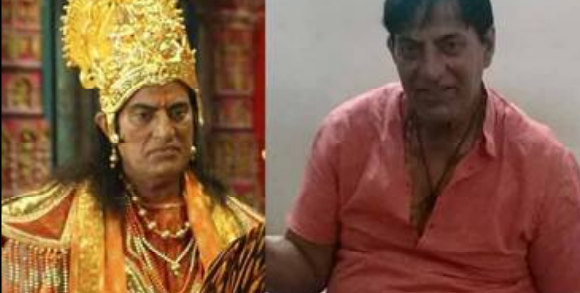
ରହିଥିଲେ । ମହାଭାରତରେ ଭୀମ ଭୂମିକାରେ ଅବତୀର୍ଣ୍ଣ ହୋଇଥିବା ପ୍ରବୀଣ କୁମାର ସୋବିତଙ୍କର ପରଲୋକ ହୋଇଛି । ଏହା ସହ ଆର୍ଥିକ ଦୂରାବସ୍ଥା ମାନସିକ ଦୁଃଖରେ

ନୂଆଦିଲ୍ଲୀ, ୦୮/୦୨ : ବି. ଆର ଟୋପ୍ରାଙ୍କ ଲୋକପ୍ରିୟ ପୌରାଣିକ ଶୋ 'ମହାଭାରତ'ରେ ଭୀମ ଭୂମିକାରେ ଅବତୀର୍ଣ୍ଣ ହୋଇଥିବା ପ୍ରବୀଣ କୁମାର ସୋବିତଙ୍କର ପରଲୋକ ହୋଇଛି । ୭୪ ବର୍ଷ ବୟସରେ ପ୍ରବୀଣ ଶେଷ ନିଃଶ୍ୱାସ ତ୍ୟାଗ କରିଛନ୍ତି । ସୂତନା ମୁତାବକ, ସେ ଦୀର୍ଘ ଦିନ ଧରି ଅସ୍ତ୍ରୁ ରହିଥିଲେ । ଏହାସହ ଆର୍ଥିକ ଦୂରାବସ୍ଥା ମାନସିକ ଦୁଃଖରେ