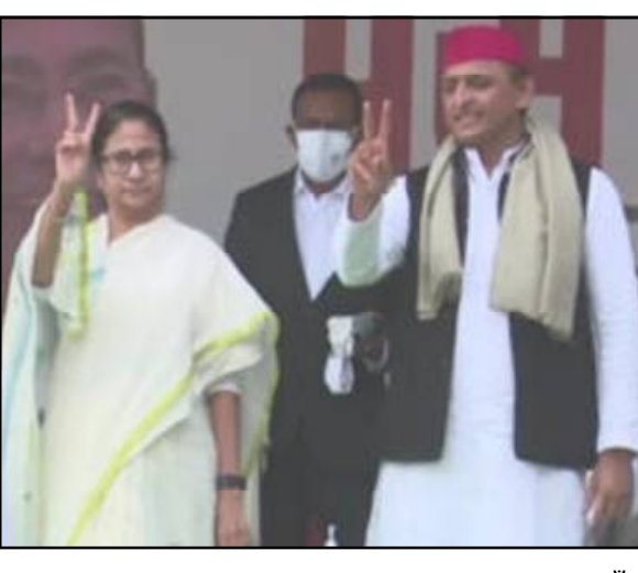
ଅଧିକେଶଙ୍କ ସହ ପ୍ରଚାର କରିଛନ୍ତି ମମତା । କହିଛନ୍ତି ବିଜେପି ଶ୍ରେଣୀତାଳ ଆସିବେ ପୁଣି ଦୁଲେଇ ବକେଇ କୁଷି ଆଇନ ଆଣିବ ।

ନୂଆଦିଲ୍ଲୀ, ୦୮/୦୨ : ଯୁପିରେ ଏକାଠି ହେଲେ ମୋଦୀ ବିରୋଧୀ । ଉତ୍ତରପ୍ରଦେଶ ନିର୍ବାଚନ ଯେତିକି ପାଖିକି ଆସୁଛି ସେତିକି ନିକଟତର ହେଉଛନ୍ତି ବିଜେପି ବିରୋଧୀ । ଉତ୍ତର ପ୍ରଦେଶରେ ଯୋଗୀ ସରକାରଙ୍କୁ ଶ୍ରେଣୀତାଳ କରିବା ପାଇଁ ଏକ ପ୍ରକାର ଲଢ଼େଇ ଆରମ୍ଭ କରିଛନ୍ତି ସମାଜବାଦୀ ପାର୍ଟି ମୁଖ୍ୟ ଅଧିକେଶ ଯାଦବ । ଆଉ ଏବେ ତାଙ୍କୁ ମିଳିଯାଇଛି ପର୍ଯ୍ୟବସ୍ଥା ମୁଖ୍ୟମନ୍ତ୍ରୀ ମମତା ବାନାର୍ଜୀଙ୍କ ସମର୍ଥନ । କେନ୍ଦ୍ରରେ ମୋଦୀ ସରକାର ବିରୋଧୀ ଜନମତକୁ ଯୁପିରେ ପ୍ରଭାବିତ କରି ଅଧିକେଶଙ୍କ ସହଯୋଗ ଆଣିବାକୁ ପ୍ରୟାସ ଆରମ୍ଭ କରିଛନ୍ତି ମମତା । ଆଜି ଲକ୍ଷ୍ନୋ ସମାଜବାଦୀ ପାର୍ଟି ପାଇଁ