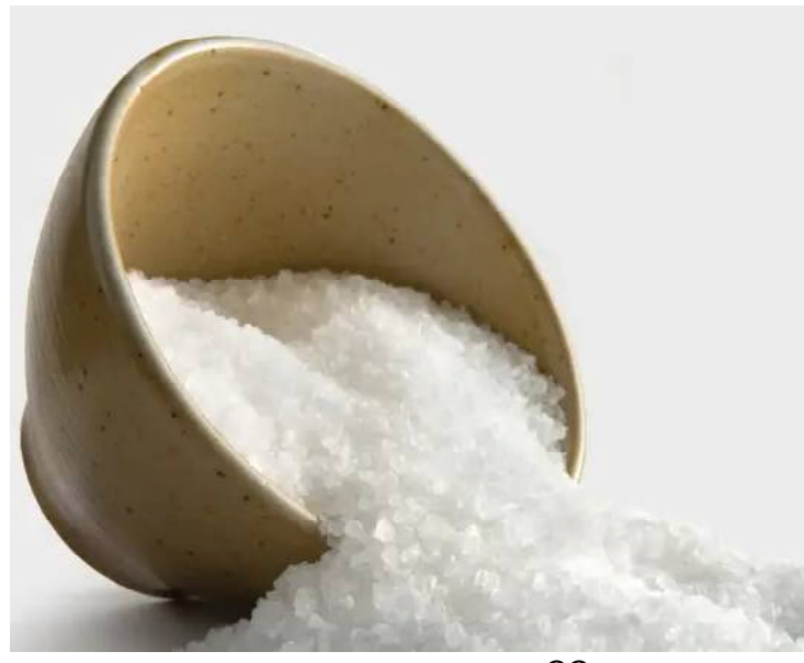
ଆମ ଭାରତୀୟ ବ୍ୟକ୍ତିମାନଙ୍କେ ଲୁଣର ବ୍ୟବହାର ହେବା ନିଶ୍ଚିତ, ଏହା ଖାଦ୍ୟକୁ ଏକ ପୂର୍ଣ୍ଣାଙ୍ଗ ରୂପ ଦେଇଥାଏ ବୋଲି ଖାଦ୍ୟ ବିଶେଷଜ୍ଞଙ୍କ ମତ । ଦୈନନ୍ଦିନ ତରକାରିରେ ସାଧା ଲୁଣ,

କରିବା ଉଚିତ । ଆବଶ୍ୟକ ପରିମାଣରେ ଏହି ଲୁଣ ନ ଖାଇଲେ ଆଇର-ଏଡ୍ ପରି ରୋଗ ହେବାର ଆଶଙ୍କା ସର୍ବାଧିକ । ଅନ୍ୟପାଖେ ଏହି ଲୁଣକୁ ଅଧିକ ଖାଇବା ମଧ୍ୟ ସ୍ୱାସ୍ଥ୍ୟ ପାଇଁ କ୍ଷତିକାରକ ।