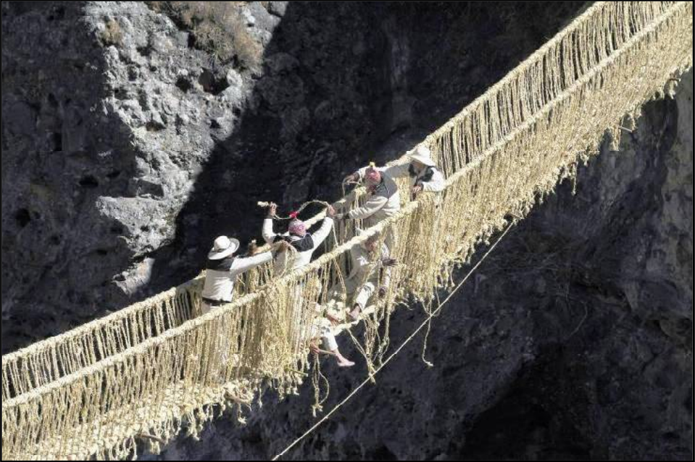
ପେରୁ ରୋପ୍ ବ୍ରିଜ୍:

ଚୀନର ଝାଙ୍ଗିକିୟାକି ପ୍ରାନ୍ତରେ ପ୍ରସ୍ତୁତ ଏହି ପୋଲଟି ସମ୍ପୂର୍ଣ୍ଣ ରୂପେ କାଚରେ ନିର୍ମାଣ କରାଯାଇଛି । ଝାଙ୍ଗିକିୟାକିକୁ ଦୁନିଆର ସବୁଠାରୁ ଭୟାବହ ପୋଲମାନଙ୍କ ଭିତରେ ଗଣାଯାଏ । ୧୦୦ ମିଟର ଲମ୍ବା ଏହି ପୋଲର ଆଖପାଖରେ କେବଳ ଭୟଙ୍କର ପାହାଡ଼ମାନ ରହିଛି । ଭୂପୃଷ୍ଠର ୩୦୦ ଫୁଟ ଉପରେ ଏହି ପୋଲକୁ ପ୍ରସ୍ତୁତ କରାଯାଇଛି । ପୋଲରେ ଛିଡ଼ା ହୋଇ ତଳକୁ ଦେଖିଲେ ତଳେ ଖାଲି ଗଭୀର ଖାଲମାନ ଦେଖାଯାଏ । ଦୂରକ ହୃଦୟ ବ୍ୟକ୍ତି ଏହି ପୋଲ ଉପରେ ଦେଇ ଯାତ୍ରା କଲେ ଭୟରେ ସେମାନଙ୍କ ଜୀବନ ଚାଲିଯିବାର ସମ୍ଭାବନା ରହିଛି ।