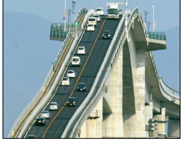
ଏସିମା ଓହାସି ବ୍ରିଜ୍:

ପ୍ରତିଦିନ ଦୁନିଆରେ ଏପରି ଅନେକ ଅଜବ ଗଜବ ଘଟଣା ଘଟେ ଯାହା ସାଧାରଣ ଲୋକଙ୍କୁ ଚକିତ କରି ରଖିଦିଏ । ପାଠକମାନଙ୍କୁ ବିଶ୍ୱର କିଛି ଅଜବ ଏବଂ ଭୟାବହ ପୋଲମାନଙ୍କ ବିଷୟରେ ଜଣାଉଛି । ଯେ କେହି ବି ଏହି ପୋଲଦେଇ ଯିବା ପୂର୍ବରୁ ଶହେଥର ଭାବିବେ । ଏହି ପୋଲଗୁଡ଼ିକୁ ଦେଖିଲେ ଏପରି ଲାଗେ, ଯେପରି ଏହା କେବଳ ଲୋକଙ୍କୁ ଡରାଇବା ପାଇଁ ହିଁ ତିଆରି କରାଯାଇଛି ।