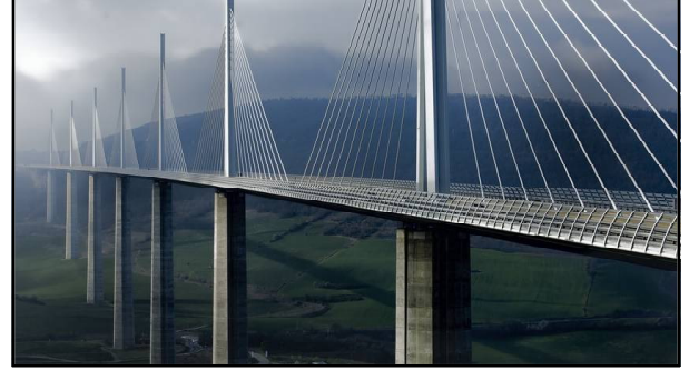
ମିଲ୍ଲାର ଭାୟାଡ଼କୁ ବ୍ରିଜ୍:

ଏହା ଜାପାନର ସବୁଠାରୁ ଭୟାବହ ପୋଲ । ଏସିମା ଓହାସି ନାମକ ଏହି ପୋଲଟି ଜାପାନର ଦୁଇ ମୁଖ୍ୟ ସହର ମ୍ୟାଟସୁଜି ଏବଂ ସାକାମିନୋତୋକୁ ଯୋଡ଼ିଥାଏ । ଏହି ପୋଲଟି ଏତେ ଖତରନାକ ଯେ, ଏହାଉପରେ ଯାତ୍ରା କରୁଥିବା ଲୋକର ଯଦି ଗାଡ଼ିର ବ୍ରେକ୍ ହୋଇ ହୋଇଯାଏ କିମ୍ବା ବ୍ରେକ୍ ଠିକ୍ ଭାବେ ନ ଧରେ ତେବେ ଏଠାରେ ଦୁର୍ଘଟଣା ଘଟିବା ନିଶ୍ଚିତ ।