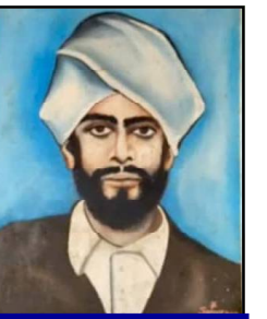
ପଞ୍ଚିତ ଗେୟାଲୀୟ ଦାସି