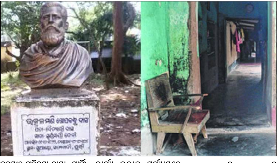
ଜନ୍ମପୀଠ ପରିକ୍ରମା ରାସ୍ତା, ପାର୍ଶ୍ୱ ଆଦିର ବିକାଶ ପାଇଁ କ୍ଷେତ୍ରସ୍ତରୀୟ କାର୍ଯ୍ୟ ଉଚିତ ମଧ୍ୟରେ ଦ୍ୱାରାନ୍ୱିତ ହୋଇଛି। ଏସବୁ ସହ ଗୋପବନ୍ଧୁ ପୂର୍ତ୍ତି ସଂଗ୍ରହାଳୟ, ପୁରୀର କେନ୍ଦ୍ର ଓ ଆଡିଅସ କେନ୍ଦ୍ର ମଧ୍ୟ ନିର୍ମାଣ କରାଯାଇଛି। ଉଚିତ ମଧ୍ୟରେ ଶିବ ମନ୍ଦିରର ମୂଳଦୁଆ ସଂରକ୍ଷଣ ପିଣ୍ଡର ବିକାଶ, ବସ୍ତୁ ନିଉଟି, ମନ୍ଦିର ପରିକ୍ରମା ରାସ୍ତା ଆଦି କାର୍ଯ୍ୟ ବିଶେଷ ଭାବେ ଅଗ୍ରଗତି କରିଛି। ପ୍ରଥମ ପୋଖରୀର ପୁଣିଥରେ ଖନନ, ଉଦ୍ଧାର ଓ ସୌନ୍ଦର୍ଯ୍ୟକରଣ

ଭୁବନେଶ୍ୱର, ୫/୧୧ (ନି.ପ୍ର): ମୁଖ୍ୟମନ୍ତ୍ରୀ ନବୀନ ପଟ୍ଟନାୟକଙ୍କ ନିର୍ଦ୍ଦେଶକ୍ରମେ ଆରମ୍ଭ ହୋଇଥିବା ଉତ୍କଳମଣି ଗୋପବନ୍ଧୁ ଦାସଙ୍କ ଜନ୍ମପୀଠ ବିକାଶ ପ୍ରକଳ୍ପ କାର୍ଯ୍ୟ ଦ୍ୱାରାନ୍ୱିତ ହୋଇଛି। ଗତବର୍ଷ ମାର୍ଚ୍ଚ ଛିତରେ କାର୍ଯ୍ୟ ଶେଷ କରିବା ପାଇଁ ଲକ୍ଷ୍ୟ ଧାର୍ଯ୍ୟ ହୋଇଛି। ଏହି ପ୍ରକଳ୍ପ ପାଇଁ ପ୍ରାୟ ୧୫.୧୬କୋଟି ଟଙ୍କାର ବ୍ୟୟ ଅଟକଳ କରାଯାଇଥିବା ମୁଖ୍ୟ ଶାସନ ସଚିବ ସୁରେଶ ଚନ୍ଦ୍ର ମହାପାତ୍ରଙ୍କ ଅଧ୍ୟକ୍ଷତାରେ ଅନୁଷ୍ଠିତ ଏକ ଉଚ୍ଚସ୍ତରୀୟ ସମୀକ୍ଷା ବୈଠକରୁ ଏହା ଜଣାପଡ଼ିଛି।