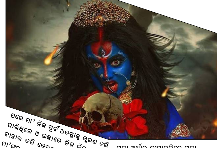
ପରେ ମା' ନିଜ ପୂର୍ବ ଅବସ୍ଥାକୁ ସ୍ମରଣ କରି ପାରିଥିଲେ ଓ ଲଜାରେ ନିଜ ଜିଭ ଆଗକୁ ବାହାର କରି ଦେଇଥିଲେ । ସେହିଦିନଠାରୁ ମା'ଙ୍କର ଏହି ରୂପକୁ କାଳୀ

ପୂଜା ଅର୍ଥାତ୍ ଦୀପାବଳିରେ ପୂଜା କରାଯାଇଥାଏ । ଅନାବାସ୍ୟା ରାତିରେ କାଳୀଙ୍କର ପୂଜା ହେଉଥିବାକୁ ଚାହିଁକିମାନେ ମଧ୍ୟ ଏହି ଦିନ ମା'ଙ୍କର ଉପାସନା କରିଥା'ନ୍ତି । ଦୀପାବଳିରେ ଆଗମନରେ ମହାକାଳୀଙ୍କୁ ପୂଜା କଲେ, ମା' ସୁଖସମୃଦ୍ଧି ପ୍ରଦାନ କରିଥା'ନ୍ତି । ଏହାମଧ୍ୟ କୁହାଯାଏ, ଏହି ଦିନ ମା' କାଳୀ ତାଙ୍କ ଅନୁଗାମୀଙ୍କର ସମସ୍ତ ଦୁଃଖ ଦୁର୍ଦ୍ଦଶା ଦୂର କରିଥା'ନ୍ତି । ଏଥିପାଇଁ ମା'ଙ୍କ ଆଗରେ ଅଖଣ୍ଡ ଦୀପ ମଧ୍ୟ ବସାଯାଏ । ଅନେକ ବିଶ୍ୱାସ କରନ୍ତି, ମା' କାଳୀ ପୃଥିବୀରେ ନ୍ୟାୟ ଓ କାବନର ପୁନର୍ନିର୍ମାଣ କରିଥା'ନ୍ତି, ଯେଉଁଥିରେ ପ୍ରତ୍ୟେକ ମଣିଷକୁ ଶାନ୍ତି ଓ ସଫଳତା ସହ ରହିବା ପାଇଁ ବାର୍ତ୍ତା ଦିଆଯାଏ । ଏହି କାରଣରୁ ପୂର୍ବ ଭାରତର କିଛି ହିନ୍ଦୁ ଧର୍ମାବଲମ୍ବୀ ଦୀପାବଳି ଅପେକ୍ଷା କାଳୀ ପୂଜାକୁ ଅଧିକ ଗୁରୁତ୍ୱ ଦେଇଥା'ନ୍ତି ।