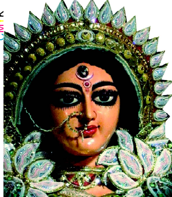
ସ୍ତ୍ରୀ ଦେବୀ ସର୍ବଭୂତେଷୁ.....