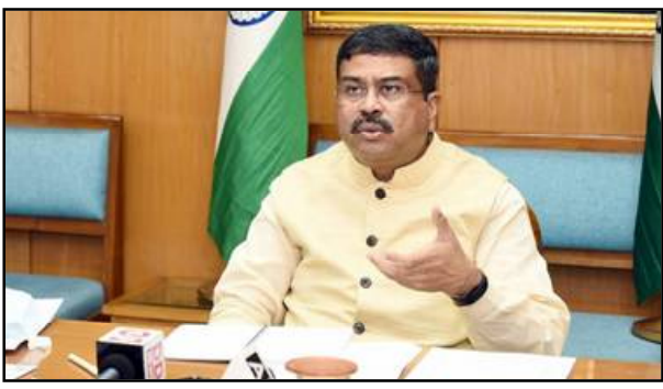
କୋଟି ଟଙ୍କାର ୫ଟି ପ୍ରକଳ୍ପକୁ ମଞ୍ଜୁରୀ ଦେଇଛି। ଏହି ୫ଟି ରାଜ୍ୟ ଗୁଡ଼ିକ ହେଲା ମଧ୍ୟପ୍ରଦେଶ, ଉତ୍ତରପ୍ରଦେଶ, ବିହାର, ଗୁଜରାଟ ଏବଂ ଆନ୍ଧ୍ରପ୍ରଦେଶ। ତେବେ ଓଡ଼ିଶାରେ ସମୃଦ୍ଧ ବୌଦ୍ଧ ପରମ୍ପରା ଓ ପୂଣ୍ୟ ବୌଦ୍ଧ ପୀଠ ଥିବା ସତ୍ତ୍ୱେ ଏହାକୁ ବୁଦ୍ଧ ସର୍କିଟରେ ସାମିଲ କରାଯାଇବା ଏବଂ ଏହି ଯୋଜନା ଅନ୍ତର୍ଗତ ପବିତ୍ର ବୌଦ୍ଧ ପୀଠ ପାଇଁ କୌଣସି ପ୍ରକଳ୍ପ ନିମନ୍ତେ ଅନୁଦାନ ନିମିଳିତା ଚିନ୍ତାଜନକ। ଓଡ଼ିଶାରେ

ନୂଆଦିଲ୍ଲୀ/ଭୁବନେଶ୍ୱର, ୧୭/୧୦ (ନି.ପ୍ର): ସୁଦେଶ ଦର୍ଶନ ଯୋଜନାରେ ଯୋଗ୍ୟ ହୋଇଥିବା 'ବୁଦ୍ଧିଷ୍ଟ ସର୍କିଟ'ରେ ଓଡ଼ିଶା ରାଜ୍ୟକୁ ସାମିଲ କରିବା ପାଇଁ ବ୍ୟକ୍ତିଗତ ହସ୍ତକ୍ଷେପ କରିବାକୁ କେନ୍ଦ୍ର ସଂସ୍କୃତି ଓ ପର୍ଯ୍ୟଟନ ମନ୍ତ୍ରୀ ଜି. କିଷାନ ରେଡ୍ଡୀଙ୍କୁ ପତ୍ର ଲେଖି ଅନୁରୋଧ କରିଛନ୍ତି କେନ୍ଦ୍ର ଶିକ୍ଷା, ଦକ୍ଷତା ବିକାଶ ଏବଂ ଉଦ୍ୟମିତା ମନ୍ତ୍ରୀ ଧର୍ମେନ୍ଦ୍ର ପ୍ରଧାନ। କେନ୍ଦ୍ରମନ୍ତ୍ରୀ ଶ୍ରୀ ପ୍ରଧାନ ପତ୍ରରେ ଉଲ୍ଲେଖ କରିଛନ୍ତି ଯେ ସୁଦେଶ ଦର୍ଶନ ଯୋଜନାରେ ଭାରତ ସରକାରଙ୍କ ପର୍ଯ୍ୟଟନ ମନ୍ତ୍ରାଳୟ ଓ ଓଡ଼ିଶା ସରକାରଙ୍କ 'ବୁଦ୍ଧିଷ୍ଟ ସର୍କିଟ' ବିକାଶ ପାଇଁ ୩୨୫.୫୩