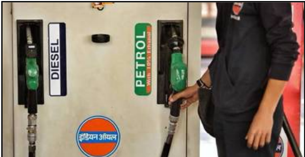
ଦର ୧୧.୧୧ ଟଙ୍କା ୭୭ ପରସା ଓ ଡିଜେଲ ଦର ୧୦.୨୦ ଟଙ୍କା ୫୨ ପରସାରେ ପହଞ୍ଚିଛି। ଭୁବନେଶ୍ୱରରେ ପେଟ୍ରୋଲ ଦର

ଭୁବନେଶ୍ୱର, ୧୭/୧୦ (ନି.ପ୍ର): ଟିଏଲ୍ ଦର ବୃଦ୍ଧିରେ ଲାଗୁନି ଲାଗାମ। ଆଜି ପୁଣି ବଢ଼ିଲା ପେଟ୍ରୋଲ ଓ ଡିଜେଲ ଦର। ପେଟ୍ରୋଲ ଓ ଡିଜେଲ ମାଃ ପରସା ବୃଦ୍ଧି ପାଇଛି। ଦର ବଢ଼ିବା ପରେ ଦିଲ୍ଲୀରେ ପେଟ୍ରୋଲ ଲିଟର ପ୍ରତି ଦର ୧୦.୫୫ ଟଙ୍କା ୮୪ ପରସା ହୋଇଛି। ଡିଜେଲ ଲିଟର ୯.୪୫ ଟଙ୍କା ୫୭ ପରସାକୁ ବୃଦ୍ଧି ପାଇଛି। ସେହିପରି ମୁମ୍ବାଇରେ ପେଟ୍ରୋଲ