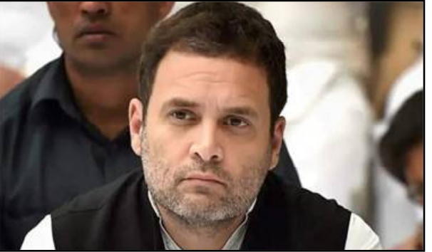
ରହିଛି ତାର ସମାଧାନ କରିବା ଆଗାମୀ ଦିନରେ ବଡ଼ ଚାଲେଖି ହେବ। ଗାନ୍ଧୀ ପରିବାର ହାତରେ ରହିବ କଂଗ୍ରେସ କମାଣ୍ଡ। ଆଉ ବର୍ଷ ପାଇଁ ସୋନିଆ ସଭାପତି ରହିବା ଓ ପୁଣି ସଭାପତି ପଦ ପାଇଁ ରାହୁଲ ବିଚାର କରିବେ ବୋଲି ରାହୁଲ ଗାନ୍ଧି ସମ୍ମତି ଦେବା ପରେ

ନୂଆଦିଲ୍ଲୀ, ୧୭/୧୦: ଗାନ୍ଧୀ ପରିବାର ବିନା ଯେମିତି କଂଗ୍ରେସର କୌଣସି ସ୍ଥିତି ନାହିଁ। ଗାନ୍ଧୀ ପରିବାରକୁ ଛାଡ଼ି କଂଗ୍ରେସର ଚିନ୍ତା କରାଯାଇପାରିବନି। ଗତକାଳିନି ଦିନକୁ ଏକଲି ଏକ ସଂକେତ ମିଳିବା ସହ ପୁଣି ଥରେ ସେହି ଗାନ୍ଧୀ ପରିବାର ହିଁ କଂଗ୍ରେସର କମାଣ୍ଡ ସମାଜିକେ ବୋଲି ସ୍ପଷ୍ଟ ହୋଇଯାଇଛି। ହେଲେ ଗାନ୍ଧୀ ପରିବାରର ନେତୃତ୍ୱ ନେଇ ଦଳ ଭିତରେ ଯେଉଁ ଅସନ୍ତୋଷ ରହିଛି ଓ ବିଭିନ୍ନ ରାଜ୍ୟରେ କନ୍ଦଳ ଲାଗି