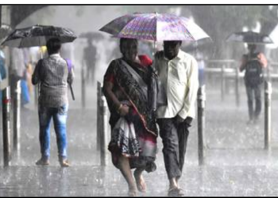
ସେହିପରି ମଧ୍ୟକାଦୀମାନଙ୍କୁ ସମୁଦ୍ର ମଧ୍ୟକୁ ନିର୍ଦ୍ଦାୟ ପରାମର୍ଶ ଦିଆଯାଇଛି । ଭୁବନେଶ୍ୱର ଆଂଚଳିକ ପାଣିପାଗ ବିଜ୍ଞାନ କେନ୍ଦ୍ର

ଭୁବନେଶ୍ୱର, ୨୮/୦୯ (ନି.ପ୍ର): ଉତ୍ତର-ପୂର୍ବ ଏବଂ ପୂର୍ବ-କେନ୍ଦ୍ରୀୟ ବଜୋପସାଗରରେ ଗୁର୍ଭବକମ୍ପ ପ୍ରଭାବରେ ଉତ୍ତର-ପଶ୍ଚିମ ବଜୋପସାଗରରେ ଏବଂ ପଶ୍ଚିମବଙ୍ଗ ଉପକୂଳବର୍ତ୍ତୀ ଅଂଚଳରେ ଏକ ଲଘୁଚାପ କ୍ଷେତ୍ର ସୃଷ୍ଟି ହୋଇଛି । ଆଗାମୀ ୨୪ଘଂଟା ମଧ୍ୟରେ ଏହା ଅଧିକ ଘନୀଭୂତ ହୋଇ ଅବପାତର ରୂପ ନେବ ବୋଲି ପାଣିପାଗ ବିଭାଗ ଆକଳନ କରିଛି । ଏହାର ପ୍ରଭାବରେ ଆସନ୍ତା ୩୦ ତାରିଖ ପର୍ଯ୍ୟନ୍ତ ରାଜ୍ୟରେ ବିଭିନ୍ନ ଜିଲ୍ଲାରେ ପ୍ରବଳ ବର୍ଷା ହେବାର ସମ୍ଭାବନା ରହିଛି ।