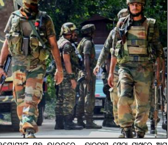
ସହଯୋଗୀଙ୍କ ସହ ଭାରତରେ ଅନୁପ୍ରଦେଶ କରିଥିଲା । ସେମାନେ ବାରମ୍ବାର ଏକ ବଡ଼ ଧରଣର ଆତଙ୍କବାଦୀ କାର୍ଯ୍ୟକଳାପକୁ ରୂପ ଦେଇଥାନ୍ତେ । ତେବେ ସର୍ବ କୁହାଯାଉଛି । ଅଲ୍ଲା ନିକ ୬ ଜଣ ଭାରତୀୟ ସେନା ପାଖରେ ଆପ୍ ସମର୍ଥନ କରିଥିବାବେଳେ ତାର ସହଯୋଗୀ ଫେରାର ହେବାକୁ ପ୍ରସ୍ତାବ କରିବାବେଳେ ସେନା ଗୁଳିରେ ପ୍ରାଣ ହରାଇଛି । ଏହି ସମସ୍ତ ଆତଙ୍କୀ ►►ପୃଷ୍ଠା ୭

ନୂଆଦିଲ୍ଲୀ, ୨୮/୦୯ : ଗଡ଼କିଛି ଦିନ ଧରି ଉରି ସେକ୍ଟରରେ ଜାରି ରହିଛି ସେନାର ଅପରେସନ୍ । ମଙ୍ଗଳବାର ସେନାର ଅପରେସନ୍ ବେଳେ ଜଣେ ୧୯ ବର୍ଷୀୟ ପାକିସ୍ତାନ ଆତଙ୍କବାଦୀ ଗିରଫ ହୋଇଛି । ଗିରଫ ଆତଙ୍କୀ ଅଲ୍ଲା ବାବର ପାତ୍ର ଏବଂ ସେ ଲକ୍ଷ୍ନ-ଉ-ଗୋଇଦା ସଂଗଠନର ବୋଲି ଜଣା ପଡ଼ିଛି । ସାମାଜିକ ଲାଗାତାର ଭାବେ ଆତଙ୍କବାଦୀ ନିପାତ ଅପରେସନ୍ ଜାରି ରଖି ଭାରତୀୟ ସେନା । ୭ ଦିନରେ ୭ ଆତଙ୍କବାଦୀ ନିପାତ କରିବାରେ ସଫଳ ହୋଇଛି ଭାରତୀୟ ସେନା । ଗତ ସେପ୍ଟେମ୍ବର ୧୮ ତାରିଖରୁ ପାକ ସାମ୍ରାଜ୍ୟ ଆତଙ୍କୀ କାର୍ଯ୍ୟକଳାପକୁ ପୁଣି ଥରେ ସକ୍ରିୟ କରିଛି ବୋଲି ସେନା ପକ୍ଷରୁ କୁହାଯାଉଛି । ଅଲ୍ଲା ନିକ ୬ ଜଣ