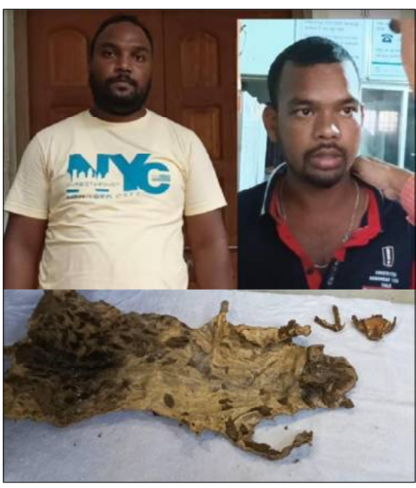
କଣେ ସହଯୋଗୀଙ୍କୁ ମଧ୍ୟ ଘରୁ ଉଠାଇ ଆଣିଛି ବନ ବିଭାଗ । ଗିରଫ ଜଣେ ଯୁବକ ବାରିପଦା

ବାରିପଦା, ୨୧/୦୯ (ନି.ପ୍ର): ବାରିପଦା ସହର ମଧ୍ୟରୁ ଏକ ହୋଟେଲରେ ବିକ୍ରିପାଇଁ ଡିଲି ଚାଲିଥିବା ସମୟରେ ଏକ କଲରାପତରିଆ ବାଘ ଛାଇ ଜବତ ହୋଇଥିବା ଖବର ମିଳିଛି । ବାରିପଦା ସହରର ପେଠପୁଲ ଗାନ୍ଧିକା ନିକଟ ଏକ ହୋଟେଲର ଏକ ରୁମ୍ ମଧ୍ୟରେ ବାଘଛାଇ ବିକ୍ରେତା ଓ କ୍ରେତାଙ୍କ ମଧ୍ୟରେ ମୋଟା ଅଂକର ଡିଲି ଚାଲିଥିବା ସମୟରେ ବିଶ୍ୱସ୍ତ ସୁତରାପ ପାଇ କ୍ଲାଉମ କଂଟ୍ରୋଲ ବ୍ୟୁରୋ ଜବଲପୁର ଟିମ୍, ସ୍ୱେଚ୍ଛାଳ ଚାକ୍ଷୁଷ୍ୟ ଓ ବନ ବିଭାଗ ଅତୀତ ହୋଟେଲରେ ଚଢ଼ାଉ କରି ବାଘ ଛାଇ ଜବତ କରିବା ସହିତ ଏହି କାରବାରରେ ସଂପୃକ୍ତ ଦୁଇଜଣଙ୍କୁ ଗିରଫ କରିଥିବାର ଜଣା ଯାଇଛି । ଗିରଫ ୨ଜଣଙ୍କ ମଧ୍ୟରୁ ଜଣେ ଉତ୍ତରୀୟ ଛାତ୍ର ବୋଲି ଜଣା ପଡ଼ିଛି । ଏହା ସହିତ ଅନ୍ୟ