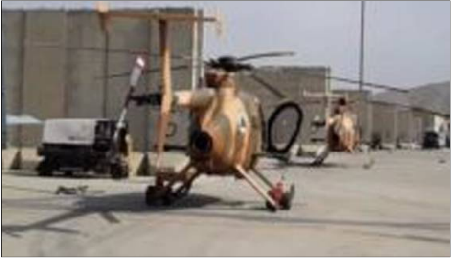
ସ୍ଥିତି ଅନୁକମ୍ପା କରୁଛନ୍ତି । ଏପରି ସ୍ଥିତି ପ୍ରଧାନମନ୍ତ୍ରୀ ନରେନ୍ଦ୍ର ମୋଦି ଏନଏସଏ, ଇଏମ ସମେତ ଉଚ୍ଚ ପଦକ୍ଷ ଅଧିକାରୀମାନଙ୍କ ସହ ଆଲୋଚନା କରି ଆଫଗାନରେ ଥିବା ଭାରତୀୟ ନାଗରିକମାନଙ୍କୁ ଫେରାଇ ଆଣିବା ଉପରେ ଗୁରୁତ୍ୱ ଦେଇଛନ୍ତି । ତେବେ ଆମେରିକା ପୂର୍ବତନ ରାଷ୍ଟ୍ରପତି ଡୋନାଲ୍ଡ ଟ୍ରମ୍ପ ଏଭଳି ସୈନ୍ୟ ପ୍ରତ୍ୟାହାର ନେଇ କୋ ବାଇଡେନ ସରକାରକୁ ସମାଲୋଚନା କରିଛନ୍ତି ।

ନୂଆଦିଲ୍ଲୀ, ୩୧/୦୮: ଦୀର୍ଘ ୨୦ ବର୍ଷର ଲମ୍ବା ଯୁଦ୍ଧ ପରେ ଆମେରିକା ସେନା ସମ୍ପୂର୍ଣ୍ଣ ଭାବେ ଆଫଗାନ ଛାଡ଼ିଛି । ୨୦୦୧ ସେପ୍ଟେମ୍ବର ୧୧ ତାରିଖରେ ଆଫଗାନିସ୍ତାନରେ ଆମେରିକା ପାଦ ରଖିଥିଲା । ଆମେରିକା ସେନା ଆଫଗାନିସ୍ତାନ ଛାଡ଼ିବା ପରେ ଆମେରିକା ରାଷ୍ଟ୍ରପତି ଜୋ ବାଇଡେନ କହିଛନ୍ତି ୨୦ ବର୍ଷର ଯୁଦ୍ଧ ଶେଷ ହୋଇଛି, ଆମେ ଏବେ ଆଫଗାନିସ୍ତାନରେ ଫସି ରହିଥିବା ବାହାର ଦେଶର ନାଗରିକମାନଙ୍କୁ ବାହାରକୁ ଆଣିବାକୁ ଚେଷ୍ଟା ଚଳାଇଛୁ । ଏପଟେ ତାଲିବାନୀମାନେ ଆଫଗାନିସ୍ତାନ କାବିଜି ସମ୍ପୂର୍ଣ୍ଣ ପରିଷ୍କାର ନିଷ୍ପତ୍ତି, ଆଉଁଶିତାୟ ନେତାମାନଙ୍କୁ ବନ୍ଦୀ ନେବା ଆଫଗାନିସ୍ତାନର ଗ୍ରାହଣ କିରୋର