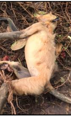
ଅଞ୍ଚଳେ ବର୍ତ୍ତମାନ ଥିବା ବେଳେ କେତେକ ଖଣ୍ଡିଏ ଖବର ଯାଇଥିବା ୧୧ କେଭିଏ ବିଦ୍ୟୁତ୍‌ଚାର ସଂସ୍ପର୍ଶରେ ଆସି ବଡ଼ ମଙ୍କଡ଼ ମୃତ୍ୟୁରଣ କରିଛି । ତା ବଳରେ ଥିବା ଅନ୍ୟ ମାଙ୍କଡ଼ମାନେ

କଲେକ୍ଟର ୧୮/୮(ନି.ପ୍ର) : ଏବେକି ବହୁ ସ୍ଥାନରେ ମୃତୁକା ବିଦ୍ୟୁତ୍ ତାର ଟଣା ଯାଇଥିବାରୁ ବହୁ ସମୟରେ ଦୁର୍ଘଟଣା ଘଟି ଆସୁଛି । ପୂର୍ବରୁ ବିଦ୍ୟୁତ୍ ସଂସ୍ପର୍ଶ ବିତରଣ କରୁଥିବା ସମୟରେ ଖୋଲା ତାର ମାନ ଖଣ୍ଡରେ ରହିଥିବା ବେଳେ ଏବେ ବିଦ୍ୟୁତ୍ ସଂସ୍କାର ଅଣାଯାଇଥିଲେ ମଧ୍ୟ ତାର ପାଖରେ କମ୍ପାନୀ ସହାର ପରିବର୍ତ୍ତନ କରିନାହିଁ । ଫଳରେ ଆମ୍ଭଙ୍କ ଅଠା ଗାଁ ମଧ୍ୟରେ କେତେକ ଖଣ୍ଡିଏ ଖବର ଯାଇଥିବା ୧୧ କେଭିଏ ବିଦ୍ୟୁତ୍‌ଚାର ସଂସ୍ପର୍ଶରେ ଆସି ବଡ଼ ମଙ୍କଡ଼ ମୃତ୍ୟୁରଣ କରିଛି । ତା ବଳରେ ଥିବା ଅନ୍ୟ ମାଙ୍କଡ଼ମାନେ