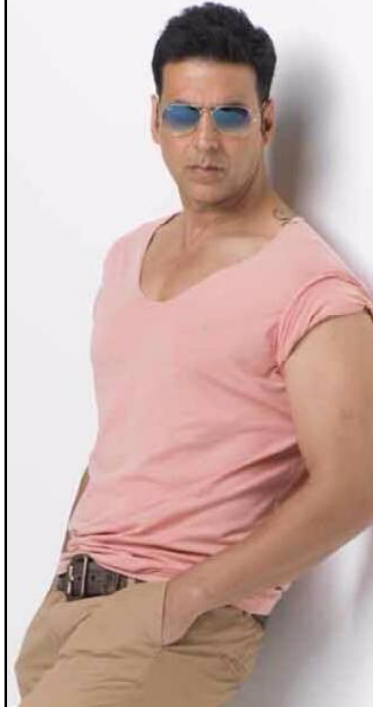
ଏହି ଫିଲ୍ମରେ ଅକ୍ଷୟଙ୍କ ଅପୋଜିଟ୍ ବାଣୀ କପୁର, ହୁମା କୁରେଶି ଏବଂ ଲାରା ଦତ୍ତା ପ୍ରମୁଖ ଅଛନ୍ତି । 'ବେଲ୍ ବଟମ୍' ବ୍ୟତୀତ ଅକ୍ଷୟ କୁମାର ଫିଲ୍ମ 'ସୂର୍ଯ୍ୟଂଶୀ', 'ବଜନ ପାଠେ', 'ରକ୍ଷା ବନ୍ଧନ', 'ରାମ ସେଟ୍', 'ଅଚରଣି ରେ', 'ପୃଥ୍ୱୀରାଜ' ଭଳି ଫିଲ୍ମରେ ନଜର ଆସିବେ ।