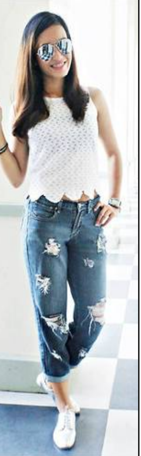
ବେଳେକେ ମଧ୍ୟ ମଧ୍ୟାତ୍ମ କରାଯାଇପାରିବ । ରିପର୍ଟ ଜିନ୍ସ ହେଉଛି ଉପଯୁକ୍ତ କାକୁଆଳ ଆଉଟଫିଟ୍ । ସବୁଠୁ ବୁଲି ଲୁକ୍ ପାଇବାକୁ ଚାହୁଁଥିଲେ ଏକ ସାଦା ଟି ସାର୍ଟ ଏବଂ ହଳେ ସ୍ଵିକର ଅଥବା ହେକର୍ଟ ବୁର୍ଟ ପିନ୍ଧିହେବ । ତେବେ ସବୁ ସମୟରେ ଜିନ୍ସ ଯେଉଁକି ସମସ୍ତ ପୋଷାକରେ ପ୍ରମୁଖ ବ୍ୟବହୃତ ହେବ ସେଥିପ୍ରତି ପୁଷ୍ଟି ଦେବାକୁ ପଡ଼ିବ । ସେହି ଅନୁସାରେ ପ୍ରସ୍ତୁତ କରିବାକୁ ହେବ ଜିନ୍ସ ।