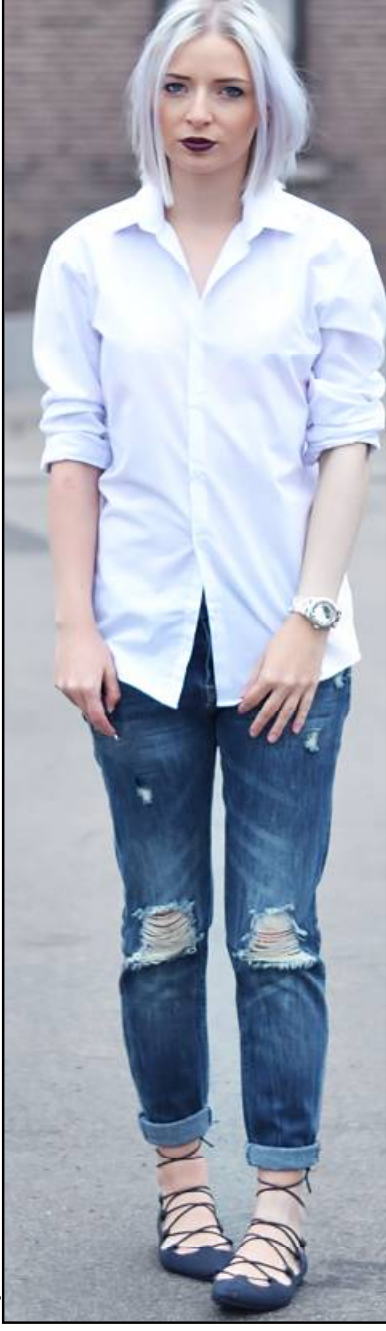
ଫ୍ୟାଶନେବଳ ପୋଷାକ ବାଛିବା କ୍ଷେତ୍ରରେ ଏବେକାର ଯୁବପିଢ଼ି ରିପର୍ଟ ଜିନ୍ସ ଅଧିକ ପସନ୍ଦ କରୁଛନ୍ତି । ଉତ୍ତମ ଖାଲିକିଏ ଓ ଟ୍ରେଣି ଲୁକ୍ ପାଇଁ ଏହାର ବଜାର

ଚାହିଦା ମଧ୍ୟ ବେଶ୍ ଉଚ୍ଚିଛି । ତେବେ ଏହି ରିପର୍ଟ ଜିନ୍ସ ସହ କିଭଳି ପୋଷାକକୁ ଟିମ୍ ଅପ୍ କଲେ ଭଲ ଲାଗିବ ସେ ବିଷୟରେ ମଧ୍ୟ ଜାଣିବା ଦରକାର । ଗରମ ଆରମ୍ଭ ହୋଇଗଲାଣି । ତେଣୁ ଏ ସମୟରେ ଆପଣ ରିପର୍ଟ ଜିନ୍ସ ସହପୁରଲେସ୍ ଟପ୍‌କୁ ଟିମ୍ ଅପ୍ କଲେ ଅଧିକ ଖାଲିକିଏ ଲାଗିବେ । ଅନୁରୂପ ଭାବେ ଶ୍ଵେତ ରିପର୍ଟ ଜିନ୍ସ ସହିତ ସାମାନ୍ୟ ଲମ୍ବା ସାର୍ଟ ଖୁବ୍ ମାନିବ । ଏକ କାର୍ଡିଗାନ ଏବଂ ସ୍କର୍ଟ ସହିତ ଏହା ମଧ୍ୟାତ୍ମ କରିବ । ଅପେକ୍ଷାକୃତ ଗରମ ଦିନରେ ପୁରୁ ଶାଢ଼ୀ ସହିତ କିମୋନୋ ଟପ୍ ସଠିକ୍ କାକୁଆଳ ଲୁକ୍ ଦେବ ।