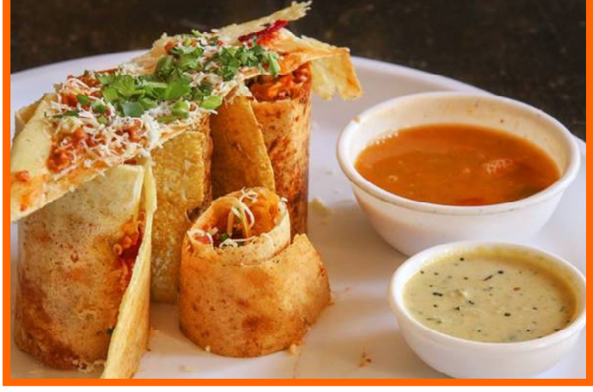
ଖାଇବାକୁ ପସନ୍ଦ କରୁଥିବା ଲୋକମାନଙ୍କ ପାଇଁ ଏକ ନୂଆ ଅନୁଭୂତି । ପାରମ୍ପରିକ ଦୋସାର ମେକ୍ସିକାନ୍ ସ୍ଵାଦ ଯୋଗୁଁ ଏହି ଦୋସା ପର୍ଯ୍ୟଟକମାନଙ୍କର ପସନ୍ଦ ପାଇଛି । ଛେନା, କ୍ୟାପସିକମ୍, ପିଆଜ ଷଣ୍ଡା, ଟମାଟୋ ଓ ଚିଲି ସ୍ଵ୍ ସହ ମେକ୍ସିକାନ୍ ମସାଲା ଦିଆଯାଇ ଏହାର ପୁର ପ୍ରସ୍ତୁତ କରାଯାଏ । ଏହର ଦୋସାକୁ ନଡ଼ିଆ ଚଟଣି ସହ ପରଷାଯାଏ । ପ୍ରଥମ ପସନ୍ଦ ପାଇଛି । ମହାଶୂର ମସାଲା ଦୋସା ଏହି ଦୋସା ଦକ୍ଷିଣ ଭାରତୀୟ ଖାଦ୍ୟମାନଙ୍କ ମଧ୍ୟରେ ସବୁଠାରୁ ନିଆରା । ଚିନି ପ୍ରକାର ତାଲି, ବୁଡା, ଦରସିଝା ଚାଉଳ ଓ କଞ୍ଚା ଚାଉଳର ମିଶ୍ରଣରେ ଏହାର ପିଠଉ ପ୍ରସ୍ତୁତ କରାଯାଏ । ଏହା ଖାଇବାକୁ ବେଶ୍ ସୁଆଦିଆ ।