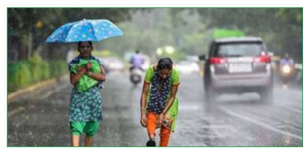
ବିଭିନ୍ନ ଘଡ଼ଘଡ଼ି ସହ ବର୍ଷା ସମ୍ଭାବନା ରହିଛି । ଗତ ମାସକ ଭିତରେ ରାଜ୍ୟରେ ସ୍ୱାଭାବିକ ଠାରୁ ୧୮ ପ୍ରତିଶତ କମ୍ ବର୍ଷା ହୋଇଛି । ବିଶେଷକରି ଭଦ୍ରକ, ଗଜପତି, କେନ୍ଦୁଝର, ଯାଜପୁର ଓ ଗଞ୍ଜାମରେ ବର୍ଷା ରେକର୍ଡ୍ ହୋଇଛି । ସବୁକୁ କମ୍ ବର୍ଷା ହୋଇଛି । ଭଦ୍ରକରେ ୫୪ ପ୍ରତିଶତ, ଗଜପତି ୪୯ ପ୍ରତିଶତ, କେନ୍ଦୁଝର ୪୪ ପ୍ରତିଶତ, ଯାଜପୁର ୪୩ ପ୍ରତିଶତ ଓ ଗଞ୍ଜାମରେ ୪୨ ପ୍ରତିଶତ କମ୍ ବର୍ଷା ରେକର୍ଡ୍ ହୋଇଛି ।

ଭୁବନେଶ୍ୱର, ୦୨/୦୭(ନି.ପ୍ର): ଆଗାମୀ ୨୪ ଘଣ୍ଟାରେ ୨୩ ଜିଲ୍ଲାରେ ବର୍ଷାର ପୂର୍ବାନୁମାନ କରିଛି ପାଣିପାଗ ବିଭାଗ । ବାଲେଶ୍ୱର, ଭଦ୍ରକ, ଯାଜପୁର, କେନ୍ଦ୍ରାପଡ଼ା, କଟକ, ଜଗତସିଂହପୁର, ପୁରୀ, ଖୋର୍ଦ୍ଧା, ନୟାଗଡ଼, ଗଞ୍ଜାମ, ଗଜପତି, କେନ୍ଦୁଝର, ମୟୂରଭଞ୍ଜରେ ବର୍ଷାର ପୂର୍ବାନୁମାନ ହୋଇଛି । ତେଜନାଳ, ଅନୁଗୁଳ, ବୋଧ, ସୋନପୁର, କନ୍ଧମାଳ, ରାୟଗଡ଼ା, କୋରାପୁଟ, ମାଳକାନଗିରି, ନବରଙ୍ଗପୁର ଏବଂ କଳାହାଣ୍ଡିରେ ଆଗାମୀ ୨୪ ଘଣ୍ଟାରେ ବର୍ଷା ହୋଇପାରେ । ଏସବୁ ସ୍ଥାନରେ