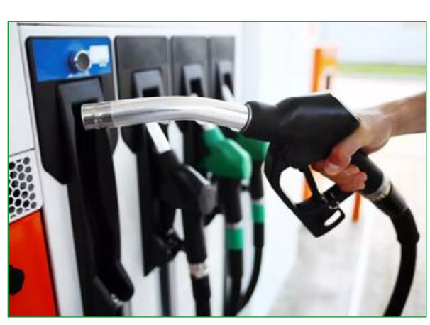
କରିଛି । ପେଟ୍ରୋଲ ଦରରେ ଲଗାତାର ଏଭଳି ବୃଦ୍ଧି ଗ୍ରାହକଙ୍କ ମଧ୍ୟରେ ଅସନ୍ତୋଷ ସୃଷ୍ଟି କରିଛି । ଏପରିକି ପେଟ୍ରୋଲ ପାଇଁ ଗଡ଼ କିଛି ଦିନ ହେବ ପେଟ୍ରୋଲ ଦରରେ ଲଗାତାର ବୃଦ୍ଧି ପାଇଛି । ଗାଡି ବାହାର କରିବା ପୂର୍ବରୁ ଲୋକେ ଚିନ୍ତା କରୁଛନ୍ତି । ପକେଟ ଫାଙ୍କା ହୋଇଯାଉଥିବା କହିଛନ୍ତି ଲୋକେ ।

ଭୁବନେଶ୍ୱର, ୦୨/୦୭(ନି.ପ୍ର): ପେଟ୍ରୋଲ ଦରରେ ସେଥିପାଇଁ । ଆଜି ପେଟ୍ରୋଲ ଦର ରାଜ୍ୟର ଅଧିକାଂଶ ସ୍ଥାନରେ ଶତକ ପାର କରିଛି । କାଲିଫୋରୀରେ ଏହା ସର୍ବାଧିକ ୧୦୬ଟଙ୍କା ରହିଛି । ସେହିଭଳି ନବରଙ୍ଗପୁରରେ ପେଟ୍ରୋଲ ଲିଟର ପିଛା ୧୦୪ ଟଙ୍କା ୧୧ ପଇସା ରହିଛି । ଖୋର୍ଦ୍ଧା ଓ କଟକରେ ବି ପେଟ୍ରୋଲ ଦର ଶହେ ପାର କରିଛି । ଖୋର୍ଦ୍ଧାରେ ପେଟ୍ରୋଲ ଦର ୧୦୦ ଟଙ୍କା ୬ ପଇସା ରହିଥିବାବେଳେ କଟକରେ ପେଟ୍ରୋଲ ଦର ଲିଟର ପିଛା ୧୦୦ ଟଙ୍କା ୨୭ ପଇସା ରହିଛି । ଅନ୍ୟ ସହରରେ ବି ପେଟ୍ରୋଲ ଶତକ ପାର