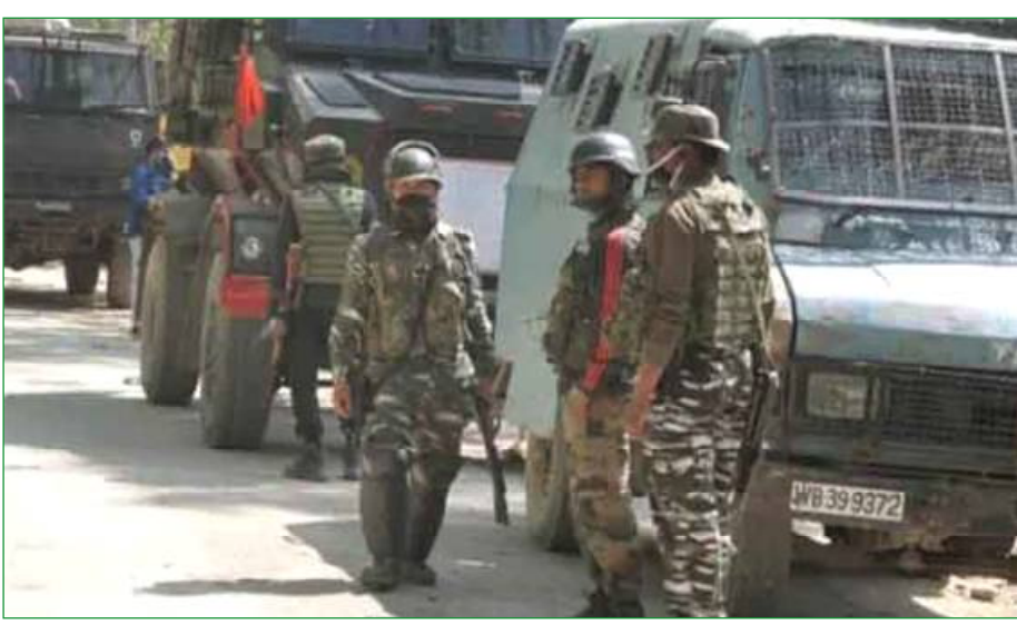
କରଣ କରିଛନ୍ତି । ନିହତ ହୋଇଥିବା ସମସ୍ତ ଆତଙ୍କୀ ଲଘୁ-ଇ-ତୋଇବାର ବୋଲି ସୂଚନା ଦେଇଛନ୍ତି ଜଣ୍ଡକଣ୍ଠାର ଆଉଟି । ଅନ୍ୟପଟେ ଗୁଳିବିନିମୟରେ ଜଣେ ଯବାନ ସହିଦ ହେବା ସହ ଜଣେ ସ୍ତ୍ରୀଙ୍କର ବାଧ୍ୟତା ମଧ୍ୟ ପ୍ରାଣ ହରାଇଛନ୍ତି । ପୁଲଝାମା ହିତ ରାଜପୁରା ଗାଁରେ ଆତଙ୍କୀ ଥିବା ଖବର ପାଇଥିଲେ ସ୍ତ୍ରୀଙ୍କର

ପୁଲଝାମା, ୦୨/୦୭ : ୧୨ ଘଣ୍ଟାକୁ ଅଧିକ ସମୟ ଧରି ଜାରି ରହିଥିବା ପୁଲଝାମା ଏନକାଉଣ୍ଡର ଶେଷ ହୋଇଛି । ଆଉ ସେନା ଗୁଳିରେ ନିହତ ହୋଇଛନ୍ତି ଲଘୁ-ଇ-ତୋଇବାର ୫ ଆତଙ୍କୀ । ସେପଟେ ଆତଙ୍କୀଙ୍କ ସହ ଗୁଳିବିନିମୟରେ ଜଣେ ଯବାନ ସହିଦ ହୋଇଛନ୍ତି । ଜଣ୍ଡକଣ୍ଠାର ପୁଲଝାମାରେ ସରିଲା ଏନକାଉଣ୍ଡର । ଦୀର୍ଘ ଘଣ୍ଟାର ଗୁଳିବିନିମୟ ପରେ ସେନାକୁ ମିଳିଛି ସଫଳତା । ପୁରୁଷାକର୍ମୀଙ୍କ ଗୁଳିରେ ୫ଜଣ ଆତଙ୍କବାଦୀ ନିପାତ ହୋଇଛନ୍ତି । ଶୁକ୍ରବାର ଭୋରକୁ ରାଜପୋରା ଜିଲ୍ଲା ହାଜିନ ଗାଁରେ ଲୁଚି ରହିଥିବା ଆତଙ୍କବାଦୀଙ୍କୁ ଯେଉଁଥିଲେ ପୁରୁଷାକର୍ମୀ । ପ୍ରତ୍ୟେକ ଆତଙ୍କୀ ସେନାର ଗୁଳିରେ ମୃତ୍ୟୁ