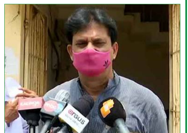
ପରୀକ୍ଷା ହେବ । ଆଉ ପରୀକ୍ଷାର ୧୫ ଦିନ ମଧ୍ୟରେ ରେକର୍ଡ୍ ପ୍ରକାଶ ପାଇଁ ଚେଷ୍ଟା କରାଯିବ । ତେଣୁ ପରୀକ୍ଷା ଫଳାଫଳକୁ ନେଇ ଯେଉଁମାନଙ୍କର ଆଶଙ୍କା ରହିଛି, ସେମାନେ ଫର୍ମାଟିଂ କରନ୍ତୁ । ଉଲ୍ଲେଖନୀୟ ଯେ ଚଳିତ ଥର ମାଟ୍ରିକ ପରୀକ୍ଷାରେ ୯୭.୮୯% ଛାତ୍ରଛାତ୍ରୀ ପାସ କରିଛନ୍ତି । ମୋଟ ୫ ଲକ୍ଷ ୭୪ ହଜାର ୧୨୫ ଜଣ ଛାତ୍ରଛାତ୍ରୀ ପରୀକ୍ଷା ଦେଇଥିଲେ । ସେମାନଙ୍କ ମଧ୍ୟରୁ ୫୨୨ ହଜାର ୧୦ ଜଣ ଛାତ୍ରଛାତ୍ରୀ ପାସ କରିଥିଲେ ।

ଭୁବନେଶ୍ୱର, ୦୨/୦୭ (ନି.ପ୍ର): ମାଟ୍ରିକ ପରୀକ୍ଷା ମାର୍ଚ୍ଚ ୧୫ରେ ଅସରୁ ଥିବା ଛାତ୍ରଛାତ୍ରୀଙ୍କ ପାଇଁ ଅଫ୍‌ଲାଇନ୍‌ରେ ପରୀକ୍ଷା ୭୦ ପ୍ରତିଶତ ସିଲାବସ୍ ମଧ୍ୟରେ ହେବ । ସ୍କୁଲ ଓ ଶିକ୍ଷା ମନ୍ତ୍ରାଳୟର ଦାଖଲ ଆଦି ସୂଚନା ଦେଇଛନ୍ତି । ସେ କହିଛନ୍ତି ଯେ ଏଥିପାଇଁ ଆସନ୍ତା ୫ ତାରିଖକୁ ଫର୍ମାଟିଂ ପ୍ରକ୍ରିୟା ଆରମ୍ଭ ହେବ । ଜୁଲାଇ ୧୪ ତାରିଖ ପର୍ଯ୍ୟନ୍ତ ଫର୍ମାଟିଂ ଚାଲିବ । ଜୁଲାଇ ୩୦ରୁ ଅନ୍ୟ ୫ ଯାଏ ପରୀକ୍ଷା ହେବ । କୋଭିଡ୍ ଗାଢ଼ତ୍ୱାଚାର ଫଳସ୍ୱରୂପ କରି ପରୀକ୍ଷା କରାଯିବ ବୋଲି ସେ କହିଛନ୍ତି । ମନ୍ତ୍ରାଳୟର ଦାଖଲ କହିଛନ୍ତି, ୩୦% ସିଲାବସ୍ ହ୍ରାସ ହୋଇଥିବାରୁ ୭୦% ମଧ୍ୟରେ