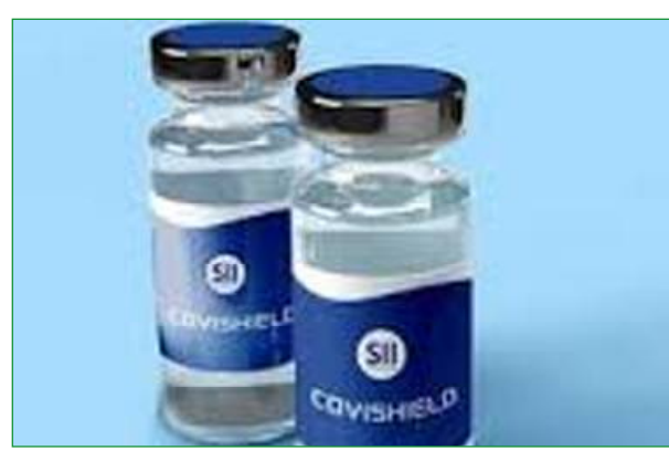
ଦୁଇ ଦିନ ହେବ ରାଜ୍ୟରେ ଓ କୋଭାକ୍ସିନ ଟିକା ଆସି ଟିକାକରଣ ବନ୍ଦ ରହିଥିଲା । ପହଞ୍ଚିବା ପରେ ଏବେ ପୁଣି ବର୍ତ୍ତମାନ ରାଜ୍ୟରେ କୋଭିଡିସିଲ୍ ଟିକାକରଣ ଆରମ୍ଭ ହେବ ।

ଭୁବନେଶ୍ୱର, ୦୨/୦୭(ନି.ପ୍ର): ରାଜ୍ୟକୁ ଆସିଲା ଆଉ ୯ ଲକ୍ଷ ୪୩ ହଜାର ୯୩୦ କୋଭିଡିସିଲ୍ ଟିକା । ଭୁବନେଶ୍ୱରରେ ଏହି କୋଭିଡିସିଲ୍ ଟିକା ଆସି ପହଞ୍ଚିଛି । ଏନେଇ ରାଜ୍ୟ ସ୍ୱାସ୍ଥ୍ୟ ବିଭାଗ ପକ୍ଷରୁ ସୂଚନା ମିଳିଛି । ଗତକାଲି ୧ ଲକ୍ଷ ଟିକା ଆସି ଭୁବନେଶ୍ୱରରେ ପହଞ୍ଚିଥିଲା । ତେବେ ଟିକା ଆସିବା ପରେ ପୁଣି ରାଜ୍ୟରେ ଆରମ୍ଭ ହେବ ଟିକାକରଣ । ଗତକାଲି ରାଜ୍ୟକୁ କୋଭାକ୍ସିନ ଟିକା ମଧ୍ୟ ଆସି ପହଞ୍ଚିଛି । ଟିକା ଅଭାବରୁ ଗତ