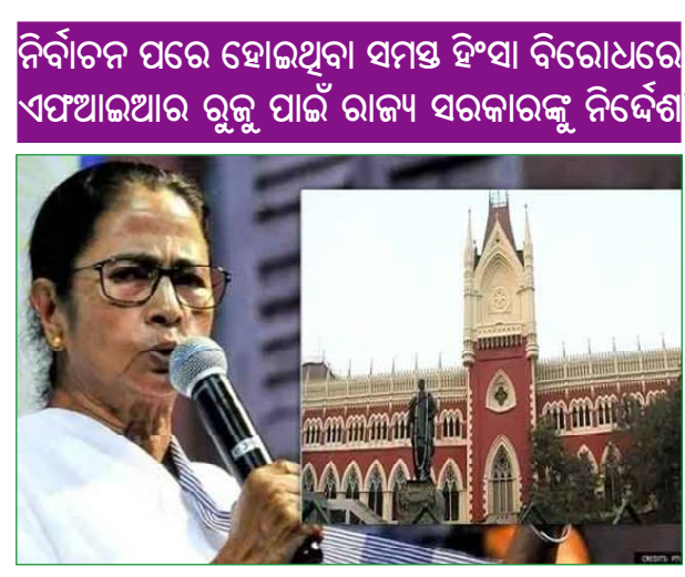
ନିର୍ବାଚନ ପରେ ହୋଇଥିବା ସମସ୍ତ ହିଂସା ବିରୋଧରେ ଏଫଆଇଆର ରୁକୁ ପାଇଁ ରାଜ୍ୟ ସରକାରଙ୍କୁ ନିର୍ଦ୍ଦେଶ ଦେଇଛନ୍ତି କୋର୍ଟ । ହିଂସାର ଶିକାର ହୋଇ ଅନେକ ଲୋକ ଅନ୍ୟରାଜ୍ୟକୁ ପଳାଇଛନ୍ତି ଓ ପ୍ରାଣ ଭୟରେ ଫେରିବାକୁ ଚାହୁଁନଥିବା ଅଭିଯୋଗ ହୋଇଥିଲା । ଏହାକୁ ମୁଖ୍ୟ ଶାସନ ସଚିବଙ୍କୁ ନିର୍ଦ୍ଦେଶ ଦେଇଛନ୍ତି କୋର୍ଟ । ହିଂସାର ଶିକାର ହୋଇ ଅନେକ ଲୋକ ଅନ୍ୟରାଜ୍ୟକୁ ପଳାଇଛନ୍ତି ଓ ପ୍ରାଣ ଭୟରେ ଫେରିବାକୁ ଚାହୁଁନଥିବା ଅଭିଯୋଗ ହୋଇଥିଲା । ଏହାକୁ ଏନେଇ ଏକ ଜନସ୍ୱାର୍ଥ ମାମଲା ରୁକୁ କରାଯାଉଥିଲା । ହିଂସା ମାମଲାର ତଦନ୍ତ କରିବା ପାଇଁ କୋର୍ଟ କାତୀୟ ମାନବାଧିକାର କମିଶନଙ୍କୁ ଦାୟିତ୍ୱ ହସ୍ତାନ୍ତର କରିଛନ୍ତି ।

ପଶ୍ଚିମବଙ୍ଗ, ୦୨/୦୭(ନି.ପ୍ର): ପଶ୍ଚିମବଙ୍ଗ ମୁଖ୍ୟମନ୍ତ୍ରୀ ମମତା ବାନାର୍ଜୀଙ୍କୁ କୋଲକାତା ହାଇକୋର୍ଟଙ୍କ ଝଟକା । ପଶ୍ଚିମବଙ୍ଗ ବିଧାନସଭା ନିର୍ବାଚନ ପରେ ରାଜ୍ୟରେ ହୋଇଥିବା ସମସ୍ତ ହିଂସା ବିରୋଧରେ ଏଫଆଇଆର ରୁକୁ କରିବା ପାଇଁ ରାଜ୍ୟ ସରକାରଙ୍କୁ ନିର୍ଦ୍ଦେଶ ଦେଇଛନ୍ତି ହାଇକୋର୍ଟ । ଏଥିସହ ହିଂସାରେ ପ୍ରଭାବିତ ପାଟିଡ଼ାକ ସମସ୍ତ ଟିକିଆ ଖର୍ଚ୍ଚ ଓ ରାସନ ଖର୍ଚ୍ଚ ମମତା ସରକାର ଯୋଗାଯୋଗକୁ କୋର୍ଟ କହିଛନ୍ତି । ଅନ୍ୟପଟେ ଏନଏଚଆରସି ଟିମର ତଦନ୍ତ ଅବଧିକୁ ବୃଦ୍ଧି କରି କୋର୍ଟ ଏହାକୁ ଜୁଲାଇ ୧୩ ପର୍ଯ୍ୟନ୍ତ କାରି ରଖିବାକୁ କହିଛନ୍ତି । ଜୁଲାଇ ୧୩ରେ ହେବ ମାମଲାର ଆଗାମୀ ଶୁଣାଣୀ । ହିଂସା ମାମଲାର ସମସ୍ତ ଦାୟିତ୍ୱ ସୂଚନା ରଖିବା ପାଇଁ