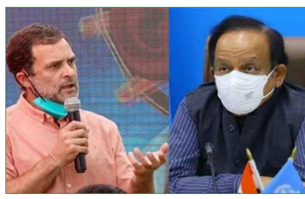
ରାହୁଲ ପଚାରିଲେ ଜୁଲାଇ ଆସିଲା, ଟିକା କାହିଁ, ହର୍ଷବର୍ଦ୍ଧନ କହିଲେ ଅହଙ୍କାରୀ ଭୂତାଣୁ ପାଇଁ ନାହିଁ ଟିକା ସ୍ୱାସ୍ଥ୍ୟମନ୍ତ୍ରୀ । ଦ୍ୱିତୀୟ କେନ୍ଦ୍ର ସ୍ୱାସ୍ଥ୍ୟମନ୍ତ୍ରୀ ହର୍ଷବର୍ଦ୍ଧନ କହିଲେ କେନ୍ଦ୍ର ସ୍ୱାସ୍ଥ୍ୟମନ୍ତ୍ରୀ ହର୍ଷବର୍ଦ୍ଧନ ଓ କଂଗ୍ରେସ ନେତା ରାହୁଲ ଗାନ୍ଧୀଙ୍କୁ ଅହଙ୍କାରୀ କହିଲେ କେନ୍ଦ୍ର ସ୍ୱାସ୍ଥ୍ୟମନ୍ତ୍ରୀ । କଂଗ୍ରେସ ନେତା ରାହୁଲ ଗାନ୍ଧୀଙ୍କ ଟିକା ଉପରେ କରାଯାଇଥିବା ପ୍ରଶ୍ନର କିଛି ଏପରି ଉତ୍ତର ରଖିଛନ୍ତି କେନ୍ଦ୍ର

ନୂଆଦିଲ୍ଲୀ, ୦୨/୦୭: ଦ୍ୱିତୀୟ ପୁଞ୍ଜାମୁହିଁ ହେଲେ କେନ୍ଦ୍ର ସ୍ୱାସ୍ଥ୍ୟମନ୍ତ୍ରୀ ହର୍ଷବର୍ଦ୍ଧନ ଓ କଂଗ୍ରେସ ନେତା ରାହୁଲ ଗାନ୍ଧୀ । କୋଭିଡ୍-୧୯ ଟିକାକୁ ନେଇ ଦ୍ୱିତୀୟ ପରସ୍ପରକୁ କଲେ ସମାଲୋଚନା । ରାହୁଲ ଗାନ୍ଧୀଙ୍କୁ ସାମାଲୋଚନା କରି ହର୍ଷବର୍ଦ୍ଧନ ଦ୍ୱିତୀୟ କରିଛନ୍ତି ଯେ, ଅହଙ୍କାରୀ ଆଉ ଅଜ୍ଞାନଙ୍କ ପାଇଁ କୋଭିଡ୍ ଟିକା ନାହିଁ । କରୋନା ଟିକାକୁ ନେଇ ରାହୁଲ-ହର୍ଷବର୍ଦ୍ଧନ ପୁଞ୍ଜାମୁହିଁ । ରାହୁଲଙ୍କୁ ଅହଙ୍କାରୀ କହିଲେ କେନ୍ଦ୍ର ସ୍ୱାସ୍ଥ୍ୟମନ୍ତ୍ରୀ । କଂଗ୍ରେସ ନେତା ରାହୁଲ ଗାନ୍ଧୀଙ୍କ ଟିକା ଉପରେ କରାଯାଇଥିବା ପ୍ରଶ୍ନର କିଛି ଏପରି ଉତ୍ତର ରଖିଛନ୍ତି କେନ୍ଦ୍ର