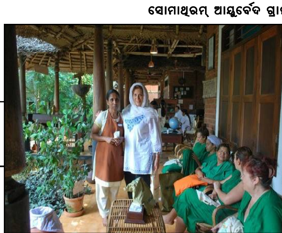
ସୋମାଥରମ୍ ଆୟୁର୍ବେଦ ସ୍ଥାନ, କେରଳ:

ପ୍ରତିଦିନ ରାତିରେ ଟିକି ପିଆ ବାବାମକୁ ଭିଜାଇ, ସକାଳେ ଏହାକୁ ଖାଇ ଆପଣ ପିଆନ୍ତୁ । ଦେଖିବେ ଲୋ କୁଟ ପ୍ରେସରକୁ ଆରାମ ମିଳିବ ସହ ସ୍ମରଣ ଶକ୍ତିକୁ ବି ପ୍ରସ୍ତର ହେବ । ଗଣ୍ଠି ଯନ୍ତ୍ରଣାକୁ ବ୍ୟଥା ଅଧିକ, ତା ହେଲେ ଅମୃତଭଣ୍ଡାର କୋମଳ ପତ୍ରକୁ ବାଟି ଯନ୍ତ୍ରଣା ହେଉଥିବା ସ୍ଥାନରେ ଲଗାନ୍ତୁ ଆରାମ ମିଳିବ । ତୁଳସୀ ମଞ୍ଜିକୁ ବଡ଼ ଦାନା ମୁକ୍ତ ଚିନି ଓ କ୍ଷୀର ସହିତ ମିଶାଇ ପିଇଲେ ମୂତ୍ରାଶୟନରେ ଅଧିକ ଥିବା ସ୍ଵେଦ ଦୂର ହୋଇଥାଏ । ପ୍ରତିଦିନ ସକାଳୁ ଖାଲି ପେଟରେ ଅଧା ଚାମଚ ମେଥି ପୁଣିକୁ ନଖ ଉଷୁମ ପାଣିରେ ମିଶାଇ ସେବନ କଲେ ଗଣ୍ଠି ଯନ୍ତ୍ରଣାକୁ ଉପଶମ ମିଳିବ ।