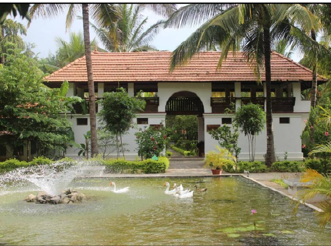
ଆୟୁର୍ବେଦସ୍ଥାନ ହେରିଚେକ ସ୍ଵେଚ୍ଚନେସ ସେକ୍ଟର, ବେଙ୍ଗାଲୁରୁ:

ଏଠାକାର ଚୋଡ଼ାବା ବେକାକୁମ୍ଭିରେ ଥିବା ସୋମାଥରମ୍ରେ ରିସୋର୍ଟର ସୁବିଧା ସହ ଆୟୁର୍ବେଦୀୟ ଚିକିତ୍ସା ପାଇପାରିବେ । ତ୍ରିଭେନ୍ଦ୍ରମ ଆନ୍ତର୍ଜାତୀୟ ବିମାନ ବନ୍ଦର ଏହାର ନିକଟତର । ଏଠାରେ ପଞ୍ଚକର୍ମ ସହ ମାଲିସ, ଶିରୋଧାରା, ବସ୍ତି, ଶିରୋବସ୍ତି, ଅଭ୍ୟାଙ୍ଗମ, ନାସ୍ୟମ ଆଦି ଆୟୁର୍ବେଦୀୟ ପଦ୍ଧତିରେ ଶରୀରକୁ ବିଷାକ୍ତ, ତରୁମୁକ୍ତ କରିପାରିବେ । ନିକଟ ଔଷଧୀୟ ଉଦ୍ୟାନରୁ ଆସୁଥିବା ଜଡ଼ିବୁଟି ଏଠାରେ ବ୍ୟବହାର କରାଯାଏ । ପଦ୍ମନାଭସାମୀ ମନ୍ଦିର, ଚିଡ଼ିଆଖାନା, ଏକାଧିକ ସଂଗ୍ରହାଳୟ ଏହା ନିକଟରେ ରହିଛି ।