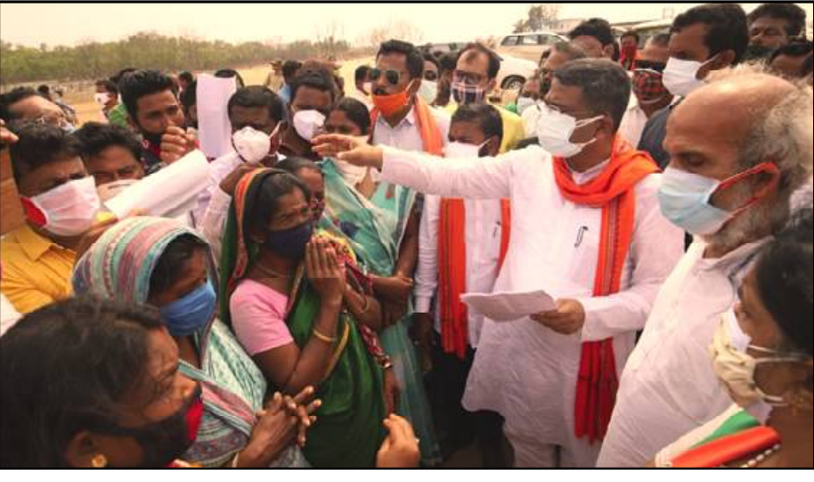
ପ୍ରଧାନ ଏହା କହିଛନ୍ତି । ଏହାସହ ବାତ୍ୟା ବିପଦକୁ ଭେଟି ରିଲିଫ୍ କାର୍ଯ୍ୟ, ବାତ୍ୟା ପରବର୍ତ୍ତୀ ଅଭିଧାନ ଏବଂ ଅନ୍ୟାନ୍ୟ ସମସ୍ୟା ଉପରେ କେନ୍ଦ୍ରମନ୍ତ୍ରୀ ଆଲୋଚନା କରିଛନ୍ତି । ଶ୍ରୀ ପ୍ରଧାନ କହିଛନ୍ତି ଯେ ବାଲେଶ୍ୱର ଜିଲ୍ଲାର ଦାରିଗୋଛିଆ ଅଂଚଳରେ ସମାଜକୁ ଆହୁରି ହେଲେ ଏଠାରେ ଲୁଚି ପାରିବ ।

ବାଲେଶ୍ୱର/ଭୁବନେଶ୍ୱର, ୩୧/୦୫ (ନି.ପ୍ର): ବାତ୍ୟା ଓ ବନ୍ୟା ପ୍ରଭାବିତ ଅଂଚଳ ବିଶେଷ ଭାବରେ ସମୁଦ୍ର ତଟବର୍ତ୍ତୀ ଅଂଚଳରେ ବସବାସ କରୁଥିବା ମହାଜୀବା ଚାଷୀଙ୍କ ଜୀବନଜୀବିକାକୁ ସୁରକ୍ଷିତ କରିବା ପାଇଁ ଏକ ସ୍ୱାୟତ୍ତ ଦୂରଦର୍ଶୀ ପଦକ୍ଷେପ ନେବା ଜରୁରୀ ବୋଲି କହିଛନ୍ତି କେନ୍ଦ୍ରମନ୍ତ୍ରୀ ଧର୍ମେନ୍ଦ୍ର ପ୍ରଧାନ । ସୋମବାର ସାମୁଦ୍ରିକ ବାତ୍ୟା "ୟର୍ଶ୍ୱ" ଦ୍ୱାରା ପ୍ରଭାବିତ ହୋଇଥିବା ବାଲେଶ୍ୱର ଜିଲ୍ଲା ଶ୍ରୀକୋଣା ପଂଚାୟତର ଦାରିଗୋଛି ଆ ଗାଁ, ସାରଥୀ ପଂଚାୟତର ମୁହାଣ ସମେତ ଆଖପାଖ ବାତ୍ୟା କ୍ଷତିଗ୍ରସ୍ତ ଅଂଚଳ ପରିଦର୍ଶନ କରିବା ପରେ ଗଣମାଧ୍ୟମକୁ ପ୍ରତିକ୍ରିୟା ଦେଇ ଶ୍ରୀ