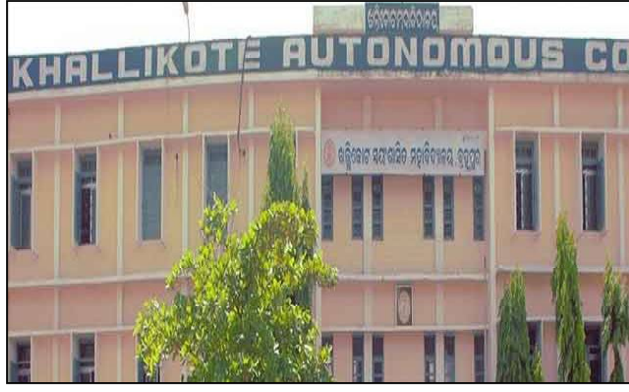
ବ୍ରହ୍ମପୁରରେ ୧୮୫୬ ମସିହାରୁ ଏକ ଷ୍ଟୁଲରୁ ଆରମ୍ଭ ହୋଇଥିଲା ଏହି ଅନୁଷ୍ଠାନର ଯାତ୍ରା । ୧୮୭୮ ମସିହାରେ ଏହା ଉନ୍ନତମାନସ କଲେଜରେ ପରିଣତ ହୋଇଥିଲା । ଏହାର ପୂର୍ବ ନାଁ ନେଟିଭ୍ କଲେଜ ଥିଲା । ୧୮୯୩ରେ ଏହାର ନାଁ ଖଲିକୋଟ କଲେଜ ହୋଇଥିଲା ।

ଭୁବନେଶ୍ୱର, ୫/୫ (ନି.ପ୍ର): ଖଲିକୋଟ ସ୍ୱୟଂଶାସିତ କଲେଜକୁ ମିଲିଲା ଏକକ ବିଶ୍ୱବିଦ୍ୟାଳୟ ମାନ୍ୟତା । ପୁଖ୍ୟମନ୍ତ୍ରୀ ନବୀନ ପଟ୍ଟନାୟକ ଆଜି କରିଛନ୍ତି ଏହି ଘୋଷଣା । ଖଲିକୋଟ କଲେଜ ରାଜ୍ୟର ଏକ ପୁରୁଣା କଲେଜ । ଏହାର ଏକ ଷ୍ଟରଟ୍ ପରିଚିତ ରହିଛି । ଏଠାରେ ପାଠପଢ଼ୁଥିବା ଅନେକ ଛାତ୍ରଛାତ୍ରୀ ବିଭିନ୍ନ କ୍ଷେତ୍ରରେ ନିଜକୁ ପ୍ରତିଷ୍ଠିତ କରିପାରିଛନ୍ତି । ଖଲିକୋଟ କଲେଜକୁ ଏକକ ବିଶ୍ୱବିଦ୍ୟାଳୟ ମାନ୍ୟତା ପ୍ରଦାନ ଫଳରେ ଦକ୍ଷିଣ ଓଡ଼ିଶା ଲୋକଙ୍କ ଆଶା ଓ ଆଶଃକ୍ଷା ପୂରଣ ହୋଇଛି । ଏକକ ବିଶ୍ୱବିଦ୍ୟାଳୟ ମାନ୍ୟତା ପାଇବା ପରେ ଏହି ଅନୁଷ୍ଠାନ ଶିକ୍ଷାକ୍ଷେତ୍ରରେ ଏକ ନୂଆ ଯାତ୍ରା ଆରମ୍ଭ କରିବ । ବର୍ତ୍ତମାନ ସମୟରୁ ଦୃଷ୍ଟିରେ ରଖି ଏହା ଗବେଷଣା ଓ ନୂଆ ପାଠ୍ୟକ୍ରମକୁ ପ୍ରୋତ୍ସାହିତ କରି ଆଗକୁ ବଢ଼ିବ ବୋଲି ଅଶା କରାଯାଇଛି ।