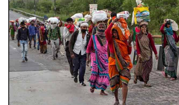
ତେଲେଜୀନା ଓ ଫେରନ୍ତାକ ଦେହରେ କୋଭିଡ଼ର ତୃତୀୟ ମୁଖ୍ୟ ଠାକ କରାଯାଇଛି । ତେଣୁ ସେଠାରୁ ଓଡ଼ିଶା ଆସୁଥିବା ବ୍ୟକ୍ତିମାନେ ନିର୍ଦ୍ଦିଷ୍ଟ ଭାବେ ୧୪ଦିନିଆ କ୍ୱାରେଣ୍ଟାଇନ୍ରେ ରହିବେ ।