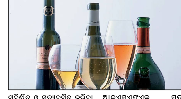
ପୁନିର୍ଣ୍ଣିତ ଓ ସୁବ୍ୟବସ୍ଥିତ କରିବା ନିମନ୍ତେ କୋଭିଡ଼ ଗାଇଡଲାଇନ୍ ଅନୁସାରେ ମଦ ନିଗମର ଗୋଦାମଗୁଡ଼ିକ କାର୍ଯ୍ୟ କରିବ । ଅବକାରୀ ବିଭାଗ ପୁରୁଣୁ ମିଳିଥିବା ସୂଚନା ଅନୁସାରେ, ସର୍ବ ଲାଭସେବୁଧାରୀଙ୍କ ଦ୍ୱାରା ଲକ୍ଷ୍ମଣପୁରରେ ବିକ୍ରି ଯାଇ ଥିବା

ଭୁବନେଶ୍ୱର, ୫/୫ (ନି.ପ୍ର): ରାଜ୍ୟରେ କୋଭିଡ଼ ସଂକ୍ରମଣ ମାମଲା ଦୃଷ୍ଟି ଦୃଷ୍ଟିରେ ରଖି ଆସନ୍ତାକାଲିଠାରୁ ରାଜ୍ୟବ୍ୟାପୀ ୧୫ଦିନିଆ ଲକ୍ଷ୍ମଣପୁର ଆରମ୍ଭ ହେବ । ତେବେ ଏହି ଲକ୍ଷ୍ମଣପୁରରେ ମଦ ଦୋକାନ ବନ୍ଦ ରହିଲେ ବି ଲୋକମାନେ ଚାହିଁଲେ ହୋମ୍ ଡେଲିଭରିରେ ମଦ ମଗାଇ ପାରିବେ । ଲକ୍ଷ୍ମଣପୁରରେ ମଦ ଦୋକାନ ବନ୍ଦ ରହିଲେ ବି ଲୋକମାନେ ଚାହିଁଲେ ହୋମ୍ ଡେଲିଭରିରେ ମଦ ମଗାଇ ପାରିବେ । ଲକ୍ଷ୍ମଣପୁରରେ ମଦ ଦୋକାନ ବନ୍ଦ ରହିଲେ ବି ଲୋକମାନେ ଚାହିଁଲେ ହୋମ୍ ଡେଲିଭରିରେ ମଦ ମଗାଇ ପାରିବେ । ଲକ୍ଷ୍ମଣପୁରରେ ମଦ ଦୋକାନ ବନ୍ଦ ରହିଲେ ବି ଲୋକମାନେ ଚାହିଁଲେ ହୋମ୍ ଡେଲିଭରିରେ ମଦ ମଗାଇ ପାରିବେ । ଲକ୍ଷ୍ମଣପୁରରେ ମଦ ଦୋକାନ ବନ୍ଦ ରହିଲେ ବି ଲୋକମାନେ ଚାହିଁଲେ ହୋମ୍ ଡେଲିଭରିରେ ମଦ ମଗାଇ ପାରିବେ ।