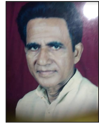
ଜ୍ଞାନ ଭିତ୍ତିକ ଶିଶୁ ସାହିତ୍ୟ ବିଶେଷତଃ ଭାରତୀୟ ରଖି ବିଜ୍ଞାନୀକ ଉପରେ ଏଭଳି କୋଷ ପ୍ରଥମ ପ୍ରକାଶ ।