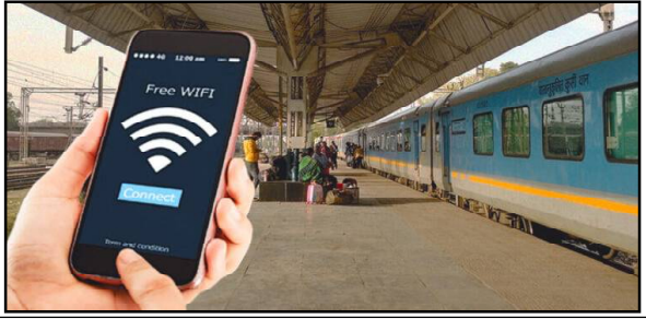
ଓଡ଼ିଶାର ୨୩୨ ଷ୍ଟେସନରେ ଖୁଲିଯାଇ ସୁବିଧା ଉପଲବ୍ଧ ହୋଇଛି ।

ଭୁବନେଶ୍ୱର, ୧୭/୫ (ନି.ପ୍ର): ଦେଶର ୬ ହଜାର ରେଳ ଷ୍ଟେସନରେ ଖୁଲିଯାଇ ସୁବିଧା ଉପଲବ୍ଧ ହୋଇଛି । ୨୦୧୬ରୁ ଆରମ୍ଭ ହୋଇଥିବା ଏହି ସୁବିଧା ୫ ବର୍ଷ ମଧ୍ୟରେ ଏକାଧିକ ସଫଳତା ହାସଲ କରିଛି । ଛାତ୍ରଛାତ୍ରୀଙ୍କୁ ହଜାରିଗଣ ଟାଉନ ଷ୍ଟେସନରେ ଗଡକାଲି ଖୁଲିଯାଇ ସୁବିଧା ହେବା ସହ ୬ ହଜାର ମାଇଲ୍ ଖୁଣ୍ଟ ହାସଲ କରିଛି । ୫୯୯୯୯୯୯୯ ଷ୍ଟେସନ ଭାବେ ଅନୁମୋଦିତ କରାଯାଇ ଷ୍ଟେସନରେ ଗଡକାଲି ଯାତ୍ରୀଙ୍କୁ ଏହି ସୁବିଧା ଯୋଗାଇ ଦିଆଯାଇଛି । ଏହାକୁ ମିଶାଇ ଓଡ଼ିଶାର ୨୩୨ଟି ଷ୍ଟେସନରେ ଖୁଲିଯାଇ ସୁବିଧା ହୋଇଛି । ମହାରାଷ୍ଟ୍ରରେ ସର୍ବାଧିକ ୫୫୦ ରେଳ ଷ୍ଟେସନରେ ଯାତ୍ରୀମାନେ ମାଗଣାରେ ଖୁଲିଯାଇ ପାଇ ପାରୁଛନ୍ତି । ଏହା ତଳକୁ ଆଣ୍ଡ୍ର ପ୍ରଦେଶର ୫୦୯ ଷ୍ଟେସନକୁ ଖୁଲିଯାଇ କରାଯାଇଛି ।