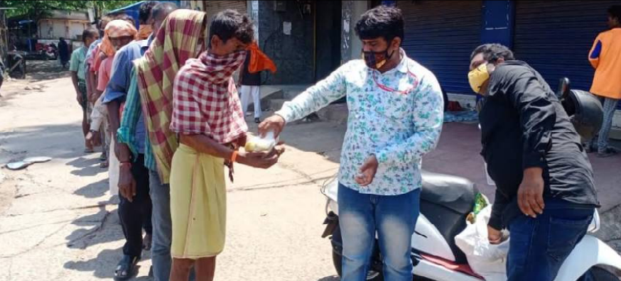
ନେତୃତ୍ୱରେ ମଇ ମାସ ୬ ତାରିଖ ଠାରୁ ରାଜଧାନୀରେ ଗରିବ ଓ ନିରାଶ୍ରୟ ଲୋକମାନଙ୍କୁ ଶୁଖିଲା ଓ ବନ୍ଧୁକ ବଣ୍ଟନ କରାଯାଇ କରାଯାଇ କରୋନାରୁ ରକ୍ଷା ପାଇବା ପାଇଁ ଲୋକମାନଙ୍କୁ ସଚେତନ କରାଯାଇଛି ।

ଭୁବନେଶ୍ୱର, ୧୭/୫ (ନି.ପ୍ର): ମହାମାରୀ କରୋନା ସମଗ୍ର ଦେଶ ତଥା ରାଜ୍ୟରେ ଦିନକୁ ଦିନ ତାର କାୟା ବିସ୍ତାର କରି ଚାଲିଛି । କରୋନା କରାଳ ରୂପରେ ବହୁ ଲୋକଙ୍କୁ ଲୀନ କରି ଦେଇଥିବା ବେଳେ ଏଥିରୁ ରକ୍ଷା ପାଇବା ପାଇଁ ଲୋକମାନେ ଏକ ପ୍ରକାର ଅଧିକାରୀ ମନେ କରୁଛନ୍ତି । ଲୋକମାନେ ନିଜର ଜୀବନ ଜୀବିକା ହରାଇଥିବା ବେଳେ ଆର୍ଥିକ ମେରୁବନ୍ଧୁ ବୋହାଳି ଯାଇଛି । ପରିବାରର ପ୍ରତିପୋଷଣ ପାଇଁ ଲୋକମାନେ ସଂଘର୍ଷ କରୁଥିବା