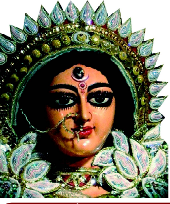
ସା ଦେବୀ ସର୍ବଭୂତେଷୁ.....