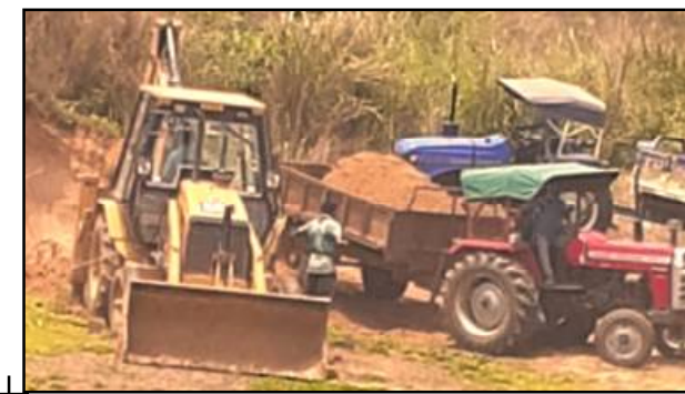
ବାଲିଆପାଳ, ୨୧/୦୪ (ନି.ପ୍ର): ବାଲିଆପାଳ ବ୍ଲକ୍ରେ ଦିନକୁ ଦିନ ମାଟି ମାଫିଆ ସକ୍ରିୟ ହେଉଅଛି । ବିଭିନ୍ନ ନଦୀ ପାଠା, ସରକାରୀ ଜାଗା, ବ୍ୟକ୍ତିଗତ ଜମିକୁ ହଜାର ହଜାର ଟ୍ରିପ ମାଟି କେସିବି ଲଗାଇ ଖୋଳି ନେଇ ମାଲୋମାଲ ହେଉଅଛି । ପ୍ରଶାସନ ସବୁ ଜାଣି ମଧ୍ୟ ନୀରବଦୃଷ୍ଟି ସାଜିଛି । ବାଲିଆପାଳ ସୁରକ୍ଷା ପହଞ୍ଚେ ପହଞ୍ଚେ ଥିବା ଇଡକୋ ଜମିକୁ ମାଟି ଖୋଳି ଯୋଗାଇ ଦିଆଯାଇଛି ।

ସରକାରୀ ଜାଗାରୁ ଖୋଳି ନେଉଛନ୍ତି ଶହ ଶହ ଟ୍ରିପ ମାଟି । ବାଲିଆପାଳ, ୨୧/୦୪ (ନି.ପ୍ର): ବାଲିଆପାଳ ବ୍ଲକ୍ରେ ଦିନକୁ ଦିନ ମାଟି ମାଫିଆ ସକ୍ରିୟ ହେଉଅଛି । ବିଭିନ୍ନ ନଦୀ ପାଠା, ସରକାରୀ ଜାଗା, ବ୍ୟକ୍ତିଗତ ଜମିକୁ ହଜାର ହଜାର ଟ୍ରିପ ମାଟି କେସିବି ଲଗାଇ ଖୋଳି ନେଇ ମାଲୋମାଲ ହେଉଅଛି । ପ୍ରଶାସନ ସବୁ ଜାଣି ମଧ୍ୟ ନୀରବଦୃଷ୍ଟି ସାଜିଛି । ବାଲିଆପାଳ ସୁରକ୍ଷା ପହଞ୍ଚେ ପହଞ୍ଚେ ଥିବା ଇଡକୋ ଜମିକୁ ମାଟି ଖୋଳି ଯୋଗାଇ ଦିଆଯାଇଛି ।