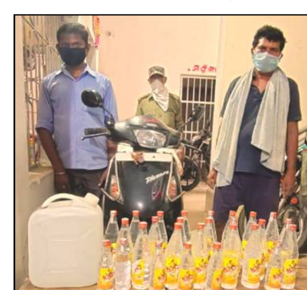
୨୦୪ ଲିଟର ପଶ୍ଚିମବଂଶ ମାର୍କା ମଦ ଜବତ୍ । ୨ ବାଇକ୍ ସହ ୬ ଗିରଫ । ପଦ୍ମାବତୀ ନଦୀ ଉପକୂଳରେ ୨୦୪ ଲିଟର ପଶ୍ଚିମବଂଶ ମାର୍କା ମଦ ଜବତ୍ । ୨ ବାଇକ୍ ସହ ୬ ଗିରଫ ।

ବାଲେଶ୍ୱର, ୨୧/୪ (ନି.ପ୍ର): ଓଡ଼ିଶା ଓ ପଶ୍ଚିମବଂଶ ଉପକୂଳ ଅଂଳରେ ବହୁ ଦେଖାଯାଇଥିବା ପଦ୍ମାବତୀ ନଦୀ ଉପକୂଳରେ ୨୦୪ ଲିଟର ପଶ୍ଚିମବଂଶ ମାର୍କା ମଦ ଜବତ୍ । ୨ ବାଇକ୍ ସହ ୬ ଗିରଫ । ପଦ୍ମାବତୀ ନଦୀ ଉପକୂଳରେ ୨୦୪ ଲିଟର ପଶ୍ଚିମବଂଶ ମାର୍କା ମଦ ଜବତ୍ । ୨ ବାଇକ୍ ସହ ୬ ଗିରଫ ।