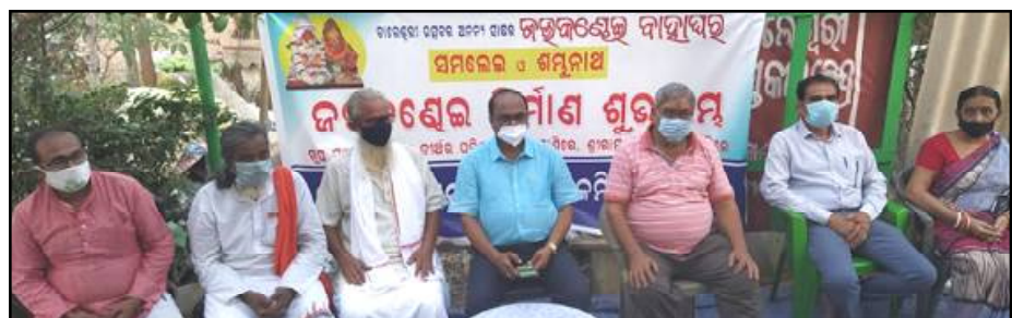
ରତନ ପୂର୍ଣ୍ଣିମାରେ ଲଗ୍ନଧାରା ଓ ଲୋକକଳା, ଲୋକସଂସ୍କୃତି, ଲୋକଗୀତ, ଲୋକକଥା, ଲୋକସାହିତ୍ୟ ଓ ଲୋକପରମ୍ପରାର ଅଧିକାରୀ ଲୋକକଳା କଉଡ଼ିଏ ଲୋକମାନଙ୍କୁ ଜଉକଣ୍ଠେଇ ବାହାରିବ । ଲୋକକଳା କଉଡ଼ିଏ ଲୋକମାନଙ୍କୁ ଜଉକଣ୍ଠେଇ ବାହାରିବ ।