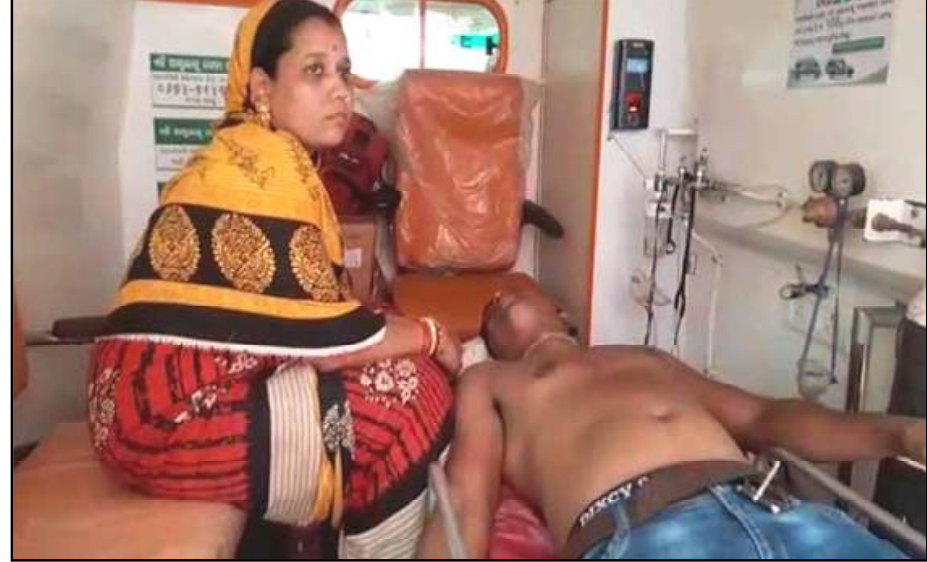
ସେମାନଙ୍କୁ ନିକଟସ୍ଥ ତେଲଙ୍ଗ ନେତୃକାଳରେ ଭର୍ତ୍ତି କରାଯିବ । ସହିତ ଚିକିତ୍ସା କାରି ରହିଛି । ପରେ ଏମସ୍ତୁ ସ୍ଥାନାନ୍ତର କରାଯାଇଥିବାର ଜଣାଯାଇଛି । ଅନ୍ୟପକ୍ଷରେ ଏହି ଘଟଣାର ପ୍ରତିବାଦରେ ବିଜେପି ପକ୍ଷରୁ କର୍ମୀମାନେ ଶତାଧିକ ସଂଖ୍ୟାରେ ହାଟ ତେଲଙ୍ଗ ଥାନା ସମ୍ମୁଖରେ ଧାରଣା ଦେଇ ରାସ୍ତା ଅବରୋଧ କରିଛନ୍ତି । ସମ୍ପୂର୍ଣ୍ଣ ଅଂଚଳରେ ଉତ୍ତେଜନା ପରିସ୍ଥିତି ଲାଗିରହିଛି ।

ପିପିଲି, ୧୧/୦୪ (ନି.ପ୍ର) : ପିପିଲି ପ୍ରଚାର ବେଳେ ହିଂସା । ପୁରୀ ଜେନାପୁର ପଂଚାୟତ ଗ୍ରାମପଞ୍ଚାୟତ ପ୍ରଚାର ବାଲିଥିଲାବେଳେ ବିଜେଡି କର୍ମୀଙ୍କ ଆକ୍ରମଣରେ ବିଜେପିର ଚିନିକଣ କର୍ମୀ ଆହତ ହୋଇଛନ୍ତି । ଉପ ନିର୍ବାଚନକୁ ନେଇ ପିପିଲି ରାଜନୀତି ସରଗରମ ରହିଥିବାବେଳେ ଆଜି ତେଲଙ୍ଗରେ ଦେଖିବାକୁ ମିଳିଛି ନିର୍ବାଚନୀ ହିଂସା । ପ୍ରଚାରବେଳେ ଆଜି ଦୁଇ ଗୋଷ୍ଠୀର କିଛି ଲୋକ ମୁହାଁମୁହିଁ ହୋଇଛନ୍ତି । ଫଳରେ ସ୍ଥାନୀୟ ଅଂଚଳରେ ଉତ୍ତେଜନାପୂର୍ଣ୍ଣ ସ୍ଥିତି ଦେଖିବାକୁ ମିଳିଛି । ଜେନାପୁର ଗ୍ରାମପଞ୍ଚାୟତ ଅଂଚଳରେ ଦୁଇ ଗୋଷ୍ଠୀଙ୍କ ଭିତରେ ମଧ୍ୟରେ ଧସାଧସ ହୋଇଛି । ଯେଉଁଥିରେ ୩ ଜଣ ଆହତ ହେବାପରେ