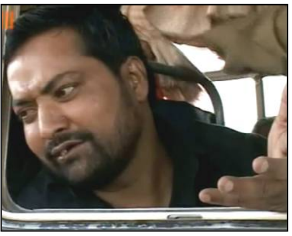
ପୋଲିସ ଡିଜିଟାଲ ଅଧିକାରୀରେ ବୈଠକ ପରେ, କ୍ରାଇମବ୍ରାଂଚ ଏଡିଜି କହିଛନ୍ତି ରାଜ୍ୟର ସମସ୍ତ ଏସପିମାନଙ୍କୁ ସତର୍କ କରାଇ ଦିଆଯାଇଛି । ଏଡିଜି ହାଇଦରକୁ ଧରିବା ପ୍ରକ୍ରିୟାରେ ସାମିଲ ହୋଇଛନ୍ତି । ଖୁବଶୀଘ୍ର ଧରାପଡ଼ିଯିବ ହାଇଦର । ଗ୍ୟାଙ୍ଗଷ୍ଟର ହାଇଦର ଏକ ସାଧାରଣ ଅପରାଧୀ ନଥିଲା । ତେଣୁ ଯେଉଁସବୁକି ଅବଲମ୍ବନ କରାଯିବ ଉଚିତ ଥିଲା, ତାହା କରାଯାଇନଥିବ । ସଞ୍ଚଳ ଶାସ୍ତ୍ରପୁସ୍ତିକ । ଉପହେଉଛି ସେହି ଗ୍ୟାଙ୍ଗଷ୍ଟର ହାଇଦର, ସେହି ଦୁର୍ଭିତ ।

ଭୁବନେଶ୍ୱର, ୧୧/୦୪ (ନି.ପ୍ର) : ପୋଲିସ ଆଖିରେ ଧିକି ଦେଇ ଫେରାର ହୋଇଯାଇଥିବା ଗ୍ୟାଙ୍ଗଷ୍ଟର ହାଇଦରକୁ ଧରିବା ପାଇଁ ପୋଲିସର ତନାଘନା । ଭୁବନେଶ୍ୱର ରେଳ ଷ୍ଟେସନରେ ମୋବାଇଲରେ ହାଇଦରର ଫଟୋ ଦେଖାଇ ପୋଲିସ । ପୋଲିସ କର୍ମଚାରୀ ଏବଂ ସାଦା ପୋଷାକଦାରି ଅଧିକାରୀ ହାଇଦର ଫଟୋ ଦେଖାଇ ଦୋକାନୀ, କୁଲି ଓ ସାଧାରଣ ଲୋକଙ୍କୁ ପଚାରିଛନ୍ତି । କାରଣ ପୋଲିସ ଆଶଙ୍କା କରୁଛି, ହାଇଦର ଟ୍ରେନ କିମ୍ବା ବସ ଯୋଗେ ଏରିଆରୁ ପାର ହୋଇଯାଇଥାଇପାରେ । କୁହାଯାଉଛି ଗ୍ୟାଙ୍ଗଷ୍ଟର ହାଇଦରକୁ ଧରିବା ପାଇଁ ପୋଲିସ ଆରମ୍ଭ କରିବାକୁ ଧରାପଡ଼ିଯିବ ହାଇଦର ।