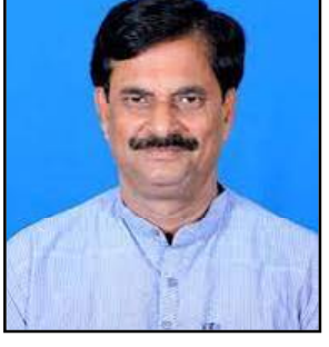
ପରୀକ୍ଷା ପୂର୍ବରୁ କିମ୍ବା ଦେଉଥିବା ସମୟରେ ଛାତ୍ରଛାତ୍ରୀ କୋଭିଡ ଆକ୍ରାନ୍ତ ହେଲେ ସେମାନଙ୍କୁ ବିକଳ ବ୍ୟବସ୍ଥା କରିଆରେ ମାର୍କ ଦେବାକୁ ବିବିଏସର ନିଷ୍ପତ୍ତି ନେଇଛି । ମହାମାରୀ ସମୟରେ

ଭୁବନେଶ୍ୱର, ୧୧/୦୪ (ନି.ପ୍ର) : ଆସନ୍ତା ଏପ୍ରିଲ ୩୦ ପରେ ନବମ ଶ୍ରେଣୀ ପରୀକ୍ଷା ନିଷ୍ପତ୍ତି । ସୂଚନା ଦେଲେ ଗଣଶିକ୍ଷା ମନ୍ତ୍ରୀ । ସେ କହିଛନ୍ତି, ସରକାର ତାହା ନିବନ୍ଧନ ଶ୍ରେଣୀ ଛାତ୍ରଛାତ୍ରୀମାନେ ବାର୍ଷିକ ପରୀକ୍ଷା ଦିଅନ୍ତୁ । ସରକାର ମଧ୍ୟ ପ୍ରସ୍ତୁତ ଅଛନ୍ତି । କିନ୍ତୁ କରୋନା ପାଇଁ ଏପ୍ରିଲ ୩୦ ଯାଏ ବନ୍ଦ ରହିଛି ପାଠପଢ଼ା । ନବମ ଶ୍ରେଣୀର କୋର୍ସ ପ୍ରାୟତଃ ଶେଷ ହୋଇଛି । ସବୁ କୋର୍ସ ସରିବ । ୩୦ ପରେ ଦ୍ୱିତୀୟ ଲହରୀର ସ୍ଥିତି ଦେଖି ପରୀକ୍ଷା ନିଷ୍ପତ୍ତି ନିଆଯିବ ।