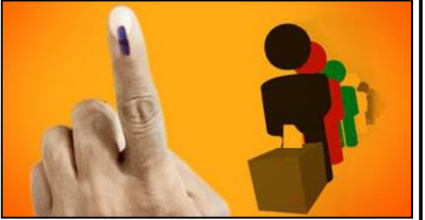
ମଙ୍ଗଳବାର ଭୋଟ ପଡ଼ିଥିବା ପକ୍ଷିମକ୍ଷର ୩୧୯ଟି ଆସନରେ ତୃଣମୁଳ କଂଗ୍ରେସର ଦବଦବା ରହିଛି । ପକ୍ଷିମକ୍ଷରେ ତୃତୀୟ ପର୍ଯ୍ୟାୟ ମତଦାନ ପକ୍ଷିମକ୍ଷର ୩୧୯ଟି ଆସନ ପାଇଁ ପଡ଼ିଛି ଭୋଟ । ପକ୍ଷିମକ୍ଷ ଓ ଆସାମରେ ତୃତୀୟ ପର୍ଯ୍ୟାୟ ମତଦାନ, ଦକ୍ଷିଣ ୨୪ ପ୍ରଗଣାର ୧୬, ହାଡ଼ୱାର ୭ ଓ ହୁଗଲିର ୮ଟି ଆସନରେ ଭୋଟ, ୨୦୫ ଜଣ ପ୍ରାର୍ଥୀଙ୍କ ଭାଗ୍ୟ ନିର୍ଦ୍ଧାରଣ କରିବେ ପ୍ରାୟ ୭୮ଲକ୍ଷ ୫୦ହଜାର ଭୋଟର, ଏହି ପର୍ଯ୍ୟାୟରେ ୧୦ ହଜାର ୮୭୧

ଭୁବନେଶ୍ୱର, ୦୭/୦୪ (ନି.ପ୍ର): ଦେଶର ୪ଟି ରାଜ୍ୟ ଓ ଗୋଟିଏ କେନ୍ଦ୍ର ଶାସିତ ଅଂଚଳ ପାଇଁ ଚାଲିଥିବା ନିର୍ବାଚନରେ ମଙ୍ଗଳବାର ସବୁଠୁ ବଡ଼ ପର୍ଯ୍ୟାୟ ଭୋଟ ପଡ଼ିଛି । ମୋଟ ୪୭୫ ଆସନ ପାଇଁ ପଡ଼ିଛି ଭୋଟ । ପକ୍ଷିମକ୍ଷ ଓ ଆସାମରେ ତୃତୀୟ ପର୍ଯ୍ୟାୟ ଭୋଟ, ପଡ଼ୁଥିବା ବେଳେ, ତାମିଲନାଡୁ, କେରଳ ଓ ପୁଡୁଚେରୀରେ ଗୋଟିଏ ତଥା ତୃତୀୟ ପର୍ଯ୍ୟାୟରେ ମତଦାନ ହୋଇଛି । ପକ୍ଷିମକ୍ଷରେ ତୃତୀୟ ପର୍ଯ୍ୟାୟ ମତଦାନ ପକ୍ଷିମକ୍ଷର ୩୧୯ଟି ଆସନ ପାଇଁ ପଡ଼ିଛି ଭୋଟ । ପକ୍ଷିମକ୍ଷ ଓ ଆସାମରେ ତୃତୀୟ ପର୍ଯ୍ୟାୟ ମତଦାନ, ଦକ୍ଷିଣ ୨୪ ପ୍ରଗଣାର ୧୬, ହାଡ଼ୱାର ୭ ଓ ହୁଗଲିର ୮ଟି ଆସନରେ ଭୋଟ, ୨୦୫ ଜଣ ପ୍ରାର୍ଥୀଙ୍କ ଭାଗ୍ୟ ନିର୍ଦ୍ଧାରଣ କରିବେ ପ୍ରାୟ ୭୮ଲକ୍ଷ ୫୦ହଜାର ଭୋଟର, ଏହି ପର୍ଯ୍ୟାୟରେ ୧୦ ହଜାର ୮୭୧