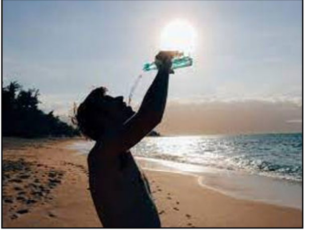
ସୂଚନା ଦେଇଛି । ପାଣିପାଗ କେନ୍ଦ୍ରର ସୂଚନା ଅନୁଯାୟୀ, ବୁଧବାର ଓ ଗୁରୁବାର ଦୁଇ ଦିନ ରାଜ୍ୟରେ ପାଗ ମୁଖ୍ୟତଃ ଶୁଖିଲା ରହିବ । ୮ ତାରିଖରୁ ୯ ତାରିଖ ମଧ୍ୟରେ ଝାରସୁଗୁଡ଼ା, ସୁନ୍ଦରଗଡ଼, ଦେବଗଡ଼, କେନ୍ଦୁଝର, ମୟୂରଭଞ୍ଜ, ଯାଜପୁର, ଗଞ୍ଜାମ, କନ୍ଧମାଳ ଓ ମାଲକାନଗିରି ଜିଲ୍ଲାର ଗୋଟିଏ କିମ୍ବା ଦୁଇଟି ସ୍ଥାନରେ ବହୁତାତ ସହ କାଳବୈଶାଖୀ କନିତ ବର୍ଷା ହେବାର ।

ଭୁବନେଶ୍ୱର, ୦୭/୦୪ (ନି.ପ୍ର): ଆସନ୍ତାକାଲି (ବୁଧବାର)ଠାରୁ ରାଜ୍ୟରେ ପୁଣି ତାତି ବଢ଼ିବ । ୨/୩ ଦିନ ପର୍ଯ୍ୟନ୍ତ ରାଜ୍ୟରେ ଦିନର ତାପମାତ୍ରା ୨୯ ଓ ୩୨ ଡିଗ୍ରୀ ପର୍ଯ୍ୟନ୍ତ ବଢ଼ିବ । ଅଧିକାଂଶ ସ୍ଥାନର ତାପମାତ୍ରା ୪୦ ଡିଗ୍ରୀ ଅତିକ୍ରମ କରିବ । ବିଶେଷ କରି ସୁନ୍ଦରଗଡ଼, ଝାରସୁଗୁଡ଼ା, ସମ୍ବଲପୁର, ଦେବଗଡ଼, ଅନୁଗୁଳ, ସୁବର୍ଣ୍ଣପୁର, ବୌଦ୍ଧ, ବରଗଡ଼, ବଲାଙ୍ଗୀର, ତୁଆପଡ଼ା ଓ ନରବଙ୍ଗପୁର ଜିଲ୍ଲାରେ ତାପମାତ୍ରା ୪୦ ଡିଗ୍ରୀ ପାର୍ କରିବ । ତେବେ ୮ ତାରିଖରୁ ୧୧ ତାରିଖ ମଧ୍ୟରେ ରାଜ୍ୟର ବିଭିନ୍ନ ସ୍ଥାନରେ ବହୁତାତ, କାଳବୈଶାଖୀ ବର୍ଷା ସହ ପୂର୍ଣ୍ଣସ୍ତର ସମାବନା ରହିଛି । ଭୁବନେଶ୍ୱରସ୍ଥିତ ଆଂତର୍ଜାତୀୟ ପାଣିପାଗ ବିଜ୍ଞାନ କେନ୍ଦ୍ର ଏହି