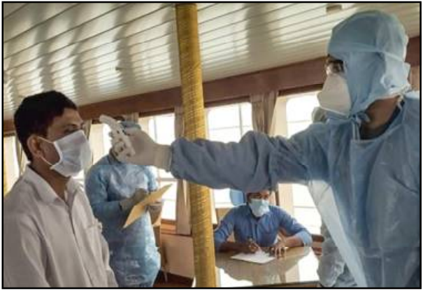
ତେବେ ଆଗକୁ ଟିକାକରଣ ବାଧାପ୍ରାପ୍ତ ହେବର ସମାବନା ରହିଛି । ତେଣୁ ପୁଣି ଥରେ ଆମେ କେନ୍ଦ୍ର ସରକାରଙ୍କୁ ଚିଠି ଲେଖୁ । ଗତକାଲି ୨ ଲକ୍ଷ ୬୩ହଜାର ୪୧ ଟିକାକରଣ ହୋଇଛି । ପ୍ରତିଦିନ ୨ ଲକ୍ଷ ଟିକାକରଣର ଚାର୍ଜେଟ୍ ରହିଥିଲା । ୫ ଦିନରେ ୧୦ ଲକ୍ଷ ଚାର୍ଜେଟ୍ ଥିବା ବେଳେ ଏହା ୧୧ଲକ୍ଷ ପାର କରିଛି । ରାଜ୍ୟରେ ବର୍ତ୍ତମାନ ୩ଲକ୍ଷ ୪୭ହଜାର କୋଭିଡ଼ଲକ୍ଷ ଟିକା ମାହକୁଡ଼ ଅଛି । ହିଟ୍‌ଡେଜ୍ ପାଇଁ ଟିକାକରଣ ସମୟରେ ପରିବର୍ତ୍ତନ କରାଯାଇଛି ।