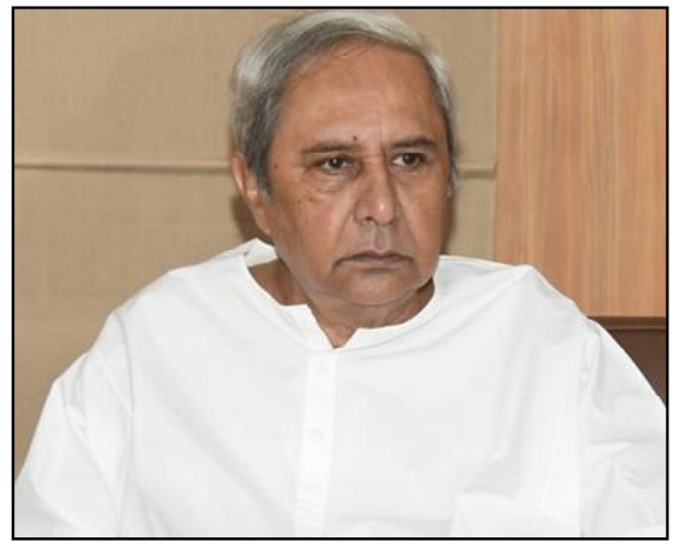
ଜିଲ୍ଲାମାନଙ୍କରେ ଅଧିକ ତାହଲ, ପାରାମେଡ଼ିକାଲ ସ୍ତ୍ରୀ, ସ୍ତ୍ରୀକର୍ମୀ ନିୟୁତ ଦେବା ସହ ଅଧିକ ଆୟୁଲାନସ୍, ବେଡ୍, ଲ୍ୟାବ୍ ବେକ୍ଟିଭିଆନ୍ ଯୋଗାଇ ଦେବା ପାଇଁ ନିର୍ଦ୍ଦେଶରେ ମୁଖ୍ୟମନ୍ତ୍ରୀ କହିଛନ୍ତି । ଏସବୁ ସୁବିଧା ଯୋଗାଇଦେବା କ୍ଷେତ୍ରରେ ଯେଉଁ

ଭୁବନେଶ୍ୱର, ୦୭/୦୪ (ନି.ପ୍ର): କରୋନା ସଂକ୍ରମଣକୁ ହ୍ରାସ କରିବା ପାଇଁ ରାଜ୍ୟରେ ଅଧିକ ପୋଲିସ୍ ମୁତୟନ କରିବା ସହ ୧୦ ଦିନ ପାଇଁ ସ୍ୱଚ୍ଛ ଅଭିଯାନ ଚଳାଇବାକୁ ମୁଖ୍ୟମନ୍ତ୍ରୀ ପୋଲିସ୍ ମହାନିର୍ଦ୍ଦେଶକଙ୍କୁ ନିର୍ଦ୍ଦେଶ ଦେଇଛନ୍ତି । ସେହିପରି ଛତିଶଗଡ଼ ସୀମାନ୍ତରେ ଥିବା ରାଜ୍ୟର ପକ୍ଷିମାଂଚଳ ଜିଲ୍ଲାମାନଙ୍କରେ କରୋନା ରୋଗ ସଂକ୍ରମଣ ବ୍ୟାପୁଥିବାରୁ ଗାଁ ଉପରେ ଅନୁଧ୍ୟାନ କରିବା ପାଇଁ ସମ୍ପୂର୍ଣ୍ଣ ଜିଲ୍ଲାମାନଙ୍କୁ ଗନ୍ତର ଯିବା ପାଇଁ ମୁଖ୍ୟ ଶାସନ ସଚିବ, ଅତିରିକ୍ତ ମୁଖ୍ୟ ଶାସନ ସଚିବ ଓ ଅନ୍ୟାନ୍ୟ ବରିଷ୍ଠ ଅଧିକାରୀମାନଙ୍କୁ ନିର୍ଦ୍ଦେଶ ଦେଇଛନ୍ତି । ଏହାବ୍ୟତୀତ ଏହି