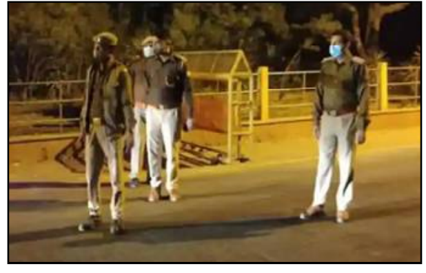
କରୋନା ସଂକ୍ରମଣକୁ ନିୟନ୍ତ୍ରଣ କରିବା ପାଇଁ ନାଇଟ୍ କର୍ଫ୍ୟୁ ଲାଗୁ କରାଯାଇଛି । ଏପ୍ରିଲ ୩୦ ଯାଏଁ ରାତିକାଳୀନ କର୍ଫ୍ୟୁ ଲାଗୁ କରାଯାଇଥିବାବେଳେ ରାତି ୧୦ଟାରୁ ସକାଳ ୫ଟା ଯାଏଁ ନାଇଟ୍ କର୍ଫ୍ୟୁ ଲାଗୁ କରାଯାଇଛି । ସୂଚନା

ଦିଲ୍ଲୀ, ୦୭/୦୪ (ନି.ପ୍ର): ଦେଶରେ କାନ୍ଦା ମେଲାଇଛି କରୋନା ସଂକ୍ରମଣ । ୨୪ ଘଣ୍ଟା ଭିତରେ ୯୬ହଜାର ୯୮୨ ନୂଆ ଆକ୍ରାନ୍ତ ଚିହ୍ନଟ ହୋଇଛନ୍ତି । ସେହିପରି ୨୪ ଘଣ୍ଟା ମଧ୍ୟରେ କରୋନା କାରଣରୁ ୪୪୬୫୫ ଜଣଙ୍କ ମୃତ୍ୟୁ ହୋଇଛି । ଆଜିର ଆକ୍ରାନ୍ତଙ୍କୁ ମିଶାଇ ଦେଶରେ ମୋଟ ଆକ୍ରାନ୍ତଙ୍କ ସଂଖ୍ୟା ଏକ କୋଟି ୨୬ଲକ୍ଷ ୮୬ହଜାର ୪୯୯୯୯ ହୋଇଛି । ଏମାନଙ୍କ ଭିତରୁ ଏକ କୋଟି ୧୭ଲକ୍ଷ ୩୨ହଜାର ୭୭୯୯୯ ଜଣ ସୁସ୍ଥ ହୋଇଛନ୍ତି । ଏବେ ଦେଶରେ ୭ଲକ୍ଷ ୮୮ହଜାର ୨୨୨୩୫୫ ସକ୍ରିୟ ସଂକ୍ରମିତ ଅଛନ୍ତି । ସର୍ବାଧିକ ଆକ୍ରାନ୍ତ ସଂଖ୍ୟା ତାଲିକାରେ ଏବେ ବି ମହାରାଷ୍ଟ୍ର ଆଗରେ ରହିଛି । ଅନ୍ୟପଟେ ଦିଲ୍ଲୀରେ ବହୁଥିବା