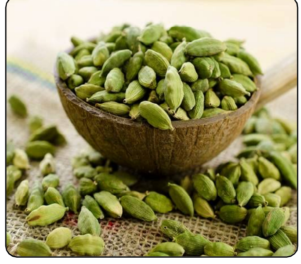
ନୂଆଗଜଡ଼ା ଦୂର କରିବାରେ ସହାୟକ ହୁଏ- ଗୁଜୁରାତି କାମୋଡେକକ ହୋଇଥାଏ । ଏହା ନୂଆଗଜଡ଼ା ଦୂର କରିବାରେ ସହାୟକ ହୋଇଥାଏ ।

ରକ୍ତଚାପ ନିୟନ୍ତ୍ରଣ କରେ: ଗୁଜୁରାତି ଖାଇବା ଦ୍ୱାରା ରକ୍ତଚାପ ନିୟନ୍ତ୍ରିତ ରୁହେ । ଏଥିରେ ଥିବା ପୋଟାଶିୟମ, ମାଗ୍ନେସିୟମ ରକ୍ତଚାପକୁ ନିୟନ୍ତ୍ରଣରେ ରଖେ ।