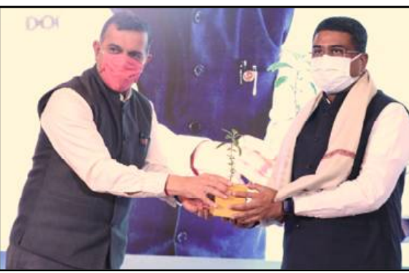
ଧର୍ମେନ୍ଦ୍ର ପ୍ରଧାନଙ୍କୁ ଭେଟିବା ପାଇଁ ଧର୍ମେନ୍ଦ୍ର ପ୍ରଧାନଙ୍କୁ ଭେଟି ଦେଇଛନ୍ତି କେନ୍ଦ୍ରମନ୍ତ୍ରୀ ।

ନୂଆଦିଲ୍ଲୀ/ଭୁବନେଶ୍ଵର, ୧୬/୦୩ (ନି.ପ୍ର): ନୂଆଦିଲ୍ଲୀଠାରେ ଆୟୋଜିତ ଦ୍ଵାଦଶମ ଅନ୍ ଫ୍ୟୁଏଲ ଏବଂ ଲୁବ୍ରିକାଣ୍ଟ କାର୍ଯ୍ୟକ୍ରମରେ ଯୋଗ ଦେଇଛନ୍ତି କେନ୍ଦ୍ରମନ୍ତ୍ରୀ ଧର୍ମେନ୍ଦ୍ର ପ୍ରଧାନ । ଏହି ଅବସରରେ ସେ କହିଛନ୍ତି, ଦେଶରେ ସାମାଜିକ ଓ ଆର୍ଥିକ ପରିବର୍ତ୍ତନକୁ ଦୂରାନ୍ତ କରିବାରେ ଉର୍ଦ୍ଧା ବଡ଼ ଭୂମିକା ରହିଛି । ଭବିଷ୍ୟତ ସ୍ଵାସ୍ଥୀ ଉର୍ଦ୍ଧାରେ ଭାରତର ଯାତ୍ରା ଉପରେ ମତ ଦେଇ ଧର୍ମେନ୍ଦ୍ର ପ୍ରଧାନ କହିଛନ୍ତି ଯେ ତେଜ ଏବଂ ଗ୍ୟାସ୍ କ୍ଷେତ୍ରରେ