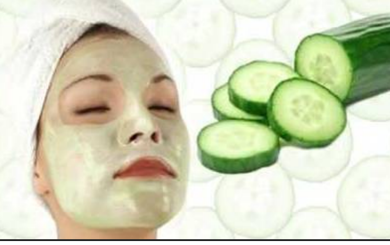
ନିମନ୍ତେ କାକୁଡ଼ି ସବୁଠୁ ଉତ୍ତମ ପ୍ୟାମ୍ ଅଟେ । କାକୁଡ଼ି ଉପ ୨ ଚାମଚରେ ଅଧ ଚାମଚ ଚିନି ୧ ଚାମଚ ଦହି ମିଶାଇ ତାହାକୁ ତୁଳା ସାହାଯ୍ୟରେ ତୃତୀୟ ଲଗାଇବେ । ୧୫ମିନିଟ୍ ପରେ ତୃତୀୟ ଧୋଇନେବେ । ଏହା ସହ ବେସନ-କାକୁଡ଼ି ଉପ ପ୍ୟାକ୍ ଲଗାଇବା ମଧ୍ୟ ତୃତୀୟ ପାଇଁ ଉତ୍ତମ ।