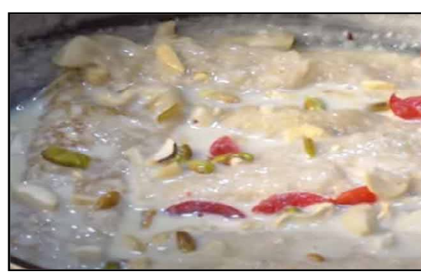
ଫୁଟାନ୍ତୁ । ଏକ ବହଳ ରସ ହେବା ପରେ କରେଇକୁ ତୁଳି ଓହ୍ଲାଇ ରଖନ୍ତୁ । ଏହାପରେ ପ୍ୟାନ୍ ?ରେ ତେଲ ଗରମ କରି ପ୍ରସ୍ତୁତ ଆଣ ଦେଇ ତା' ଉପରେ କ୍ଷୀର ଓ ଖୁଆର ପୁରକୁ ଦେଇ ପିଠାକୁ ଗଢନ୍ତୁ । ଏହାପରେ କରେଇରେ ଥିବା କ୍ଷୀର ଓ ମିଳମେଡ ବହଳ ରସରେ ଗଢ଼ା ଯାଇଥିବା ଚକୁଳି ପିଠା ପକାନ୍ତୁ । ଶେଷରେ କାଜୁ ବାଦାମ ଖଣ୍ଡ ଓ ଚେରିକୁ ପକାଇ ସଜାଇ ପରଷନ୍ତୁ ।

ଆବଶ୍ୟକ ସାମଗ୍ରୀ: ସୁଜି, ମଇଦା ଓ ଚାଉଳ, କ୍ଷୀର, ଖୁଆ, ଚିନି, ମିଳମେଡ, କାଜୁ ବାଦାମ ଖଣ୍ଡ ଓ ଚେରି, ରିଫାଇନ ତେଲ । ପ୍ରସ୍ତୁତି ପ୍ରଣାଳୀ: ପ୍ରଥମେ ସୁଜି, ମଇଦା ଓ ଚାଉଳ ତୃତୀୟ ମିଶାଇ ଏକ ଆଣ ପ୍ରସ୍ତୁତ କରି ରଖନ୍ତୁ । କ୍ଷୀରକୁ ଫୁଟାଇ ବହଳିତ କରି ସେଥିରେ ଖୁଆ ଓ ଚିନି ପକାଇ ଏକ ପୁର ପ୍ରସ୍ତୁତ କରନ୍ତୁ । ତୁଳା ଲଗାଇ ଏକ କରେଇରେ କ୍ଷୀରକୁ ଗରମ କରି ଫୁଟାନ୍ତୁ । କ୍ଷୀର ଫୁଟିବା ପରେ ଚିନି ଓ ମିଳମେଡ ପକାଇ ଭଲ ଭାବେ