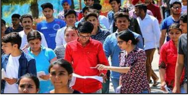
ବାଲେଶ୍ଵର, ସମ୍ବଲପୁର, ପୁରୀ ସମେତ ବିଭିନ୍ନ ସହରରେ ପରୀକ୍ଷା କରାଯାଉଛି । ରାଜ୍ୟର ପ୍ରାୟ ୩୦ ହଜାର ଛାତ୍ରଛାତ୍ରୀ ପରୀକ୍ଷା ଦେଉଛନ୍ତି । ପରୀକ୍ଷା ବେଳେ କରୋନା ଗାଢ଼ ଲାଇଫ ମାରିବା ପାଇଁ ନିର୍ଦ୍ଦେଶ ରହିଛି । ମାସ୍କ ପିନ୍ଧିବା ସହ ସାମାଜିକ ଦୂରତା ରକ୍ଷା କରିବାକୁ ଛାତ୍ରଛାତ୍ରୀଙ୍କୁ କୁହାଯାଇଛି । ଓଡ଼ିଆ ଓ ହିନ୍ଦୀ ସମେତ ୯ଟି ଆଞ୍ଚଳିକ ଭାଷାରେ ପରୀକ୍ଷା ଅନୁଷ୍ଠିତ ହେଉଛି ।

ଭୁବନେଶ୍ଵର, ୧୬/୦୩ (ନି.ପ୍ର): ଇଂଲିଶିୟର ଫାଠ୍ୟକ୍ରମରେ ନାମଲେଖା ପାଇଁ ଆଜିଠୁ ଆରମ୍ଭ ହୋଇଛି ଜେଇଇ ମେନ୍-୨ । ଦେଶର ୩୩୧ଟି ସହରରେ ପରୀକ୍ଷା କରାଯାଉଛି । ଏହା ୧୮ ତାରିଖ ପର୍ଯ୍ୟନ୍ତ ଚାଲିବ । ପ୍ରତିଦିନ ଦୁଇଟି ସିଟିରେ ହେବ ପରୀକ୍ଷା । ସକାଳ ୯ଟାରୁ ମଧ୍ୟାହ୍ନ ୧୨ଟା ପର୍ଯ୍ୟନ୍ତ ପ୍ରଥମ ସିଟି ଏବଂ ଅପରାହ୍ନ ୩ଟାରୁ ସଂଧ୍ୟା ୬ଟା ମଧ୍ୟରେ ଦ୍ଵିତୀୟ ସିଟି ପରୀକ୍ଷା ହେବ । ଓଡ଼ିଶାର ୧୭ଟି ସହରରେ ପରୀକ୍ଷା କରାଯାଉଛି । ଭୁବନେଶ୍ଵର, କଟକ, ବାଲେଶ୍ଵର, ବ୍ରହ୍ମପୁର,