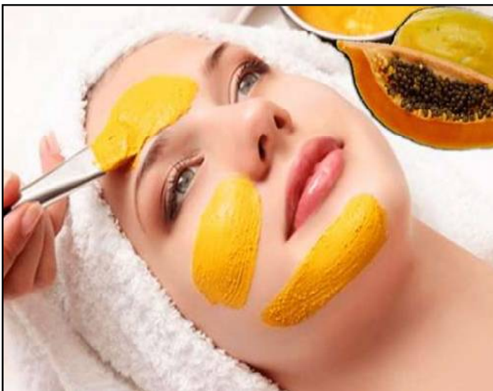
ଲେମ୍ବୁ ଫାକ:- ଲେମ୍ବୁରେ ଥିବା ଏସିଡ୍ ତତ୍ତ୍ୱ ତୃତୀୟ ପାଇଁ ଉତ୍ତମ କ୍ରିଡିଂ ପରି କାମ କରେ । କରମଦିନ ତୃତୀୟ ଚ୍ୟାନରୁ ରକ୍ଷା କରିବା ନିମନ୍ତେ ଲେମ୍ବୁ ଉପ ୩ ଚାମଚରେ ମହୁ ୧ ଚାମଚ ମିଶାଇ ତୃତୀୟ ଲଗାଇବା ଉପକାରୀ । କାକୁଡ଼ି ଫେସପ୍ୟାକ:- ତୃତୀୟ ଶୀତଳତା ପ୍ରଦାନ କରିବା

ଅନୁତତ୍ତ୍ୱ ଫେସପ୍ୟାକ:- ଅଧିକ ଅନୁତତ୍ତ୍ୱ ଘୋଷଣା ବିଶେଷ ଭାବେ ଚଳି ନିଅନ୍ତୁ । ସେଥିରେ ବେତୁ ଚାମଚ ଦହି ମିଶାଇ ତୃତୀୟ ଫାକ ଭଳି ଲଗାଇବେ । ୧୫ମିନିଟ୍ ପରେ ତୃତୀୟ ଫାକ ଧୋଇବେ । ଏହି ଫାକ ସମ୍ପୂର୍ଣ୍ଣ ଦୂର କରିବା ସହ ତୃତୀୟ ଚମକ ଆଣିଥାଏ । ଆୟତ୍ତ୍ୟାକ:- ଆୟତ୍ତ୍ୟାକ ଯୌତୁକ୍ୟ ଚର୍ଚ୍ଚାରେ ଉପଯୋଗ କଲେ ମଧ୍ୟ ଲାଭ ମିଳିଥାଏ । ପାଚିଲା ଆୟତ୍ତ୍ୟାକ ତୃତୀୟ ଫାକ ଲାଗିବେ ତାହା ବିଭିନ୍ନ ଦାଗ ଦୂର କରିବାରେ ସାହାଯ୍ୟ କରେ ପାଚିଲା ଆୟତ୍ତ୍ୟାକ ଉପ ୨ ବଡ଼ ଚାମଚ, ୧ ଚାମଚ ଗୋଲାପ ଜଳ ଓ ୨ ଚାମଚ କଞ୍ଚା ଖିରରେ ଉପଯୋଗ କରି ତାହାକୁ ତୁଳା ସାହାଯ୍ୟରେ ତୃତୀୟ ଲଗାଇ ୨୦ମିନିଟ୍ ପରେ ଧୋଇବେ । ତରତୁଳ ଫେସପ୍ୟାକ:- ଖରାରେ ଅଧିକ ସମୟ ବୁଲିଲେ ତୃତୀୟ ଗରମ ହୋଇଯାଏ । ଏହା କାରଣରୁ ତୃତୀୟ ମଳିନ ଦେଖାଯାଏ । ଏଥିରୁ ବର୍ଦ୍ଧିବା ପାଇଁ ତରତୁଳ ଉପଯୋଗ କରିବା ଲାଭ । ତରତୁଳ ଉପ ୨ ବଡ଼ ଚାମଚ, ୧ ବଡ଼ ଚାମଚ ଦହି ମିଶାଇ ତାହାକୁ ତୃତୀୟ ଫାକ ଭଳି ଲଗାନ୍ତୁ । ଏହା ତୃତୀୟ ଦୂର କରିବା ସହ ତୃତୀୟ ଉଜ୍ଜଳତା ଆଣିଥାଏ ।