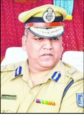
ଆଇନଶୁଖିଲା ପରିସ୍ଥିତି ସୁଧାରିବେ ବୋଲି ସେ କହିଛନ୍ତି। ଏଥିଲାଗି ସେ କଟକ-ଭୁବନେଶ୍ୱର ବାସୀଙ୍କ ସହଯୋଗ କାମନା କରିଛନ୍ତି ଏବଂ ଦୈନିକ ନଗରବାସୀଙ୍କ ଧନକ୍ଷତିରୁ ସୁରକ୍ଷାକୁ ସେ ପ୍ରାଧାନ୍ୟ ଦେବେ