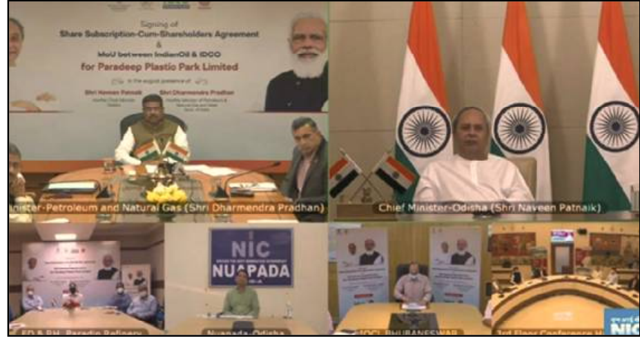
ସେହିପରି ଏହି ବୃଦ୍ଧାମଣା ପତ୍ର ପ୍ରାକ୍ଷର କାର୍ଯ୍ୟକ୍ରମରେ ଧର୍ମେନ୍ଦ୍ର ପ୍ରଧାନ ଓଡ଼ିଶାରେ ସୁବକ୍ସୁବକ୍ଷ ଲୋକଗାର ପାଇଁ ଶିକ୍ଷାଧନର ବିକାଶ ଉପରେ ଗୁରୁତ୍ୱାହାର ଦେଇଛନ୍ତି। ଏହି ବୃଦ୍ଧାମଣା ପତ୍ର ପ୍ରାକ୍ଷର କାର୍ଯ୍ୟକ୍ରମରେ ଧର୍ମେନ୍ଦ୍ର ପ୍ରଧାନ ଓଡ଼ିଶାରେ ସୁବକ୍ସୁବକ୍ଷ ଲୋକଗାର ପାଇଁ ଶିକ୍ଷାଧନର ବିକାଶ ଉପରେ ଗୁରୁତ୍ୱାହାର ଦେଇଛନ୍ତି।

ପାରାଦୀପ, ୦୯/୦୩ (ନି.ପ୍ର): ପାରାଦୀପ ପ୍ଲାଷ୍ଟିକ ପାର୍କ ବିକାଶ ପାଇଁ ମଙ୍ଗଳବାର ଆଇଓସିଏଲ ଓ ଇଡିଏଲ ମଧ୍ୟରେ ଏମ୍ପାଇର ସ୍ୱାକ୍ଷର ହୋଇଛି। ଭିଡ଼ିଓ କନଫରେନ୍ସ କରି ଆରେ ମୁଖ୍ୟମନ୍ତ୍ରୀ ନବୀନ ପଟ୍ଟନାୟକ ଏବଂ କେନ୍ଦ୍ରମନ୍ତ୍ରୀ ଧର୍ମେନ୍ଦ୍ର ପ୍ରଧାନ ଏଥିରେ ଯୋଗ ଦେଇଥିଲେ। ପ୍ରଧାନମନ୍ତ୍ରୀଙ୍କ 'ପୂର୍ବଦୀପ' ନିଗନ୍ତରେ ନିର୍ମାଣ ହେବାକୁ ଥିବା ପାରାଦୀପ ପ୍ଲାଷ୍ଟିକ ପାର୍କ ରାଜ୍ୟର ସର୍ବାଙ୍ଗୀନ ବିକାଶ ପାଇଁ ଅନେକ ସମ୍ଭାବନା ଆଣିବ ବୋଲି ଏହି ଅବସରରେ ଧର୍ମେନ୍ଦ୍ର ପ୍ରଧାନ କହିଛନ୍ତି। ରାଜ୍ୟ ସରକାର ସଂଗ୍ରାହ୍ୟ କାର୍ଯ୍ୟରେ କେନ୍ଦ୍ର ସରକାରଙ୍କ ସହଯୋଗ ତଥା ନିଜ ଦାୟିତ୍ୱ ନେଇ ପୂରଣ କଲେ ଓଡ଼ିଶାର ସର୍ବାଙ୍ଗୀନ ବିକାଶ ହେବ।