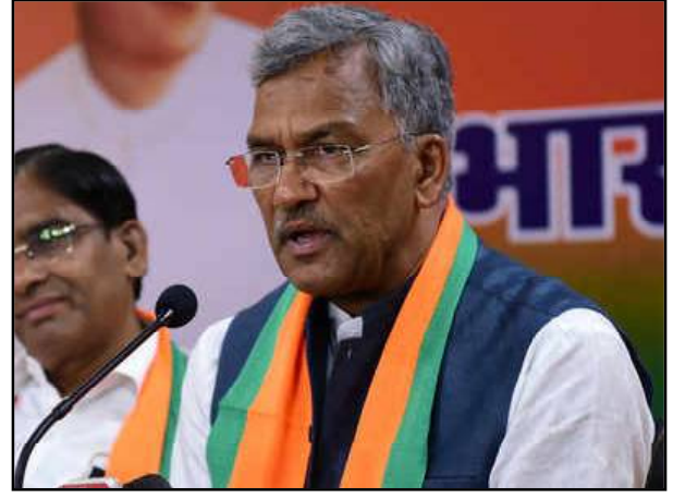
ବର୍ଷ ପାଇଁ ପାର୍ଟି ମତେ ବିଏମ୍ ଭାବେ କାର୍ଯ୍ୟ କରିବାର ଦାୟିତ୍ୱ ଦେଉଥିଲା। ଏହି ସମୟ ମଧ୍ୟରେ ଦଳ ପକ୍ଷରୁ ମତେ ବହୁତ ସମ୍ମାନ ମିଳିଛି।

ଭୁବନେଶ୍ୱର, ୦୯/୦୩ (ନି.ପ୍ର): ମୁଖ୍ୟମନ୍ତ୍ରୀ ପଦରୁ ଇସ୍ତଫା ଦେଲେ ତ୍ରିବେନ୍ଦ୍ର ସିଂ ରାଓ। ରାଜ୍ୟପାଳ ଦେବିରାଣୀ ମୈତ୍ରୀଙ୍କୁ ଦେଲେ ନିଜ ଇସ୍ତଫା ପତ୍ର। ଇସ୍ତଫା ପତ୍ର ଦେବା ପରେ ପ୍ରେସମିଟ କରି ସୂଚନା ଦେଲେ ତ୍ରିବେନ୍ଦ୍ର ସିଂ ରାଓ। ତେବେ କୁହାଯାଇଛି ଯେ ବୁଧବାରକୁ ନୂଆ ମୁଖ୍ୟମନ୍ତ୍ରୀଙ୍କ ନାଁ ଘୋଷଣା କରାଯିବ। ତେବେ କିଏ ହେବ ନୂଆ ମୁଖ୍ୟମନ୍ତ୍ରୀ ତାକୁ ନେଇ ଏବେ କହନା କହନା ଲାଗି ରହିଛି। ତ୍ରିବେନ୍ଦ୍ର ସିଂ ରାଓଙ୍କ ପ୍ରେସ କନଫରେନ୍ସ କରି କହିଛନ୍ତି, ବହୁତ ସମୟ ଧରି ରାଜନୀତି କରିଛି। ୪