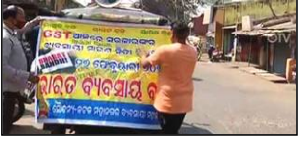
ପ୍ରତିଷ୍ଠାନ ବନ୍ଦ ରହିବାର ସମ୍ଭାବନା ୬ଟା ଯାଏଁ ବ୍ୟବସାୟିକ ରହିଛି । ଆଜି ସକାଳ ୬ରୁ ବ୍ୟାଧି

ଭୁବନେଶ୍ୱର, ୨୬/୦୨ (ନି.ପ୍ର) : ଲିଭାଏଡି, ବର୍ଷିତ ତିଳ ଦର ଏବଂ ଇ-ଡେ ବିଲ୍ ଭଳି ଏକାଧିକ ପ୍ରସଙ୍ଗ ବିରୋଧରେ ଗ୍ରେଡ୍ ସୁନିୟମ ପକ୍ଷରୁ ଭାରତ ବନ୍ଦ ଘୋଷଣା ଦିଆଯାଇଛି । ଏହି ବନ୍ଦ ଡାକରାକୁ ସମର୍ଥନ ଜଣାଇଛନ୍ତି କଟକ ନଗର ବ୍ୟବସାୟୀ ମହାଂଘ । କେବଳ କଟକ ନୁହେଁ, ଦେଶର ପ୍ରାୟ ୪୦ ହଜାର ଗ୍ରେଡ୍ ଆସୋସିଏସନ୍ ବି ଏହି ବନ୍ଦକୁ ସମର୍ଥନ ଜଣାଇଛନ୍ତି । ଫଳରେ ଆଜି ପ୍ରାୟ ୨୦ ଲକ୍ଷ ବ୍ୟବସାୟିକ