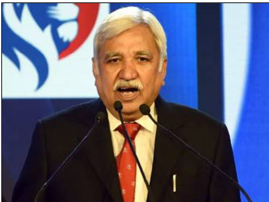
କମିଶନର ସୁନୀଲ ଅରୋରା ଏପ୍ରିଲ ୬ ତାରିଖରେ ଭୋଟ୍ ଗ୍ରହଣ ହେବ । ଏହି ଦୁଇଟି ରାଜ୍ୟ ଓ ଗୋଟିଏ କେନ୍ଦ୍ରଶାସିତ ଅଞ୍ଚଳର ଭୋଟରମାନେ ଭୋଟ୍ ଦେବା ପରେ ମେ ୨ରେ ଏହାର ଫଳାଫଳ ଘୋଷଣା ହେବ ।

ନୂଆଦିଲ୍ଲୀ, ୨୬/୦୨ (ନି.ପ୍ର) : ଦେଶର ୪ଟି ରାଜ୍ୟ ଓ ଗୋଟିଏ କେନ୍ଦ୍ରଶାସିତ ଅଞ୍ଚଳ ପାଇଁ ଘୋଷଣା ହୋଇଛି ବିଧାନସଭା ନିର୍ବାଚନ ତାରିଖ । ମୁଖ୍ୟ ନିର୍ବାଚନ କମିଶନ ସୁନୀଲ ଅରୋରା ଆଜି ସାମ୍ବାଦିକ ସମ୍ମିଳନୀ କରି ତାରିଖ ଘୋଷଣା କରିଛନ୍ତି । ଗୁରୁତ୍ୱପୂର୍ଣ୍ଣ କଥା ହେଉଛି ପଶ୍ଚିମବଙ୍ଗରେ ଏଥର ୮ଟି ପର୍ଯ୍ୟାୟରେ ଭୋଟ୍ ଗ୍ରହଣ ହେବ । ସେହିପରି ଆସାମରେ ତିନୋଟି ଏବଂ କେରଳ, ତାମିଲନାଡୁ ଏବଂ ପୁଡୁଚେରୀରେ ଗୋଟିଏ ପର୍ଯ୍ୟାୟରେ ଭୋଟ୍ ଗ୍ରହଣ ହେବ । ସମସ୍ତ ରାଜ୍ୟରେ ଭୋଟ୍ ଗ୍ରହଣ ଶେଷ ହେବା ପରେ ମେ ୨ ତାରିଖରେ ଭୋଟ୍ ଗଣନା କରାଯାଇ ଏହାର ଫଳାଫଳ ଘୋଷଣା ହେବ । ତାମିଲନାଡୁ, କେରଳ ଓ ପୁଡୁଚେରୀରେ ସମାନ