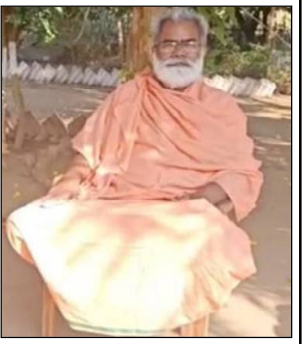
ଫୋନ କଲ ଆସିଥିଲା । ଆସନ୍ତା ବୋଲି ଧମକ ଦିଆଯାଇଥିଲା । ୪ ଦିନ ମଧ୍ୟରେ ହତ୍ୟା କରାଯିବ ବୋଲି ଧମକ ଦିଆଯାଇଥିଲା ।