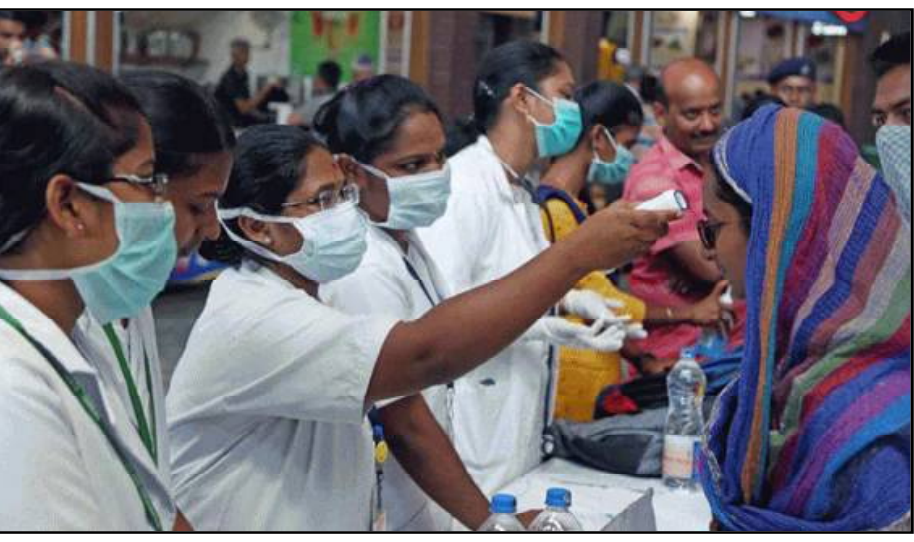
ମ୍ୟୁନିସିପାଲ କମିଶନର ଏବଂ ଏସପି ମାନଙ୍କୁ ଚିଠି ଲେଖିଛନ୍ତି । କରୋନା ନିୟମ କଢ଼ାକଢ଼ି ପାଳନ ହେଉଛି ନା ନାହିଁ, ତା ଉପରେ ନଜର ରଖି ପଦକ୍ଷେପ ନେବାକୁ ନିର୍ଦ୍ଦେଶ ଦେଇଛନ୍ତି । ଏହି ଚିଠିରେ ଲେଖା ଯାଇଛି ଯେ, ଅନେକ ସ୍ଥାନରେ ଲୋକେ ଆଉ କରୋନା ନିୟମ

ଭୁବନେଶ୍ୱର, ୨୧।୦୨ (ନି.ପ୍ର): ଗ୍ରାହକଙ୍କ ଭିଡ ଏବଂ ବଜାରର ଚଂଚଳତା ଭିତରେ ସାମୟିକ ଭାବେ ଲୋକେ ଯେମିତି ଭାବି ନେଇଥିଲେ ଯେ, କରୋନା ଚାଲିଯାଇଛି । ଭାବିବା ବି ସ୍ୱାଭାବିକ ଥିଲା କାରଣ, ହୁ-ହୁ ହୋଇ ରାଜ୍ୟରେ ବହୁଥିବା କରୋନା ସଂକ୍ରମଣ କମିଯାଇଥିଲା । ଆଉ ପ୍ରାୟ ୯ ମାସ ଭିତରେ ବାଣି ହୋଇ ରହିଥିବା ଲୋକମାନେ ବାହାରକୁ ବାହାରି ଆସିଥିଲେ । ହେଲେ, କରୋନାର ନୂଆ ନୂଆ ଷ୍ଟେନ୍ ଏବଂ ପଡୋଶୀ ରାଜ୍ୟରେ ବହୁଥିବା ସଂକ୍ରମଣ, କରୋନାକୁ ନେଇ ପୁଣି ଥରେ ଚିନ୍ତା କରିବାର ସମୟ ଆଣି ଦେଇଛି । ଆଜି ସ୍ୱେଚ୍ଛାକୃତ ରିଲିଫ୍ କମିଶନର, ରାଜ୍ୟର ସବୁ ଜିଲ୍ଲାପାଳ,