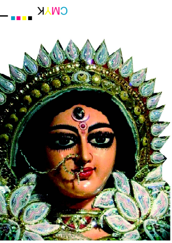
ସ୍ତ୍ରୀ ଦେବୀ ସର୍ବଭୂତେଷୁ.....

ବାଲେଶ୍ୱର ■ ଶୁକ୍ରବାର ୧୨ ଫେବୃଆରୀ ୨୦୧୧ ■ ମୂଲ୍ୟ ଟ. ୨.୦୦ ପଇସା ■ ପୃଷ୍ଠା ସଂଖ୍ୟା-୩୦ ■ Baleshwar ■ FRIDAY 12 FEBRUARY 2021 Vol.No. 31 ■ No. 41 ■ Price :Rs.2.00 ( 8 pages) ■ R.N.I. Registered No. 52528/91 ■ Postal Registered No. Balasore(Odisha)/005/2019