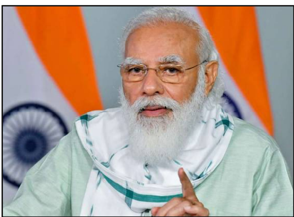
ଆମେରିକାରେ ମହାତ୍ମା ଗାନ୍ଧୀଙ୍କ ପ୍ରତିମୂର୍ତ୍ତିକୁ ଅପବିତ୍ର କରିବା ପାଇଁ ହୋଇଥିବା ଉଦ୍ୟମକୁ ସେ ମଧ୍ୟ ନିନ୍ଦା କରିଥିଲେ । ସେ କହିଥିଲେ

ନୂଆଦିଲ୍ଲୀ, ୩୦।୦୧ (ନି.ପ୍ର): ସଂସଦର ବକେଟ ଅଧିବେଶନ ପାଇଁ ଆଜି ଅନୁଷ୍ଠିତ ସର୍ବଦଳୀୟ ବୈଠକରେ ପ୍ରଧାନମନ୍ତ୍ରୀ ଶ୍ରୀ ନରେନ୍ଦ୍ର ମୋଦୀ ଉଦ୍‌ଘାଟନ କଲେ । ଏହି ଅବସରରେ ଆୟୋଜିତ ବୈଠକରେ ପ୍ରଧାନମନ୍ତ୍ରୀ ପ୍ରଥମେ ମହାତ୍ମା ଗାନ୍ଧୀଙ୍କ ପୂଣ୍ୟତିଥି ଉପଲକ୍ଷେ ତାଙ୍କ ପୁତ୍ରପୁତ୍ରୀ ଶ୍ରୀକାଞ୍ଚଳ ଅର୍ପଣ କରିଥିଲେ । ସେ କହିଥିଲେ ଯେ ବାପୁଙ୍କ ସ୍ୱପ୍ନ ସାକାର କରିବା ପାଇଁ ଆମେ ସମସ୍ତେ ଉଦ୍ୟମ କରିବା ଆବଶ୍ୟକ । ଆଜି ସକାଳେ