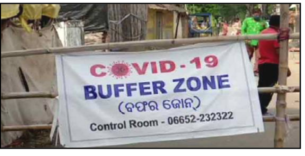
ବିଭାଗର ତଥ୍ୟ କହୁଛି-୭ଟି ପଡ଼ାରେ ଏ ବାବଦରେ ଖର୍ଚ୍ଚ ହୋଇଛି ୪ଲକ୍ଷ ୩୩ ହଜାର ଟଙ୍କା । ଏଠି ପ୍ରଶ୍ନ ସତରେ କଣ ଏତେ ଟଙ୍କା ଖର୍ଚ୍ଚ ହୋଇଛି ଜାଣିବା ପାଇଁ ଚିକେ ଲକଡାଉନ୍ ବେଳକୁ

ବଲାଙ୍ଗିର, ୩୦।୦୧ (ନି.ପ୍ର): ମହାମାରୀବେଳେ ହୋଇଛି ମହାଲୁଟ । ଲକଡାଉନ୍ ସମୟରେ ସରକାରୀ ଅର୍ଥ ଆୟୋଗରେ ମାଡିଥିଲେ ଅସାଧୁ ଅର୍ଥ ସର କେମିତି-ବଲାଙ୍ଗିରରୁ ଆସିଛି ସାଂଘାତିକ ଅଭିଯୋଗ ସାଙ୍ଗକୁ ତଥ୍ୟଗତ ପ୍ରମାଣ । ସହରର ବିଭିନ୍ନ ପଡ଼ାରେ କଞ୍ଚେନମେଝ କୋର୍ଡ ଘୋଷଣା ପରେ କେମିତି ବ୍ୟାରିକେଡ୍ ଲାଗା ବାବଦରେ ହରିଲୁଟ ହୋଇଛି ତାର ଦସାବିକ୍ ସାମ୍ନାକୁ ଆସିଛି । ୫ରୁ ୧୦ ଖଣ୍ଡ ଜୋଖା ବାଉଁଶ ବାନ୍ଧି ବିଲ୍ କରାଉ ଉଠାଇଛନ୍ତି ଲକ୍ଷାଧିକ ଟଙ୍କା । ପୂର୍ବ