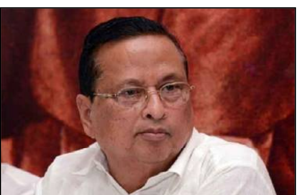
ଦଳ ସରକାର ଚାଲିଛି । ୨୦ ବର୍ଷ ଶାସନରେ ରାଜ୍ୟରେ କିଛି ଉନ୍ନତି ହୋଇ ନଥିବା ବେଳେ ଗଞ୍ଜାମ ଜିଲ୍ଲାରେ ଗୋଟିଏ ମଧ୍ୟ କଳକାରଖାନା ପ୍ରତିଷ୍ଠା ହୋଇପାରିନି । ଯାହା ବି ହୋଇଛି ତାହା କଂଗ୍ରେସ ଅମଳରେ ହୋଇଛି । ଜାତିର ପିତା ମହାତ୍ମା ଗାନ୍ଧୀଙ୍କ ଚିରୋଧାନ ବିଦସ କଳକାରଖାନା ପ୍ରତିଷ୍ଠା ଅବସରରେ

ଭୁବନେଶ୍ୱର, ୩୦।୦୧ (ନି.ପ୍ର): ପେଟ୍ରୋଲ ଓ ଡିଜେଲ ଦର ପ୍ରତିଦିନ ବଢ଼ି ଚାଲିଛି । ଏଥିରେ ଚେକ୍ ଲାଗିବା ସହିତ ଆସନ୍ତା ୧୫ ତାରିଖ ମଧ୍ୟରେ ତେଲ ଦର ସର୍ବନିମ୍ନ ୧୦ ଟଙ୍କା କମାଯାଉ । ତେଲ ଦର ନକମିଲେ ଆସନ୍ତା ୧୫ ତାରିଖରେ ଓଡ଼ିଶା ବନ୍ଦ ଡାକିବା ଦିଆଯିବ । ଭୁବନେଶ୍ୱରରେ ଆୟୋଜିତ ସହିତ ବିଦସ ଅବସରରେ ରାଜ୍ୟ ଓ କେନ୍ଦ୍ର ସରକାରଙ୍କୁ ଏପରି ଚେତାବନୀ ଦେଇଛନ୍ତି ପିସିସି ସଭାପତି ନିରଞ୍ଜନ ପଟ୍ଟନାୟକ । ବିଜେଡିକୁ ତାହାଲ୍ୟ କରି ଶ୍ରୀ ପଟ୍ଟନାୟକ କହିଛନ୍ତି, ରାଜ୍ୟରେ ବିଲୁ ଜନତା ଦଳ ସରକାର ନୁହେଁ, ବିଚିତ୍ର ଜନତା