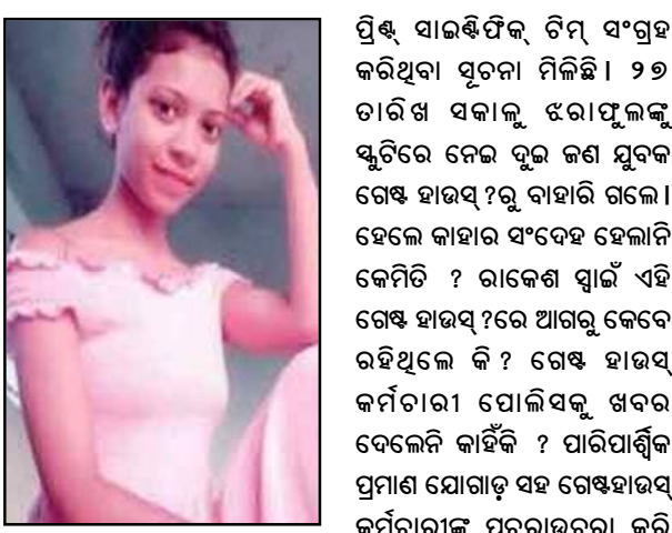
ସାଇଣ୍ଟିଫିକ୍ ଟିମ୍ ତାହାର ସୁରାଗ ଖୋଜିଛି । ରୁମ୍ ଭିତରୁ ଆପରିକନକ ସାମଗ୍ରୀ ଓ ଫିଙ୍ଗର