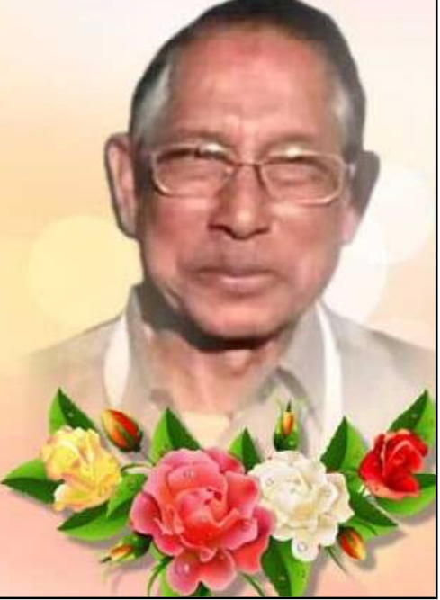
ଅଧ୍ୟକ୍ଷ ଓଡ଼ିଶା ଭାଷା ସଂରକ୍ଷଣ ଏବଂ ଗବେଷଣା ପ୍ରତିଷ୍ଠାନ, ବିପିନ ବିହାରୀ ପାଠାଗାର, ଜଟଣୀ ଦୂରଭାଷ : ୯୯୩୮୩୪୪୧୩୮